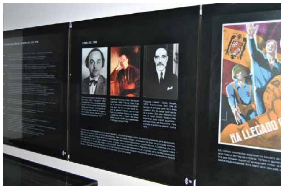
• Sala central del MUME. El sr. Picas havia qüestionat el MUME en el seu article publicat a L'Esquerda 141