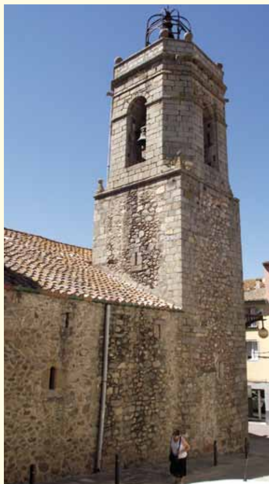
• Façana nord del campanar - Juliol 2013

Va ser a partir dels s.XI, XII i XIII que es començaren a fondre campanes de major grandària i quan, segons la importància dels temples, es començaren a construir les majors torres o campanars. No cal ni dir que a les catedrals, monestirs i esglésies de municipis importants és a on s'elevaren els principals i que donaven cabuda i sostenien a les campanes de major volum, propiciant que en algunes de les esglésies més importants s'hi arribessin a construir fins a nou campanars.