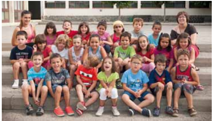
• El Casal 2013