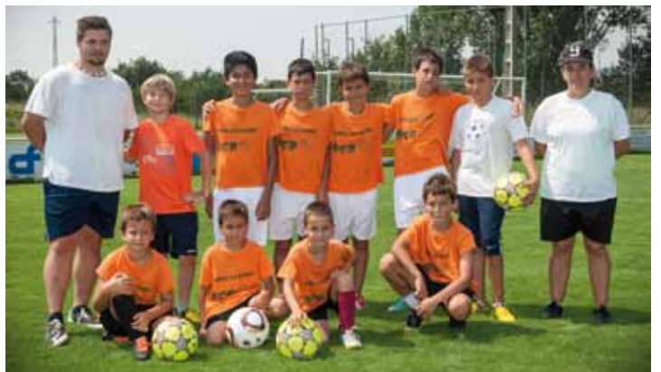
• El Casal del futbol