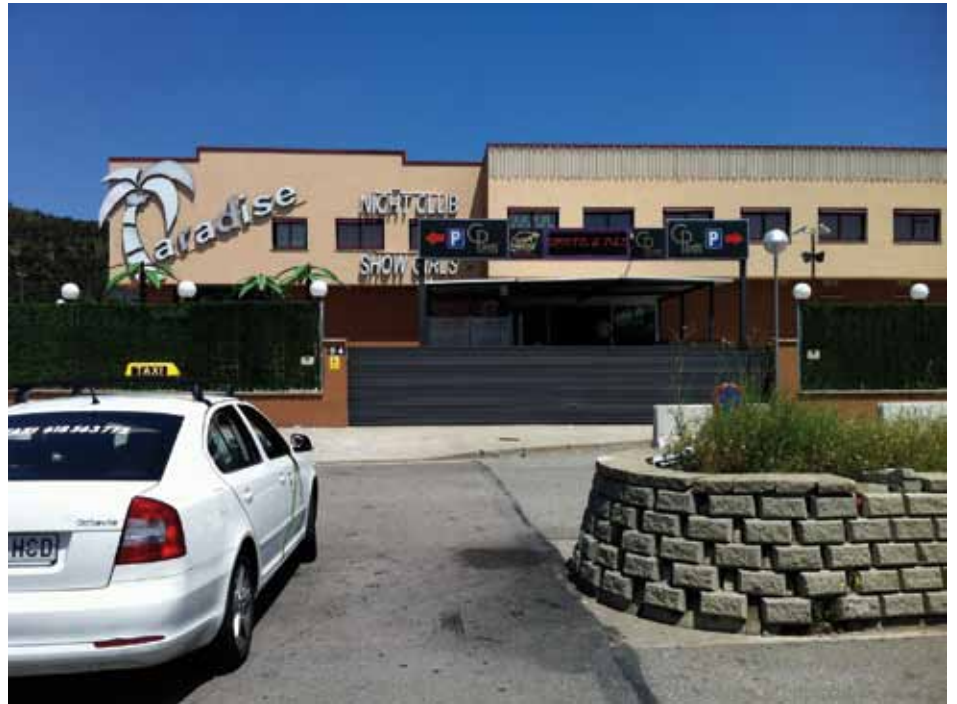
• Entrada al Paradise, a mitjans del juliol de 2013