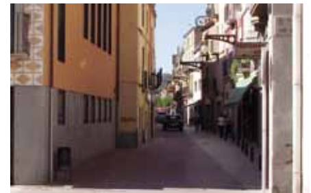
• Carrer Major a l'alçada de l'edifici consistorial

El municipi que té un percentatge més elevat de persones ateses per Benestar Social és la Jonquera, amb un 18% de la població que va acudir a aquest servei. La segueixen Llançà, Castelló d'Empúries i Sant Pere Pescador. Són les poblacions amb un nombre més elevat de veïns en situació de vulnerabilitat.