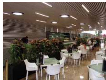
• Bar La Tour Eiffel, al centre outlet Gran Jonquera, un dels darrers establiments de restauració que s'han obert al municipi

ampla, entenen-se que es refereix a línies amb servei ADSL.