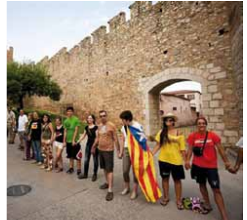
• Assaig de la cadena humana a Montblanc aquest estiu

A més a més, entre el 15 d'agost i l'11 de setembre, desenes de cadenes humanes es duran a terme arreu del món, són la Via Ca-