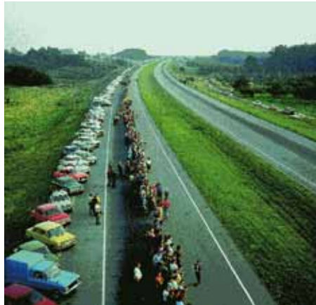
• Imatge de la Via Bàltica, l'any 1989

La Via Catalana s'ha inspirat en la Via Bàltica, que els ciutadans d'Estònia, Letònia i Lituània van fer el 23 d'Agost de 1989, per reclamar la seva independència del domini soviètic al que es van veure sotmesos després del pacte entre Alemanya i Rússia al 1939. En aquella ocasió, gairebé dos milions d'estonians, letons i lituans uniren les