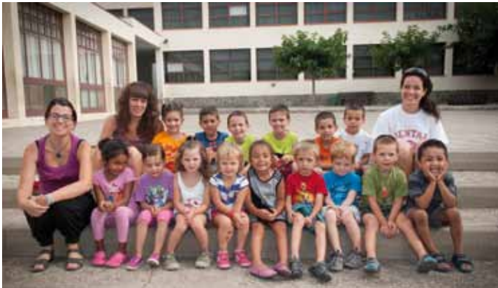
• El Casal 2013