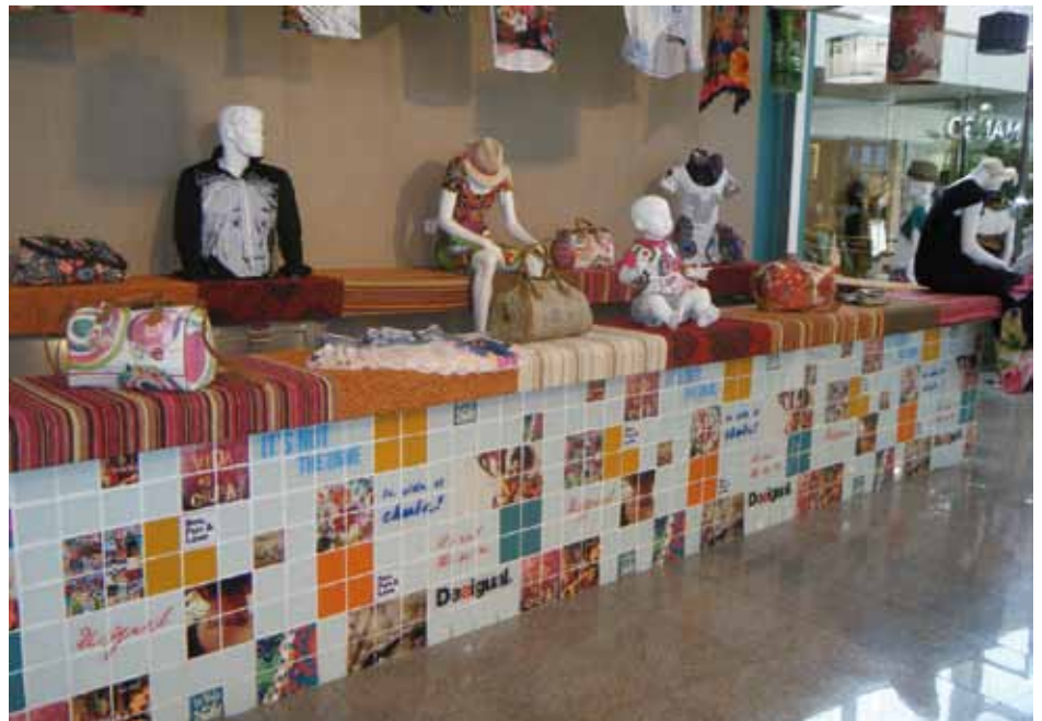
• Detall del que fou la barra del restaurant, ara un aparador de l'espai Desigual a Mas del Pla

Pel que fa a Mango, es troba a la part dreta de la botiga multimarca. Així doncs ara MNG disposarà d'una gran botiga situada al sud de