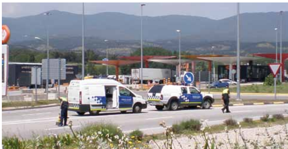
• La Policia Local de la Jonquera en un control a la carretera N-II