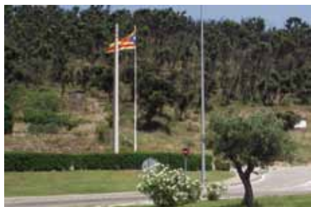
• L'estelada torna a ser present a l'entrada de la Jonquera, a la rotonda dels bombers

L'Ajuntament de la Jonquera s'ha proposat millorar estèticament l'entrada de la vila a l'alçada de la rotonda dels bombers. L'objectiu és que un dels pendents amb forma de semicircumferència a la rotonda incloguin el text "La Jonquera". Aquest text es faria amb pedra natural de color vermell, per tal que destaqués sobre la gespa que l'envoltaria. Segons ha informat l'alcalde a Infojonquera.cat es tractaria de fer-ho amb un sistema sostenible en manteniment, similar a les rotondes de França. A més, també s'ha recuperat l'estelada que uns desconeguts van fer desaparèixer el novembre passat.