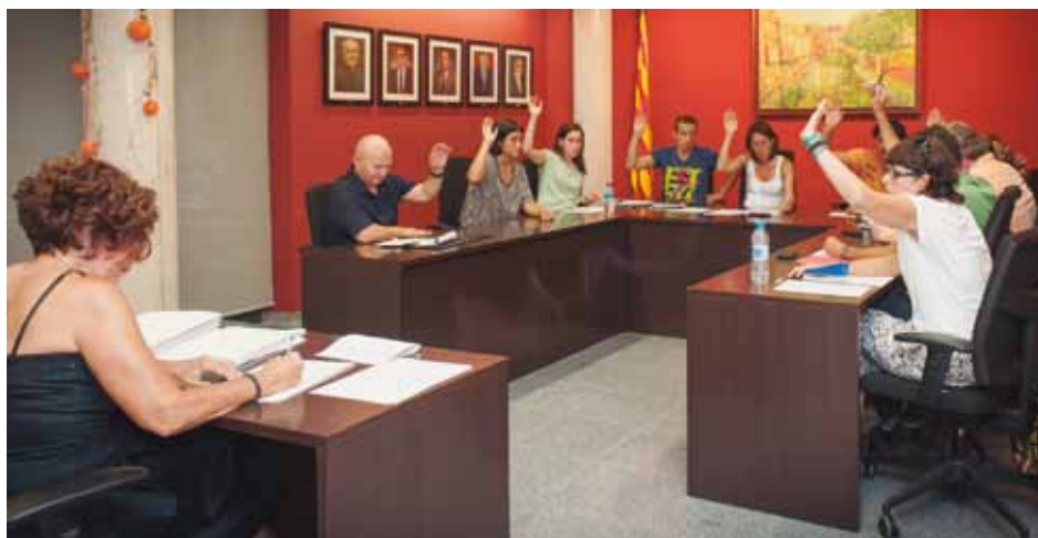
• Una imatge del Ple municipal celebrat el darrer dijous de juliol

Tot i votar a favor d'aquest punt el grup d'ERC va fer esment al fet que, si bé tothom ha de pagar les multes per infracció del codi de circulació, cal tenir present que els estrangers es trobaran a partir d'ara en desavantatge per presentar recursos, suposant que fos el cas. Jaume Domènech va insinuar que no sempre hi ha el mateix tracte o persecució per part de l'equip de govern entre els conductors infractors de cotxes estacionats en zones blaves i els xofers de camions mal estacionats als polígons. Finalment el portaveu republicà també va donar a entendre que amb el nou acord potser hi havia un cert afany recaptatori, un apunt en el qual fins i tot el regidor Miguel Angel Botana, del PP, hi va estar "bastant" d'acord. Per la seva banda l'Alcaldesa va rebutjar que hi hagués un afany recaptatori i de fet va aconseguir que ERC i PP se sumessin a la proposta.