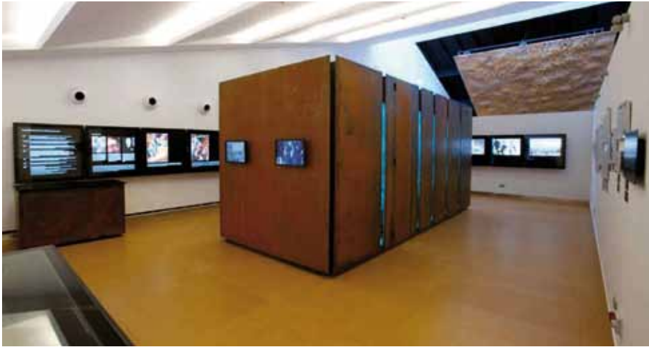
• Sala central del MUME. El sr. Picas havia qüestionat el MUME en el seu article publicat a L'Esquerda 141

• Article referent a una opinió publicada a L'Esquerda de la Bastida 141