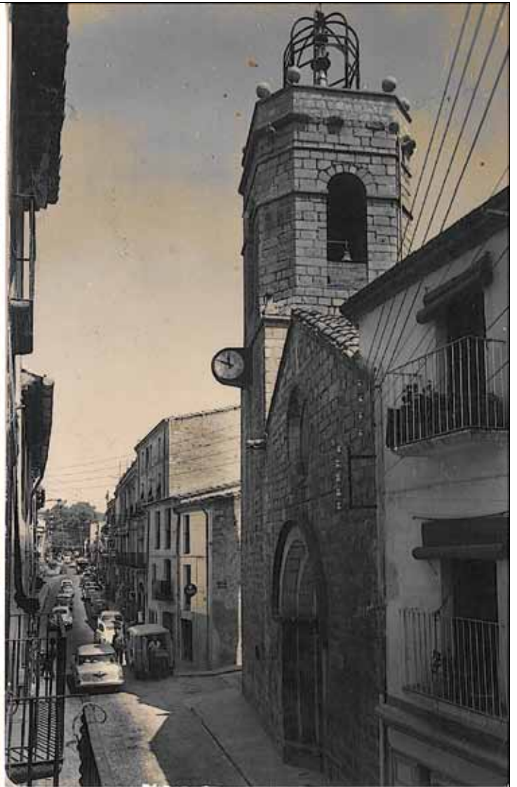
Mitjan segle XX

de la reparació de la finestra que més tard es va fer. Per esmorteir el xoc amb el sol, es col·locaren un tou de feixines de bruc sota la finestra, però el pes de la grossa campana les esmicolà a terra i ella va quedar esbardellada en uns quants trosos”.