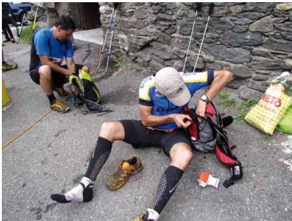
• Fent canvi de mitjons en un avituallament