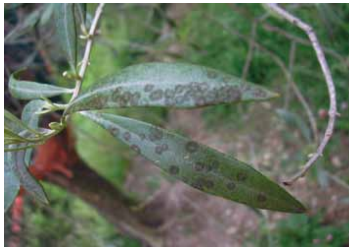
• Fulles d'olivera atacades pel repló en un estat d'afectació diferent a l'altra imatge

Després de parlar de l'arna de l'olivera a l'anterior article, en aquesta ocasió parlarem de l'ull de gall, altrament dit repló o "repilo o vivillo", en castellà. És una malaltia produïda pel fong Spilocaea oleagina . El repló provoca taques negres i grises a la cutícula o part superficial de la fulla i del fruit, que van venint grogues o verdes i cauen al final de la primavera.