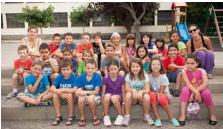
• El Casal 2013