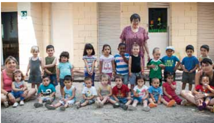
• El Casalet de la Llar d'Infants