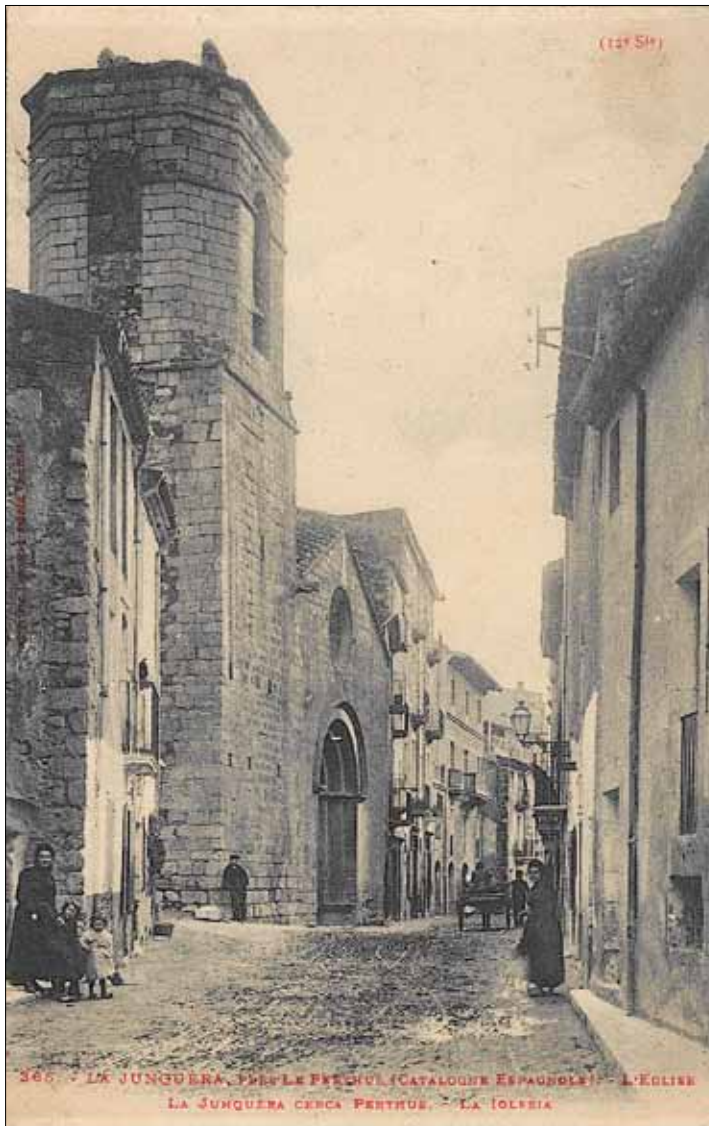
Principi segle XX

• Església de Santa Maria de la Jonquera