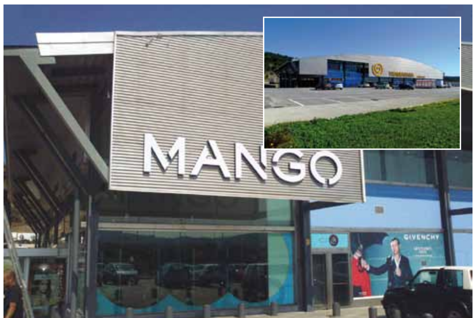
• Façana exterior de Tramuntana Mas del Pla

Les botigues ara estan de rebaixes fins el 31 d'agost. ■