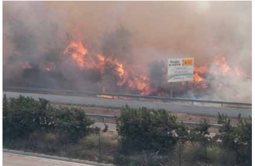
• El bosc del Serrat de la Plaça, a l'altre costat de l'AP7 davant l'edifici de La Caixa, el 22 de juliol de 2013

Tot plegat un símptoma evident que els incendis a l'Albera i la seva recuperació segueixen un cicle periòdic. Tan periòdic com previsible. La reflexió, doncs, potser ha de ser aquesta: si és previsible, no és també evitable?