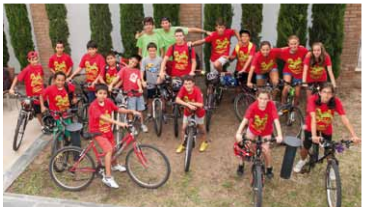
• El Casal dels Joves