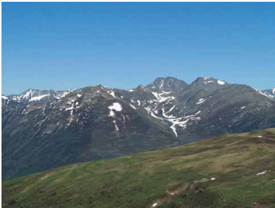
• Gaudint dels paisatges de l'alta muntanya andorrana

i després 1.400 metres de baixada, vorejant Andorra la Vella.