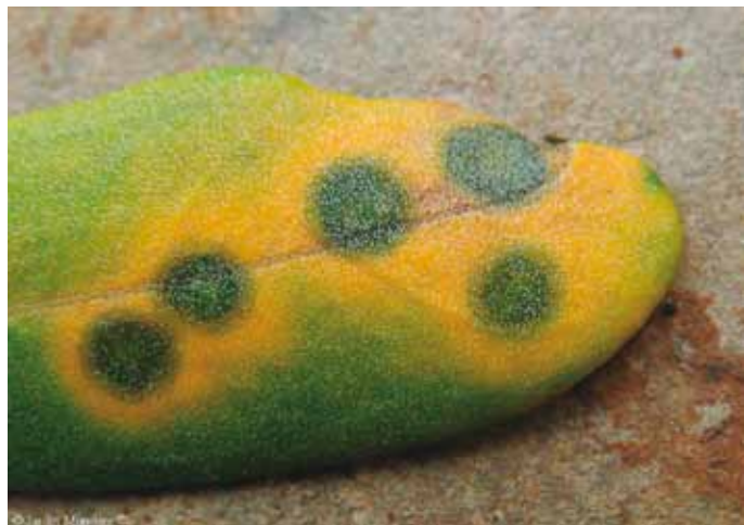
• Fulla d'olivera afectada pel repló