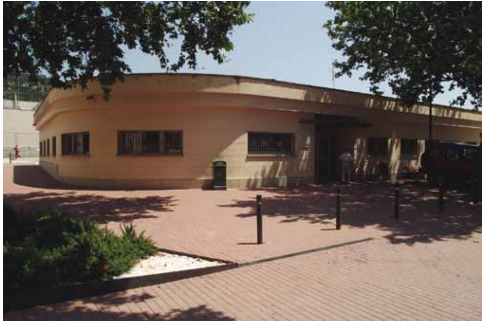
Els fets van passar davant el Centre d'Assistència Primària Dr. Subirós de la Jonquera

Posteriorment, agressor i agredit es van separar i, en principi, l'un va anar per una banda i l'altre per l'altra. Però no va ser així, ja que l'instigador de la batussa va anar a trobar la víctima quan es dirigia al centre d'assistència primària Doctor Subirós de la Jonquera, on anava a curar-se les ferides del braç i a demanar un informe sobre els cops que havia rebut durant la batussa. Eren quarts d'una del migdia quan l'agressor va disparar diversos trets contra el seu compatriota, que va entrar a refugiar-se al centre mèdic amb una ferida al cap. Un testimoni dels fets, que diu que almenys va sentir dos trets, va trucar immediatament a la policia local, que, en vista de la gravetat dels fets, també va alertar els Mossos d'Esquadra. Tot i la rapidesa amb què es van desplaçar els policies fins al lloc dels fets, el pistoler ja havia fugit. La víctima, en canvi, va haver de ser traslladada en ambulància fins a