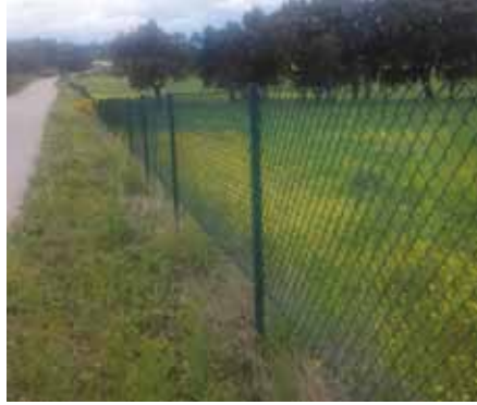
• La polèmica tanca de Cantallops que pot significar un cost de 85.000 euros per l'ajuntament

nicipals i avança que convocarà pròximament una reunió pública per explicar l'estat jurídic de la qüestió.