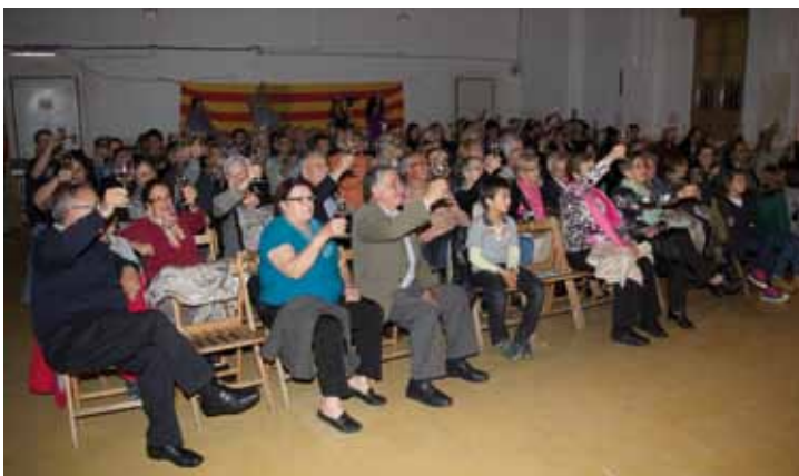
• Fotografies d' "Un tast reial", tast de vins teatrelitzat per la companyia "Teatre Somelier" celebrat el 19 d'abril a Cantallops dins els actes del festival VÍVID