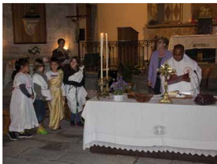
• Imatges del "Sant sopar" en representació a càrrec dels infants de la catequesis (Dijous Sant) i del Viacrucis i celebració de la Creu, processó de la llum pels carrers del casc antic de la Jonquera del divendres Sant.