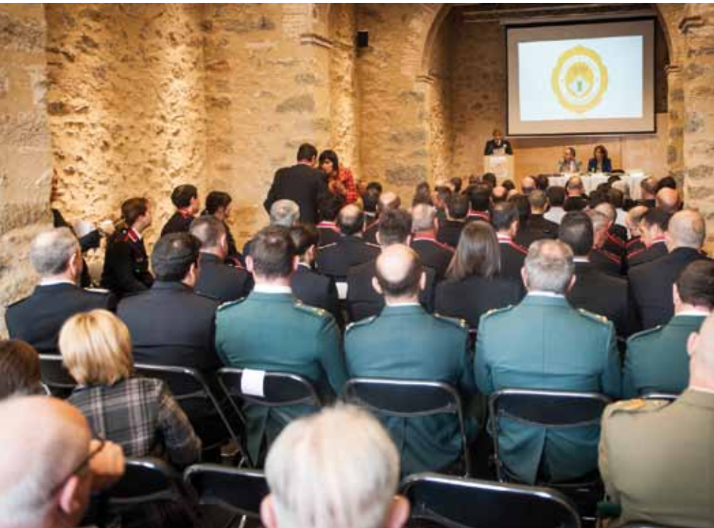
• Festa de la Policia Local de la Jonquera