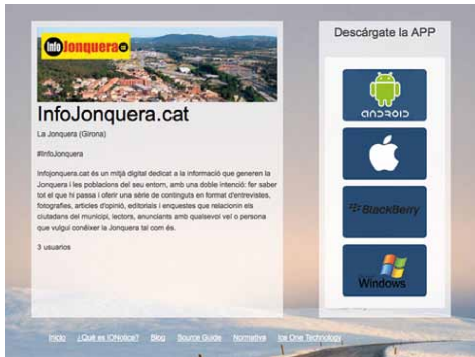
• Captura de pantalla de l'aplicació d'Infojonquera.cat amb IONotice

Es pot trobar la Font InfoJonquera.cat a la categoria Mitjans de Comunicació o introduint directament l'identificador #InfoJonquera.