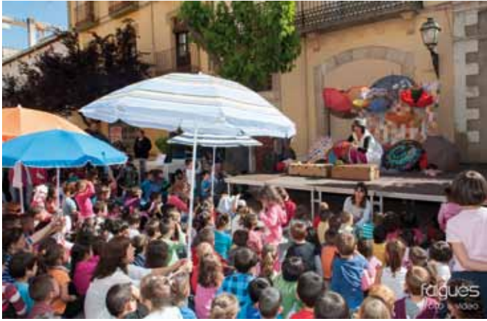
• Sant Jordi a la Jonquera

• Selecció d'imatges de Falgués Fotografia