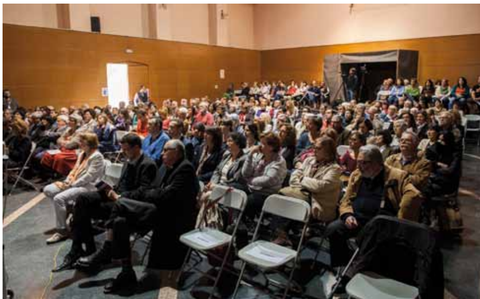
• Un moment de la jornada commemorativa a La Societat de la Jonquera

Reflexions com aquesta es van deixar sentir durant tot el matí entre les persones que van ser presents als actes de commemoració i que la majoria, van viure en pròpia pell o en la dels seus familiars què comporta l'exili o la repressió franquista.