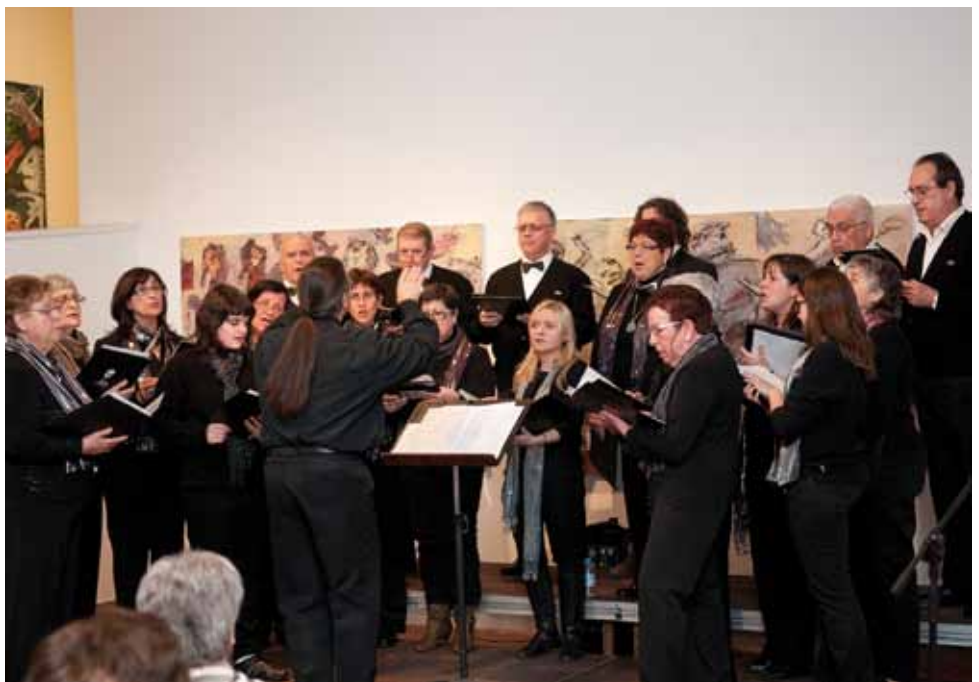
• L'Orfeó Jonquerenc en una imatge d'arxiu

Mitjançant un recital col·lectiu amb el màxim de corals participants, té per objectiu fer memòria pública d'una tria de cançons del nostre patrimoni musical popular més emblemàtic, per manifestar d'aquesta manera la persistència del poble català al llarg dels temps, i també per reivindicar un model lingüístic, cultural i polític que garanteixi la