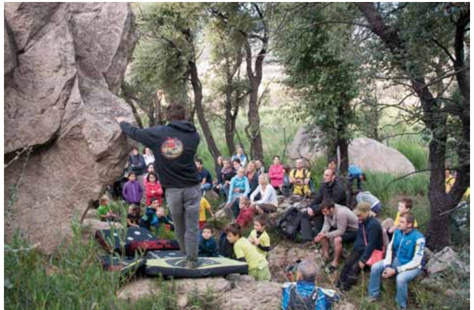
• Exhibició en escalada al Roc de Miradones el diumenge 6 d'octubre de 2013