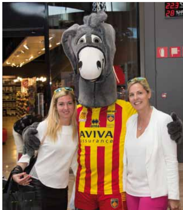
• La USAP i el Gran Jonquera, "amics per sempre" amb la signatura de l'acord de suport i col·laboració