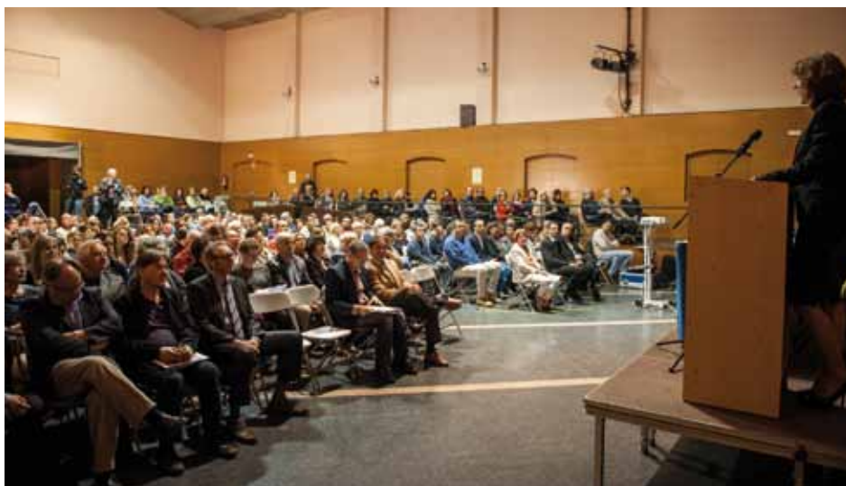
• El públic assistent va omplir la sala-teatre de La Unió Jonquerenca