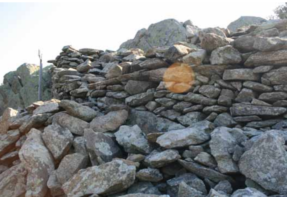
• Castell de l'Esquerda de la Bastida (Particular)