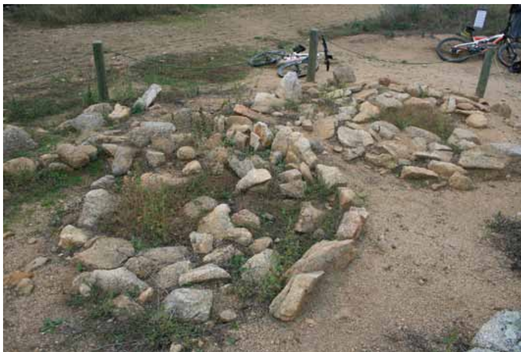
• Tombes tumulars circulars de l'edat del bronze final, al Mas Baleta, al costat del monument megalític Mas Baleta III.

Estrabó descriu les terres al voltant d'Empúries i distingeix entre les que són bones i les que només produeixen espart i joncs. El topònim IONKARION PEDION , referit a aquestes darreres, s'ha conservat fins avui a la Jonquera. L'àrea d'aiguamolls i de joncs ocupava bona part de la plana empordanesa i arribava, seguint el Llobregat i la Via Augusta, sota el coll de Panissars i els Trofeus de Pompeu. Estrabó també descriu