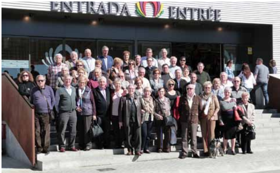
• El diumenge 6 de abril es va celebrar la XXIV Trobada de soldats de la lleva del 1962