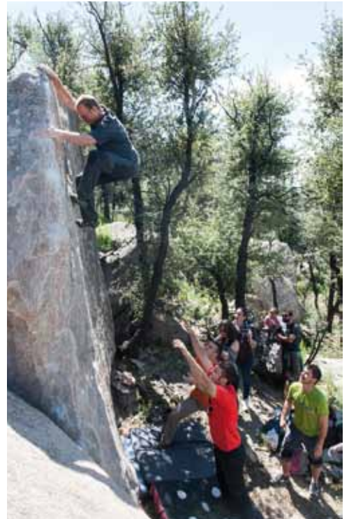
• Escalada en bloc