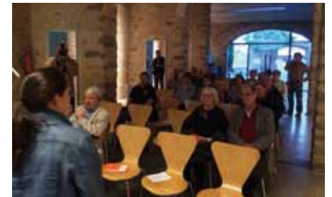
• Can Laporta va acollir dues conferències de la Fundació Catalunya Estat

L'Assemblea Nacional Catalana de la Jonquera, conjuntament amb la Fundació Catalunya Estat, va organitzar la tarda del passat 25 d'abril, dues xerrades informatives. A la primera, dirigida a les persones grans, es va parlar de les pensions a la Catalunya independent i la segona, enfocada al teixit empresarial, va tractar sobre el dèficit fiscal i les limitacions que se'n deriven. Una i altra van generar debat a l'acabar l'intervenció dels conferenciants de la Fundació.