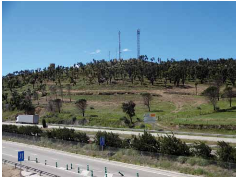
• El mes d'abril s'ha netejat el sotabosc cremat el juliol de 2012 a la zona del Serrat de la Plaça

La neteja del sotabosc que s'ha fet als boscos propers a la carretera i l'autopista deixa imatges com aquesta: un bosc clar i una herba verda per les pluges d'abril.