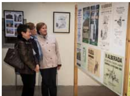
• Tres veïnes de la Jonquera observen alguns cartells de l'exposició

La tarda del divendres 4 d'abril es va inaugurar l'exposició de cartells que porta per nom "32 anys del GAT" al Centre Cultural de l'Albera. La proposta cultural es va poder veure fins el passat 13 d'abril als Porxos de Can Laporta i era organitzada conjuntament per la Regidoria de Cultura i el Grup d'Art i Treball.