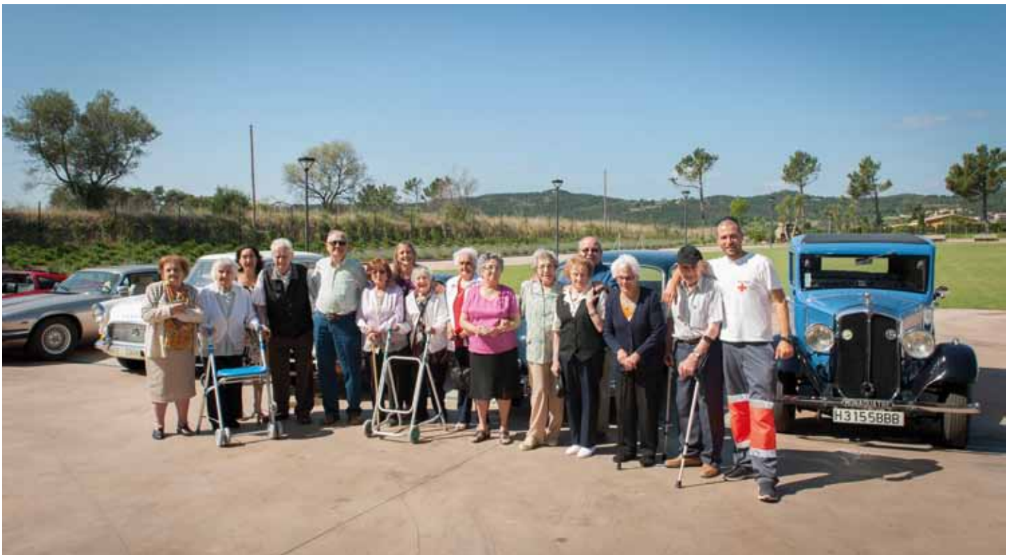
• Visita del Centre de Dia de la Gent gran d'Agullana a les instal·lacions de Clàssics Agullana el 30 de juny