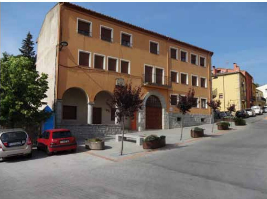
• Agullana ja pot pagar els impostos a la hisenda catalana sense impediments del Govern espanyol