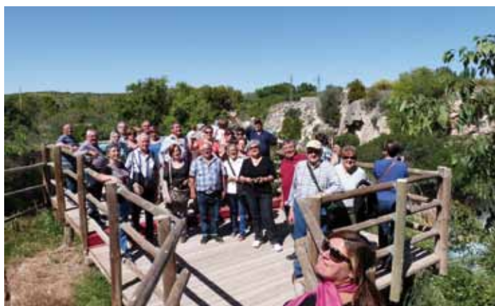
• Fotografies del viatge del Casal de l'Avi de la Jonquera a Castilla La Mancha, amb visita a les Lagunas de Ruidera i el Corral de las Comedias (Particular)