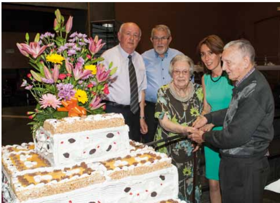
• Una imatge del dinar d'homenatge a la Gent Gran