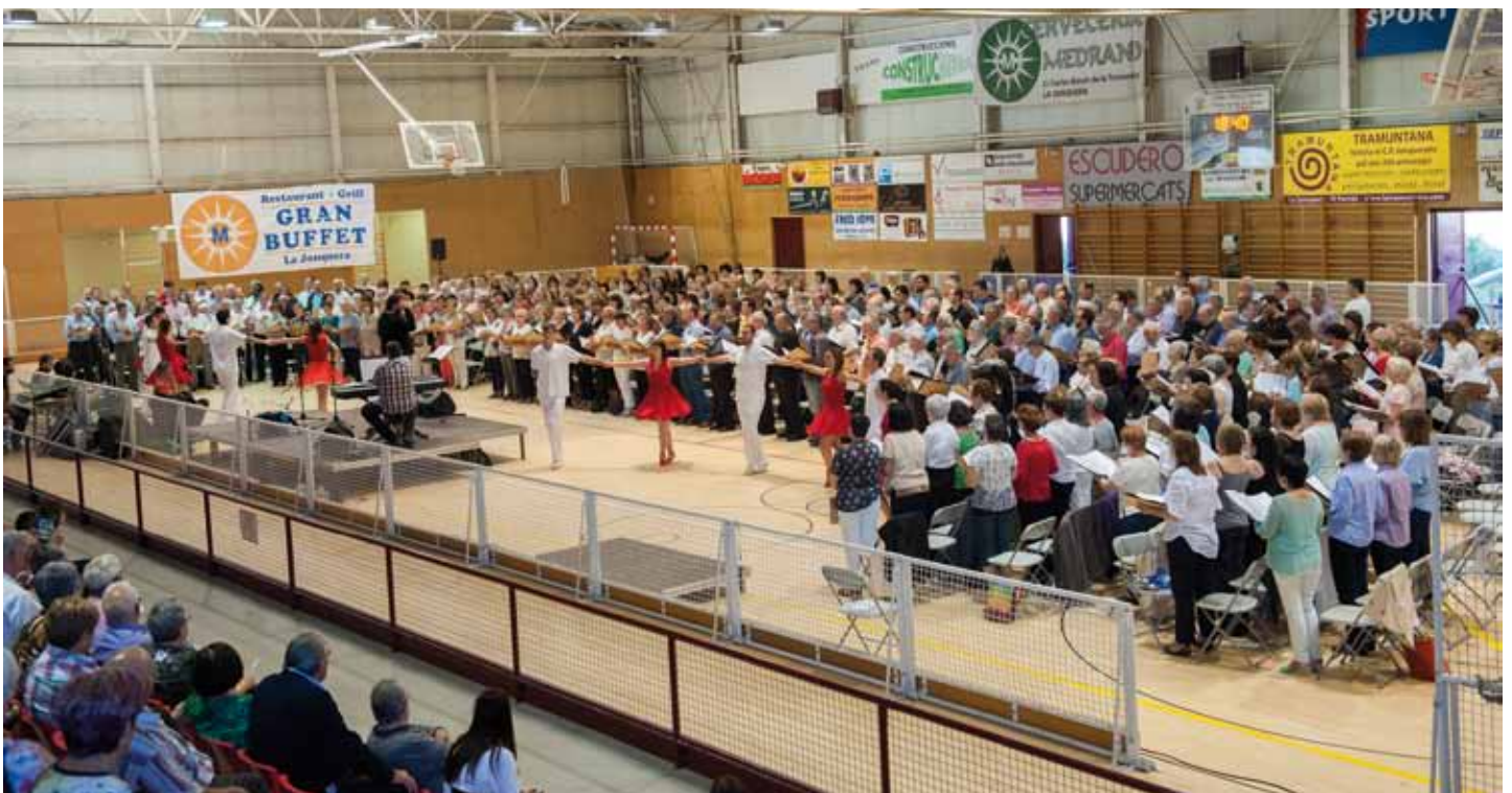
• El concert 'Cantem en llibertat', diumenge 1 de juny, a la Jonquera