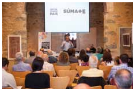
• Una bona assistència a la xerrada del col·lectiu “Súmate” a Can Laporta

A la xerrada, a la qual hi van assistir una vintena de persones, va tenir un to distès i proper, en què els ponents van explicar la seva visió sobre el procés. Van negar que existís discriminació del castellà, com alguns mitjans de l'Estat espanyol apunten, i van confirmar que es pot ser castellanoparlant i independentista sense complexos. De fet, un dels objectius de l'associació, tal com es mostra en el seu fulletó de presentació, és trencar alguns dels tòpics amb els que el govern o la premsa de l'Estat espanyol pretenen fer front al creixent moviment independentista, com ara que els espanyols residents a Catalunya haurien de renunciar a la nacionalitat espanyola o que no es permetria l'ús del castellà en un futur Estat català independent.