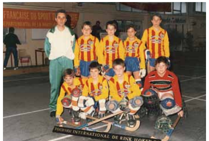
• Com a entrenador a Blagnac (CPJ)