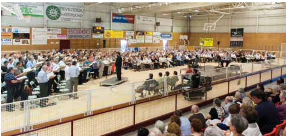
• El concert 'Cantem en llibertat', diumenge 1 de juny, a la Jonquera