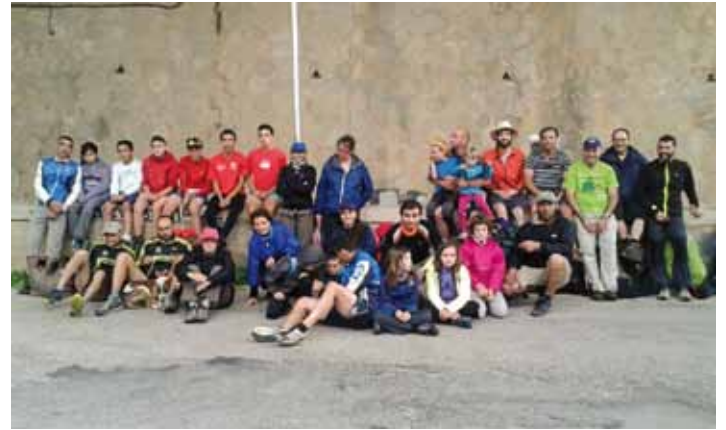
• El cap de setmana del 27 al 29 de juny el CEJ va organitzar la tradicional Travessa de l'Albera, entre la Jonquera i Portbou