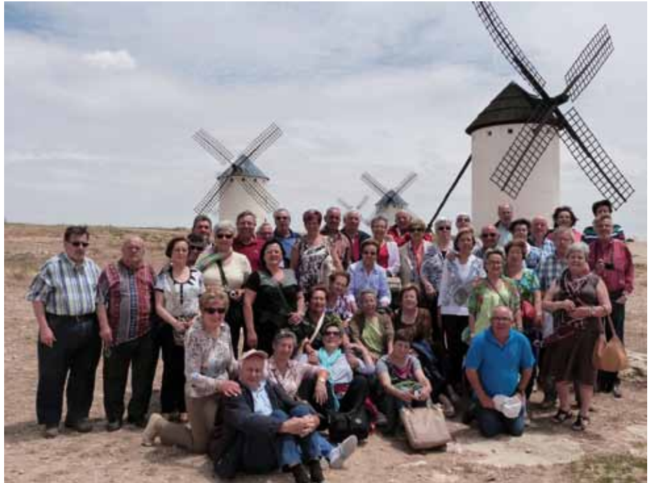
• Visitant els molins de Campo de Criptana (Particular)

Dia 28, amb guia local, sortida cap a Valdepeñas per visitar el Museu del Vi ubicat en una típica bodega, va ploure una miqueta. Després de dinar vàrem fer un recorregut