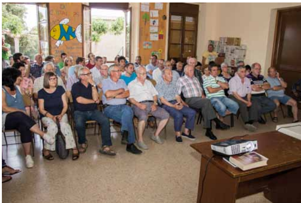
• La polèmica tanca de Cantallops va ser el motiu de l'afluència important de veïns a la reunió

del jutjat de Girona –del 2010– i que això ha acabat fent incrementar en 20.000 euros el que ha de pagar el consistori. L'Ajuntament renuncia ara a fer diverses obres per destinar els diners a despesa corrent i poder assumir així els 117.000 euros.