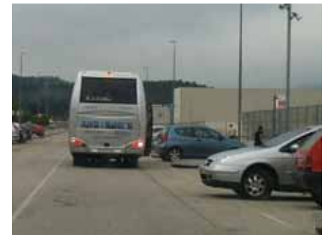
• El nou servei impulsat pel Govern serà gestionat per l'empresa David i Manel SL

El nou servei impulsat pel Govern serà gestionat per l'empresa David i Manel SL, i té com a objectiu garantir l'accessibilitat a la presó amb transport públic.