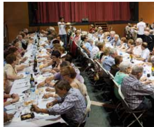
• Festa de la Gent Gran