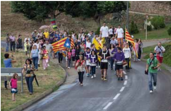
• Arribada de la Flam del Canigó a Cantallops i homenatge a les dones per part del Bisbe de Girona amb motiu de la romeria de la Tramuntana a Requesens