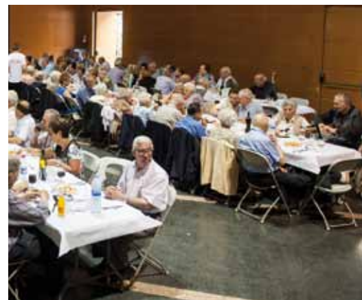
• Festa de la Gent Gran