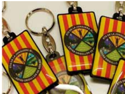
• Mostra dels clauers que ofereix gratuïtament la botiga Arnau Disseny de Figueres