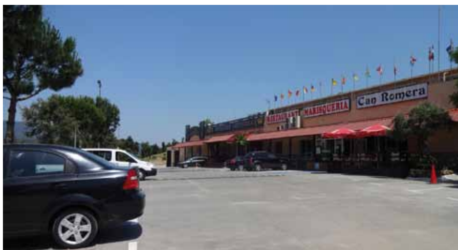
• Façana del complex que acull el prostibul Lady's Dallas i el restaurant, dins el terme municipal d'Agullana