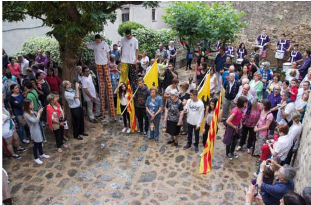
• Cantallops va homenatjar les dones amb la Flama del Canigó aquest any 2014