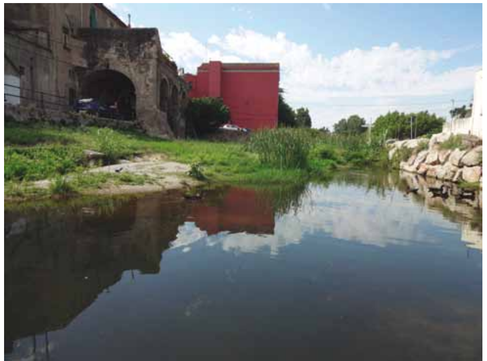
• El Llobregat en el tram més urbà a finals de juny

El juny ha estat un mes amb poca pluja, com tota la primavera. El Llobregat porta poc cabal i la vegetació ha crescut molt en els trams més urbans.