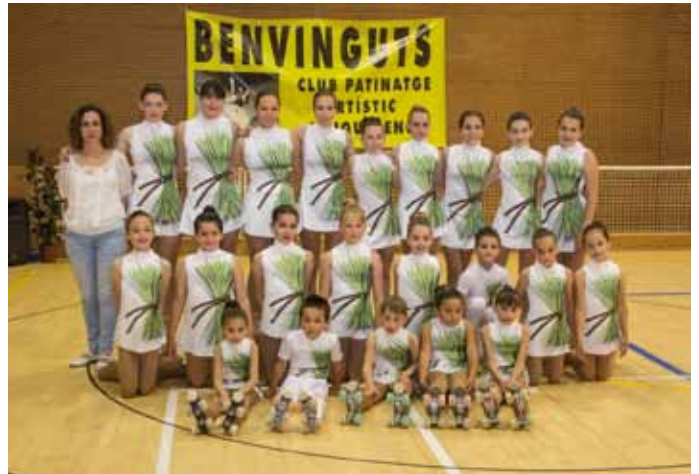
• El festival de patinatge va tenir una molt bona acollida

El dissabte 31 de maig el pavelló poliesportiu de la Jonquera va ser l'escenari del Festival de Patinatge Artístic que cada any organitza el Club de Patinatge local. L'esdeveniment va començar a les 5 de la tarda i es va allargar fins a la vesprada, amb la participació dels clubs de patinatge artístic de la Jonquera, Figueres, Llers i Peralada. Un bon nombre de patinadors i patinadores que van fer gaudir una graderia plena a vessar amb diferents espectacles i coreografies.