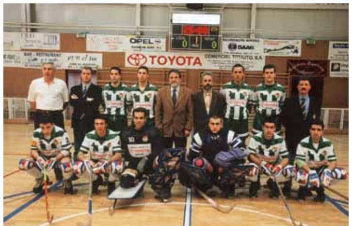
• Fotografia oficial de l'ascens a Divisió d'honor (CPJ)