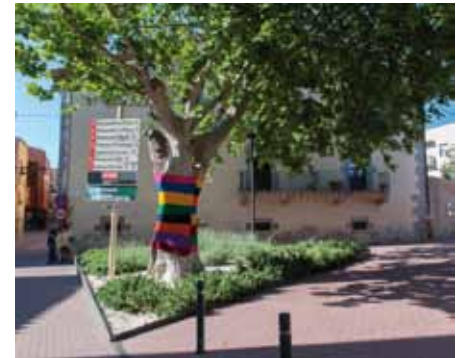
• L'arbre de davant de Can Laporta

Un col·lectiu de dones de la Jonquera es va reunir el passat mes març per activar a la vila l'art del Yarn Bombing. El seu objectiu era "decorar el mobiliari urbà del poble" a més d'alguns "arbres de tronc gruixut", segons van comunicar en el seu moment, i així fer de la Jonquera "un poble bonic, curós i presumit". Doncs això és el que van fer a principis de juny quan van fer dues intervencions als arbres de la Plaça de Can Laporta i a la Plaça de l'Ajuntament. Aquesta modalitat artística, originària dels EUA, també s'ha implantat amb algunes mostres a Cantallops i Agullana.