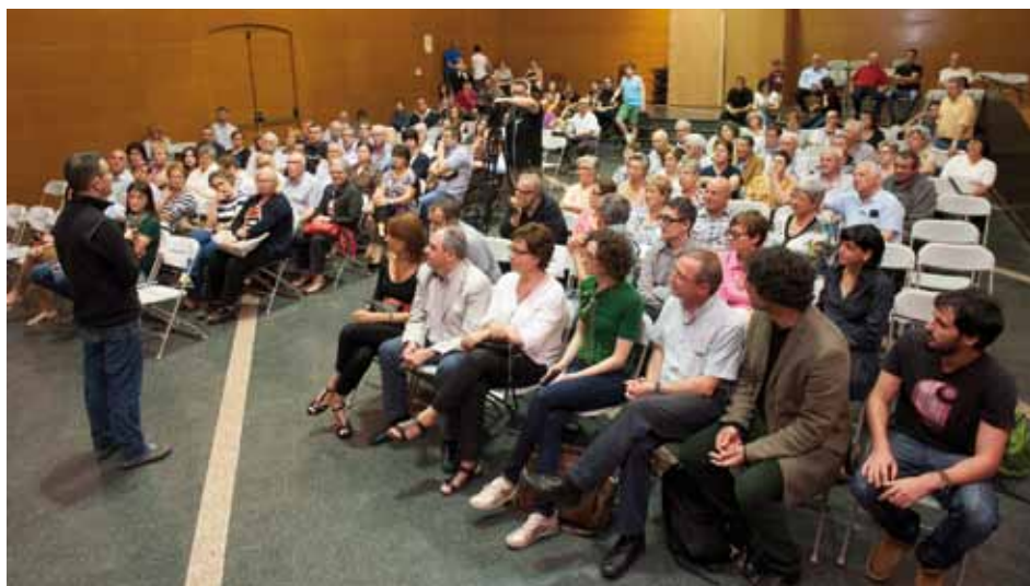
• Moments abans de començar l'emissió del documental

El documental es va preestrenar el 6 de juny a la sala de la societat La Unió Jonquerenca, amb una gran assistència de públic que va valorar molt positivament el resultat. TV3 el va emetre el 10 de juny a l'espai Sense ficció i va obtenir la segona audiència a la graella de la televisió a Catalunya.