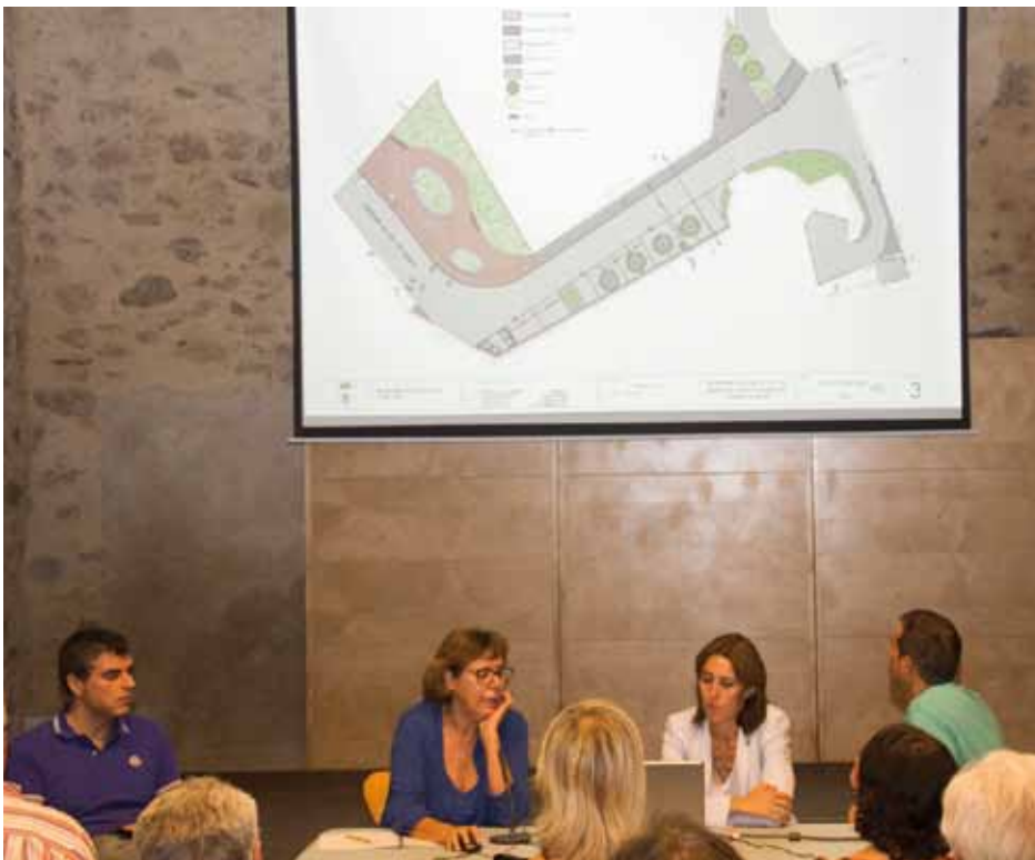
• Presentació amb pantalla gegant de la proposta de prolongació del carrer Albera

tància que es tracta d'un procés de Participació Ciutadana amb els veïns amb l'objectiu de presentar la memòria valorada de l'esmentat carrer. A la reunió, a la qual hi van assistir una vintena de veïns, es van poder escoltar les demandes i suggeriments per part d'aquests i a partir d'ara s'espera redactar el projecte definitiu i començar obres a la tardor.