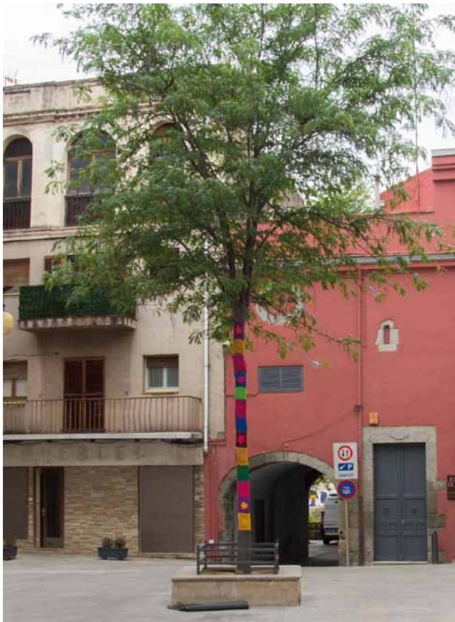
• L'arbre de la Plaça de l'Ajuntament amb decoració "yarn bombing"