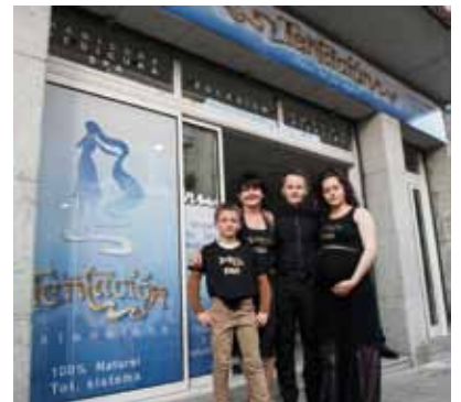
• Inauguració de la nova perruqueria Tentación