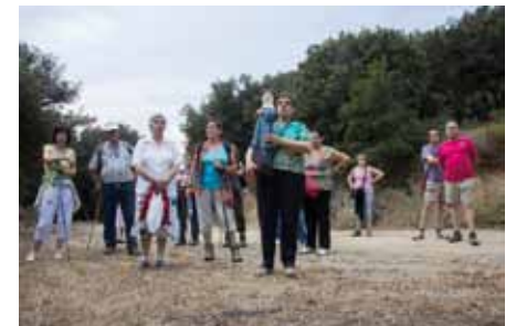
• Dimarts 24 de juny Cantallops va tornar a reviu el romiatge a Requesens