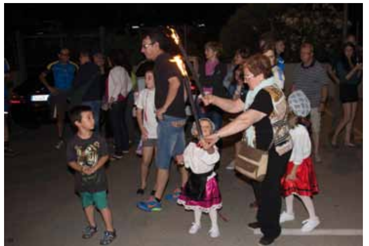
• Arribada de la Flama del Canigó a la Jonquera per part del Centre Excursionista Jonquerenc, amb cursa de relleus des del massís del Canigó fins a la vila