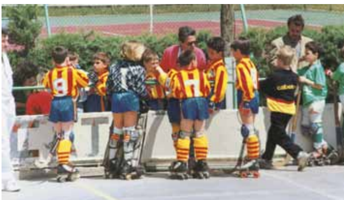
• En plena "arenga" als seus jugadors (CPJ)