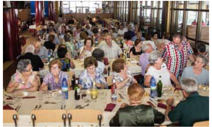
• El 28 de juny els socs de la Llar del Jubilat van celebrar una trobada en homenatge als avis de l'edat de noranta anys. El dinar es va fer al Buffet El Mirador