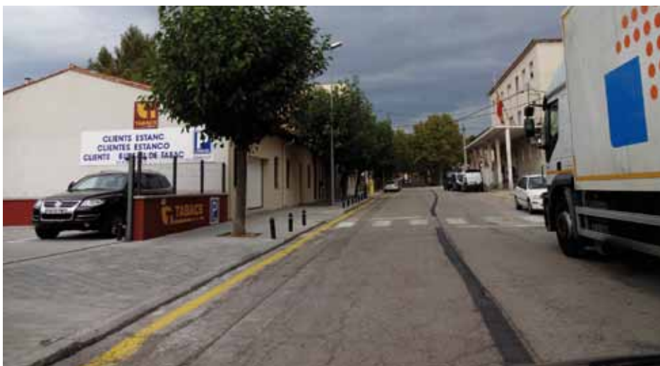
• La senyalització horitzontal s'ha realitzat aquests dies del mes de novembre, pendent de refer trams com el del final del carrer Major

definir millor el centre de carrer i els aparcaments. Aquest seria el cas del tram final del carrer Major en la zona de confluència amb el carrer Pau Casals. El repintat original en blanc s'ha rectificat en pintura de color gris. Un altre dels tram afectats és el carrer Arriate, on encara no ha quedat clar el criteri que s'aplica a la vorera del davant del Banc Sabadell, ja que en un tram és permès aparcar però no està senyalitzat, en un altre es defineix com a zona de càrrega i descàrrega i finalment un altre tram és definit com a zona d'estacionament d'autocars.