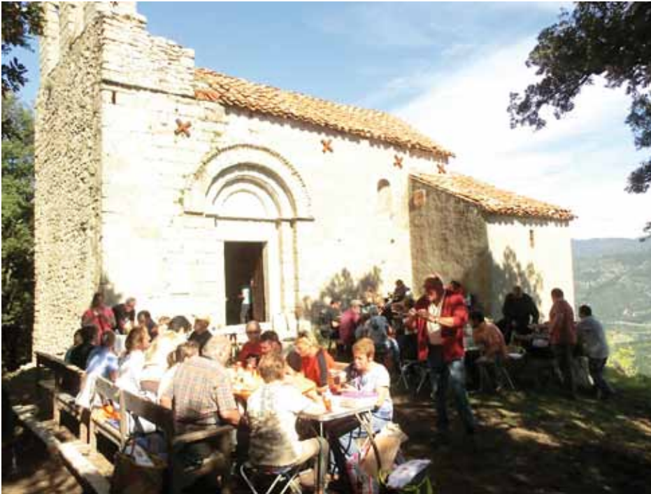
• L'Aplec de Sant Julià dels Torts, recuperat aquest any pel GAT de la Jonquera (GAT)

tejarem el camí de Mas Brugat a Rocaberti, Esquerda de la Bastida i Sant Pere del Pla de l'arca.