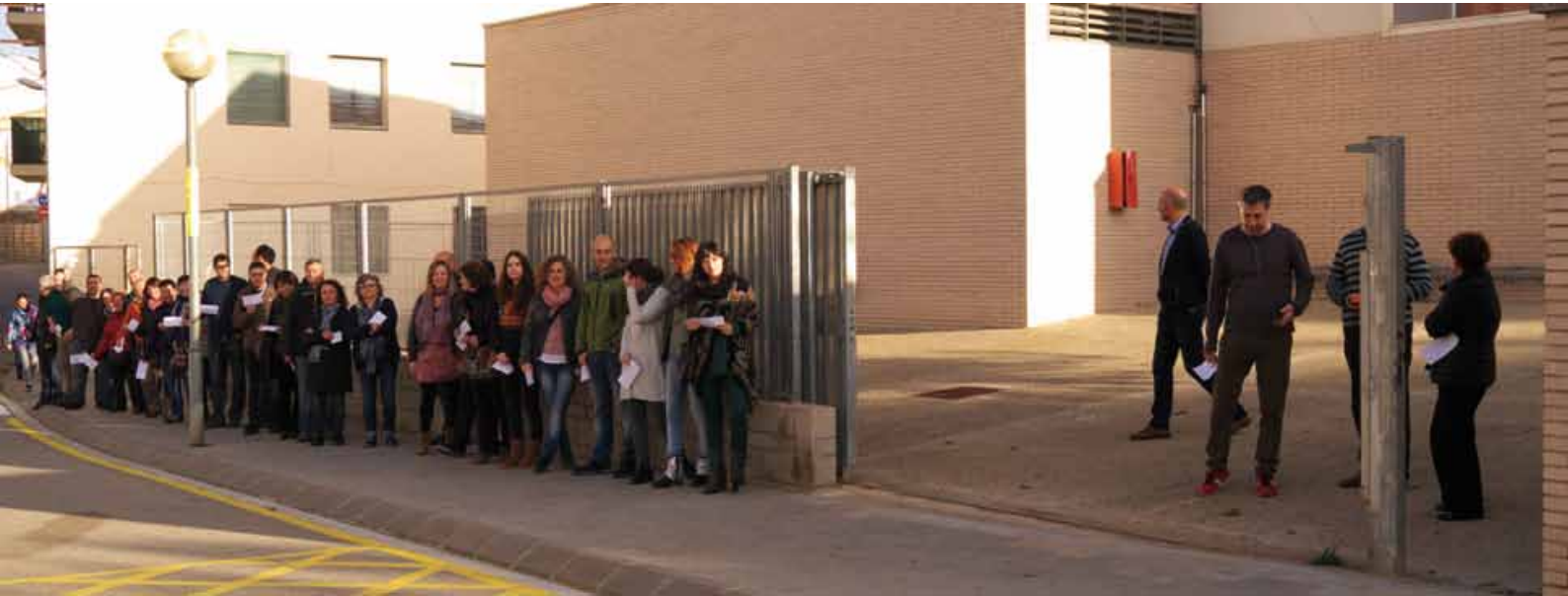
• Cues a primera hora a l'IES de la Jonquera