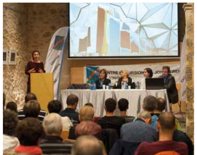
• La presentació es va fer al Porxos de Can Laporta la vesprada del 29 de novembre

La Cursa de la Dona se celebra el darrer diumenge de l'any en un recorregut urbà de 5 quilòmetres pels carrers de la vila. L'any passat hi van participar 335 inscrits que d'aquesta manera van col·laborar directament en l'ajuda econòmica als malalts de càncer de Girona. Des de l'organització es vol agrair la col·laboració econòmica dels esponsors, establiments comercials, Policia Local, Mossos d'Esquadra, Ajuntament i als col·laboradors directes del dia de la cursa.