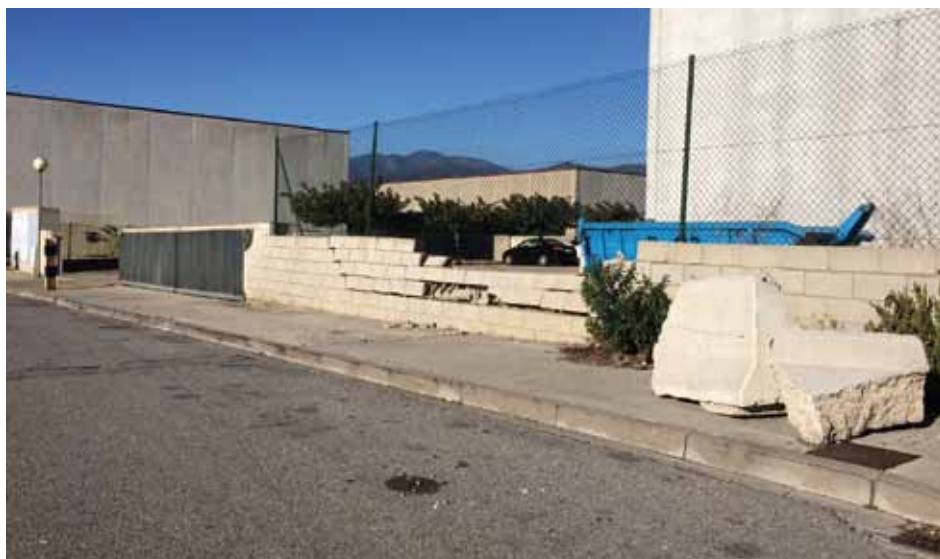
• Un mur del recinte de les naus de Mas Morató Fase I destrossat per les suposades maniobres d'un camió (Infojonquera.cat).

Precisament la revista L'Esquerda de la Bastida (edició 153) va publicar un editorial sobre aquest tema, el de les peces de formigó New Jersey, per fer palès el greuge que suposa el fet que algunes voreres disposin d'impediments físics per als estacionaments i en canvi d'altres no. La paradoxa però és que la denúncia pública que feia la revista era per proposar la retirada de totes les peces i restablir la situació prèvia als intents d'atemptat amb cotxe bomba que va patir el famós prostíbul.