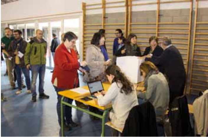
• Col·legi electoral de l'IES Jonquera