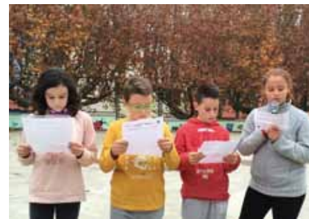
• Lectura del manifest del món de l'esport per l'eliminació de la violència vers les dones

van passar bé, implicant-s'hi, aportant idees i, sobretot, respectant en tot moment els diversos gèneres.