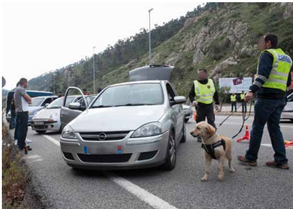
• Macrooperatiu transfronterer a la Jonquera i el Portús el divendres 21 de novembre (J. Ribas)

Tots els detinguts van passar a disposició del jutjat de guàrdia de Figueres, que en va decretar presó provisional.