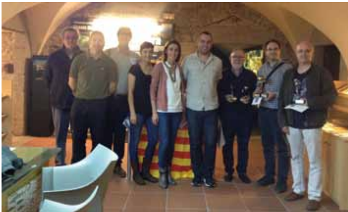
• A l'esquerra el Jurat i premiats del XV Concurs de fotografies de l'Albera. A la dreta Imatge premiada amb el primer premi

Properament, la mostra es trobarà exposada a l'Oficina del Paratge de l'Albera a Espolla, lloc on la podreu visitar.