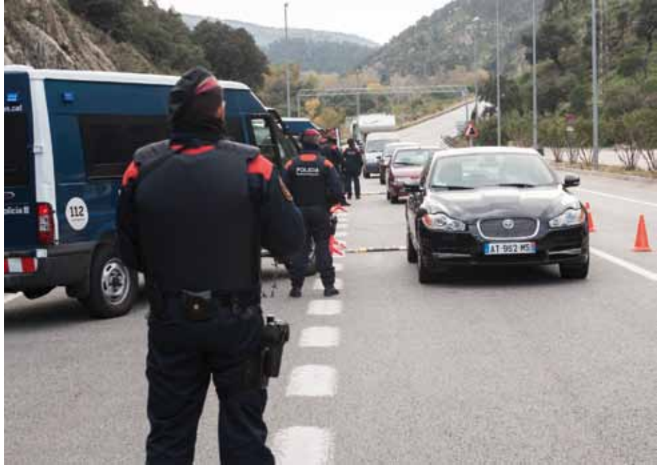
• Macrooperatiu transfronterer a la Jonquera i el Portús el divendres 21 de novembre (J. Ribas)

L'enllumenat d'aquest sector és insuficient a causa de les retallades per estalviar que va aplicar l'Ajuntament, que s'ha hagut de fer càrrec de l'enllumenat tot i tractar-se d'una via de titularitat estatal. Ara s'està negociant que sigui Foment qui posi més punts de llum en aquest tram, però el Ministeri, ara per ara, no hi accedeix.