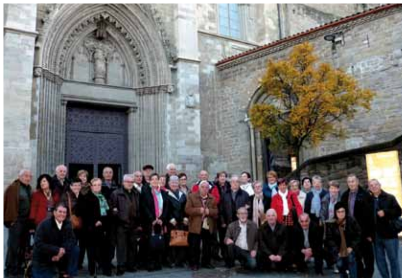
• El Casal de l'avi de visita a les mines de sal de Cardona

El dinar va ser a un bufet lliure de Santpedor i després de dinar els jonquerencs encara van tenir temps de passejar per Manresa.