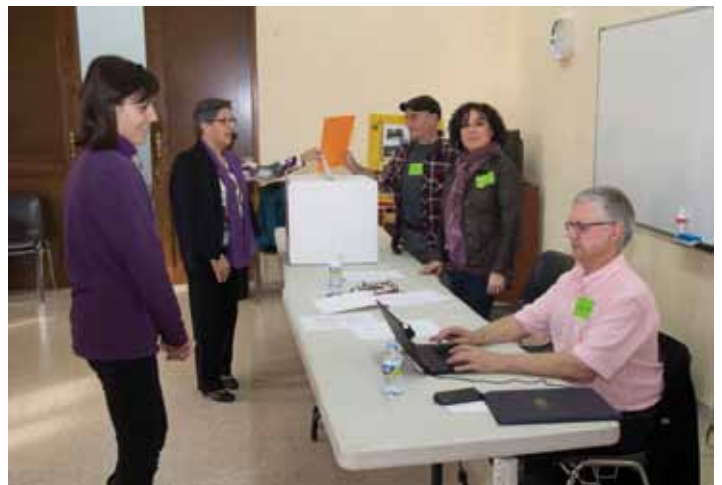
• Una imatge del 9-N a Cantallops