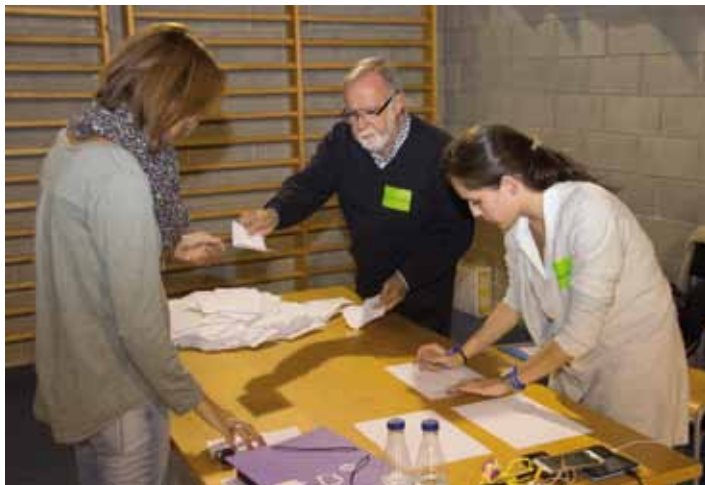
• Recompte de vots a partir de les 8 del vespre