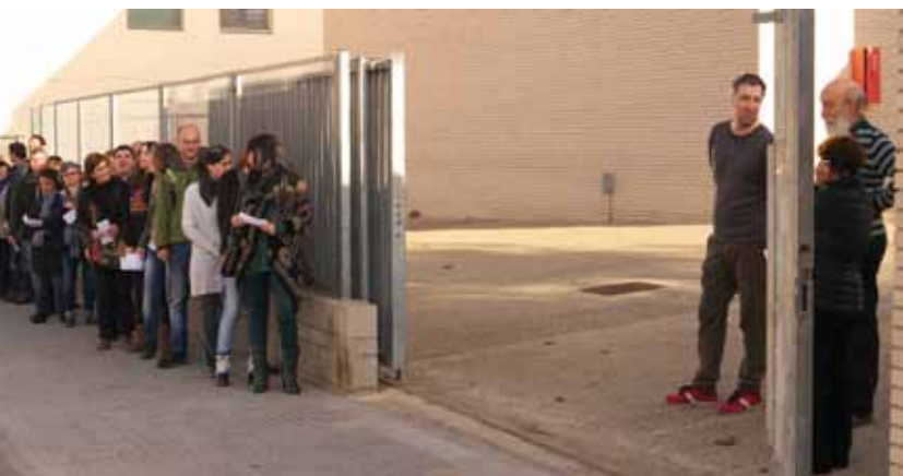
• Moments abans d'obertura del col·legi electoral del 9-N a la Jonquera