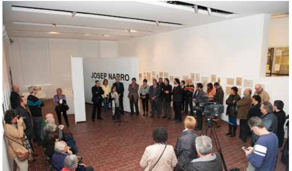
• Acte d'inauguració de l'exposició sobre "Josep Narro"

Mitjançant els seus dibuixos, Josep Narro no adopta l'opció de reproduir els alineaments sense fi dels barracons o de testimoniar els tractes injustos d'alguns dels vigilants del camp, sinó que, contràriament, fa ús d'un realisme sense concessions amb el propòsit de copsar i reflectir el millor possible la veritat humana que li comunica cada refugiat. Lluny de mostrar un retrat impressionista de les multituds, advoca per entrar en la intimitat dels barracons i concedeix a cadascun dels interns la seva singularitat, la seva inalienable part d'humanitat. Si, d'una banda, realitza de manera hieràtica els retrats de cada membre del personal de l'infermeria del camp, no oblidat, de l'altra, de palesar el