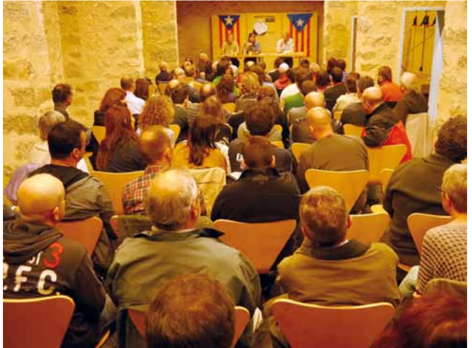
• Preparatiu del "procés participatiu" a Can Laporta

L'Ajuntament de la Jonquera feia constar, per mitjà d'un acte institucional de signatura per part dels regidors republicans i convergents, que la Jonquera s'adheria a la denúncia "internacional" contra la vulneració del dret a decidir del poble català. A la signatura hi van participar els regidors de CIU i ERC i es va realitzar en un acte de signatura in-