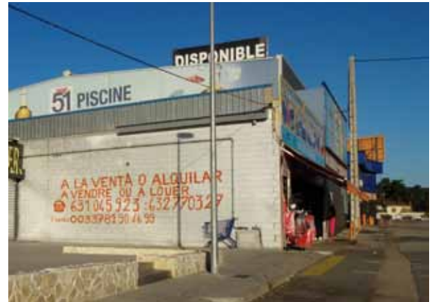
• Exemple de retolació low-cost a la Jonquera

La majoria d'aquesta retolació és situada a la zona de la carretera N-II ja que així els seus impulsors es garanteixen la visió per part de milers de conductors i acompanyants que circulen per la carretera. Des de Port Aventura fins a l'interès per llogar un local comercial, tots els rètols de gran format incompleixen una normativa municipal que prohibeix expressament l'ús de parets mitgeres amb finalitats publicitàries. Fa anys l'Ajuntament de la Jonquera va obligar a suprimir un mural publicitari al carrer Major de la Jonquera, davant el restaurant Marfil i al costat mateix de l'Estanc. En aquella ocasió el mural era per publicitar un local de ballarines i prostitució de la zona i l'incompliment de la normativa va obligar a retirar l'esmentat mural.