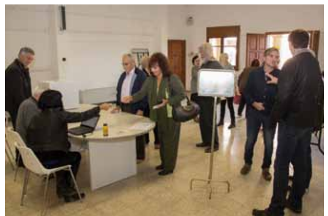
• Una imatge del 9-N a Agullana