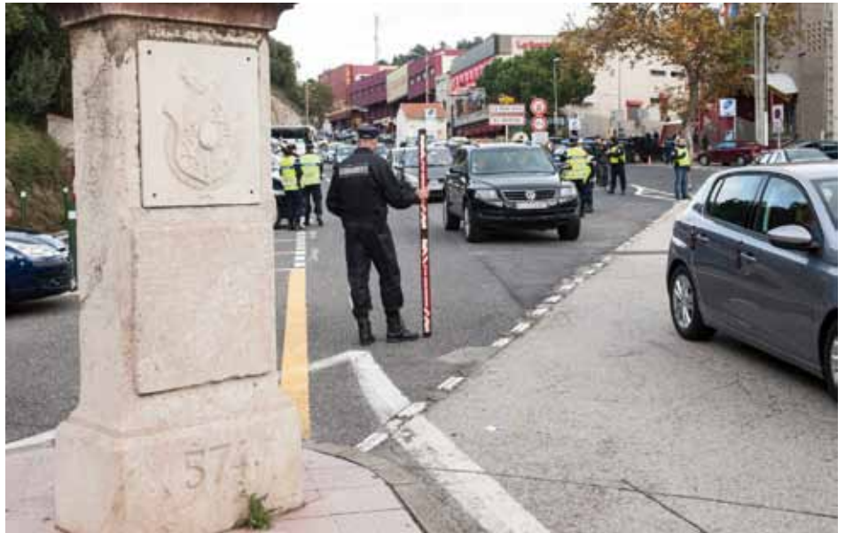
• Macrooperatiu transfronterer a la Jonquera i el Portús el divendres 21 de novembre (J. Ribas)

Al tram de carretera de Figueres al Pertús es podien trobar operatius de Policia Nacional abans d'arribar a la Jonquera, de Mossos entre aquest punt i el Pertús equipaments amb elements com la unitat canina i la gen-