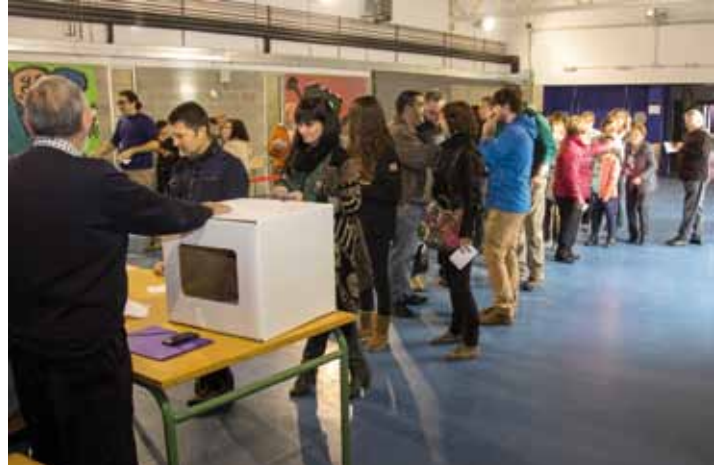
• A primera hora es van formar cues davant les urnes del 9-N