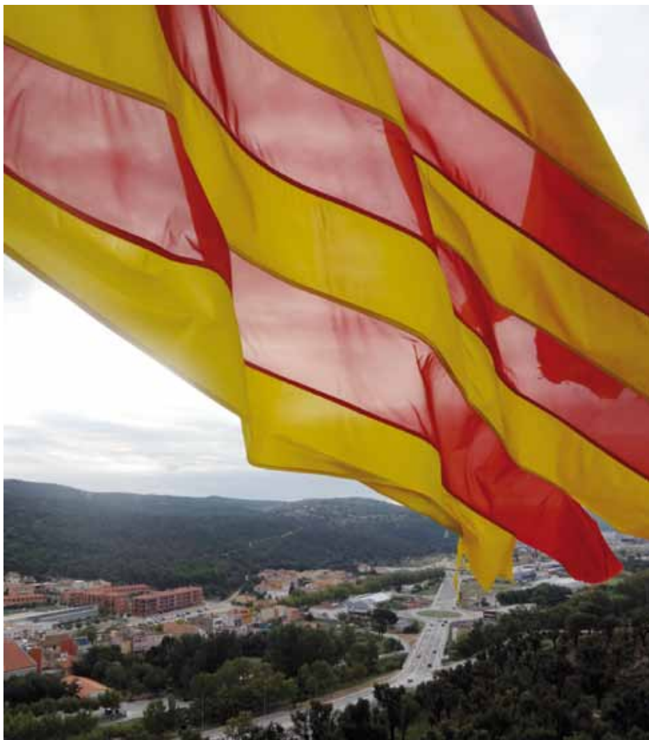
• Imatge parcial de la zona sud de la Jonquera des de la Torre del Serrat de la Plaça

Aquest comercial gironí lamenta que el Govern espanyol impugnés el “9N original” perquè “votar és un dret democràtic” . Creu que aquest 9N “finalment s'escoltarà el poble de Catalunya” perquè “ens han prohibit tantes coses que la gent vol votar sí o sí, sigui qui sigui qui ens representi, en Mas, en Junqueras o qui sigui” .