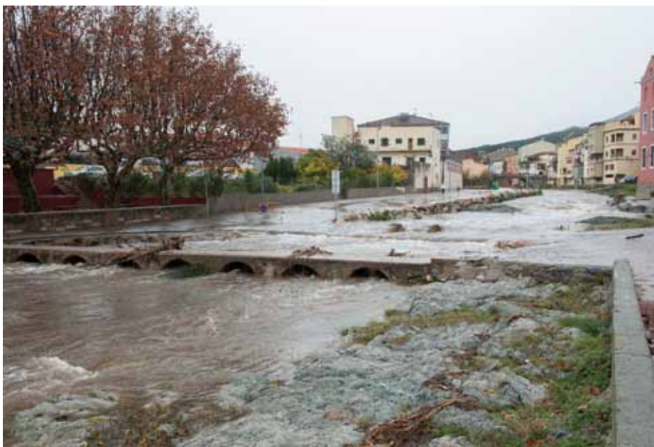
• El Llobregat a l'alçada de la Plaça dels Arbres el diumenge 30 de novembre

Així baixava el Llobregat el darrer dia del mes. Entre els dies 28, 29 i 30 es van recollir 121,4 dels 136 precipitats el novembre.