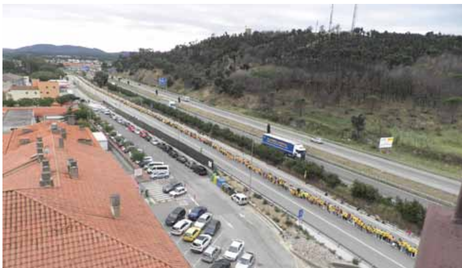
• Vista general de l'N-II al sector de La Caixa-Escoles-Cementiri

La cadena humana al nord de l'Alt Empordà va resultar un èxit, com va passar a tot Catalunya, i no es va haver de patir per com-