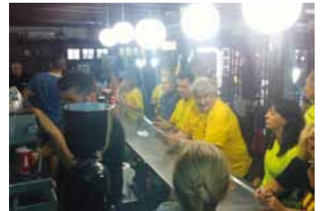
• Cafeteria del Gran Madam's l'11 de setembre