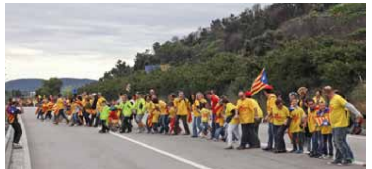
• Tram 713 (J.C.)