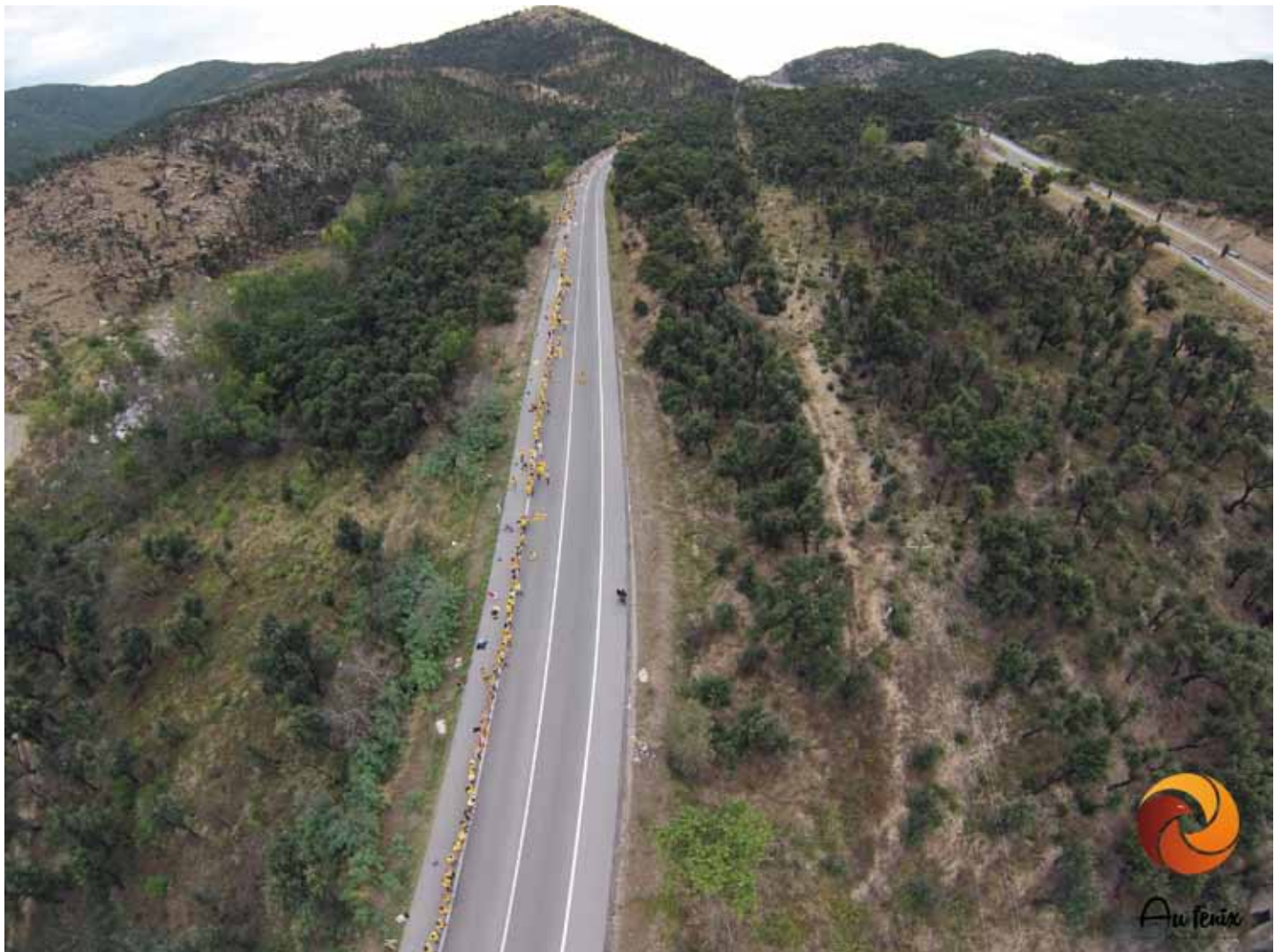
• Vista aèria del tram de via catalana (718 i 719) al Forn del Vidre

Coordinador dels trams 715-722 la Jonquera