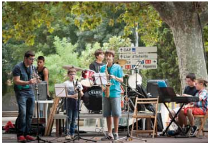
• Concert a la Plaça Nova amb alumnes i professors de l'escola de música de la Jonquera