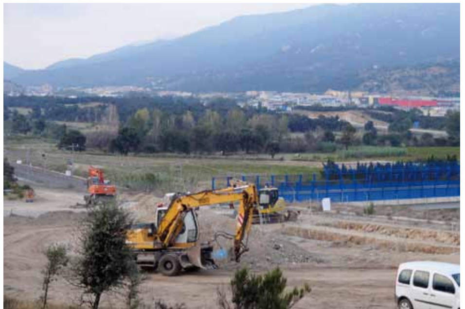
• Obres de la MAT soterrada en paral·lel a les vies del TGV. Al fons la Jonquera