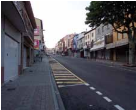
• Dues voreres, dos Estats, dos Ajuntaments i podria ser que fins i tot una hora menys en una vorera que en l'altra

Aquest nou horari els afectaria especialment ja que es podria donar el cas que a la vorera de Le Perthus fossin les 8 del matí mentre que a la vorera del Portús jonquerenc fos una hora menys, o sigui, les 7 del matí. Les peculiaritats de les voreres del Portús, que pertanyen a dos Estats, sempre han estat motiu de curiositat pels visitants del nucli comercial, sobretot per les diferències que implica la divisió entre dues administracions. Així, mentre una vorera "rebossa" d'activitat econòmica i no hi ha cap local buit, l'altra pateix per omplir els locals amb algun tipus de comerç. En un futur potser caldrà afegir-hi la diferència horària.