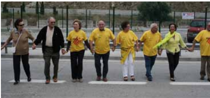
• Tram 713 (J.C.)