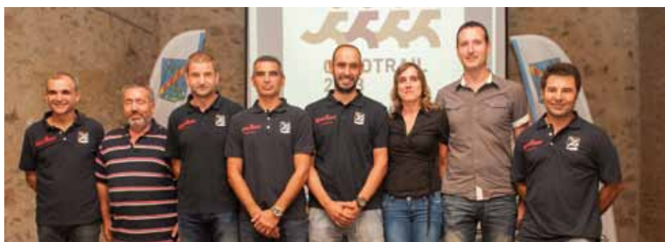
• Els membres del CEJ que participaran a la cursa benèfica Oncotrail

nyaran durant el trajecte amb un vehicle de suport . La cursa es celebrarà els dies 12 i 13 d'octubre amb un temps màxim de 36 hores per dur a terme el recorregut .