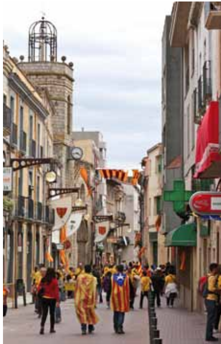
• Aspecte que ofería el carrer Major l'11 de setembre al matí (Sergi Pagés)

Els assistents van presentar-se equipats amb les pertinents camisetes grogues, estelades amb pal o sense, motxilla amb aigua, entrepans, gorres, jaquetes i ganacs de passar-ho bé. ■