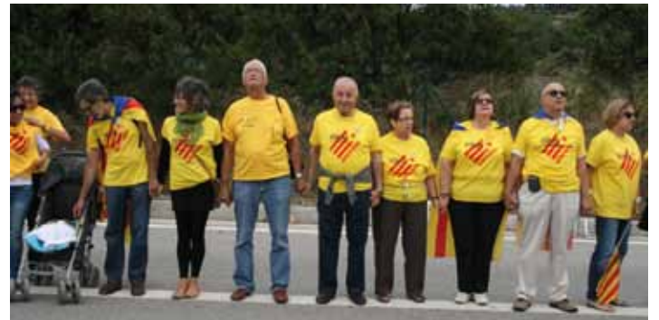
• Tram 713 (J.C.)