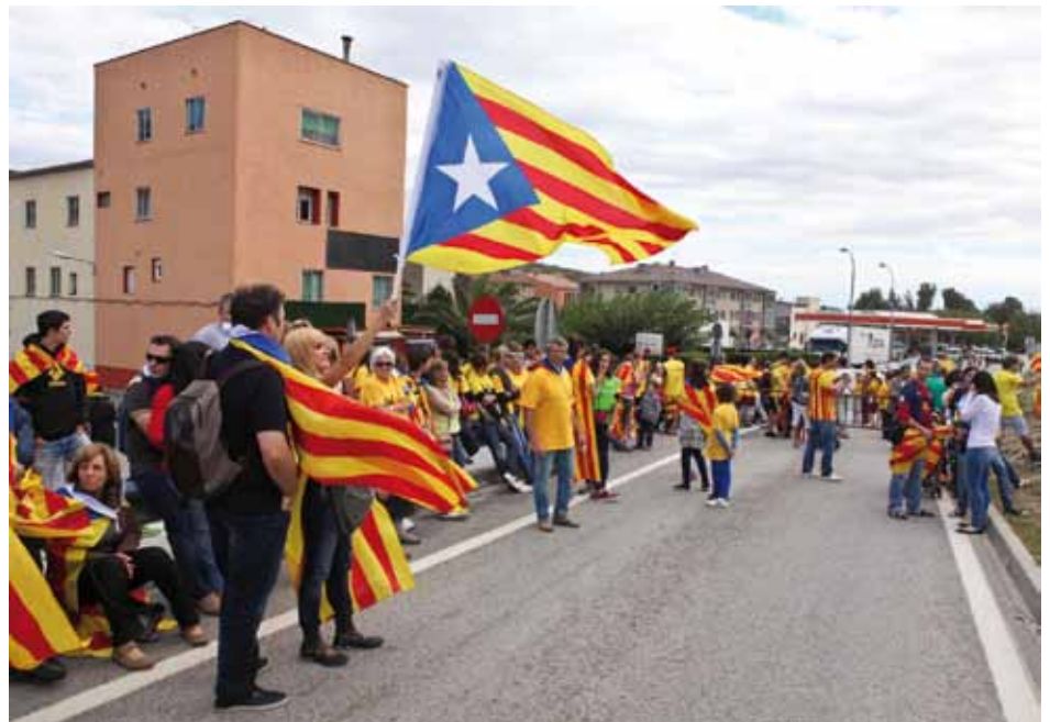
• Els assistents a la cadena humana esperaven l'hora de formació de la cadena prudentment apartats de l'N-II