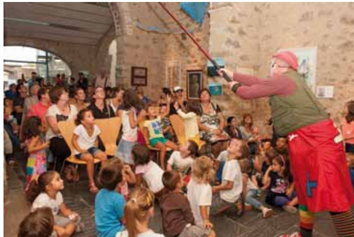
• La meteorologia no va acompanyar i alguns actes, com l'espectacle infantil, es van celebrar a cobert