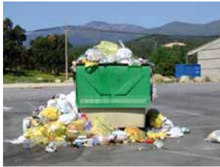
• Contenedor ple de deixalles en una imatge d'arxiu

alimentaris, la rebaixa serà del 5%. Igualment, es manté la bonificació addicional del 16% per als locals ubicats al casc antic.