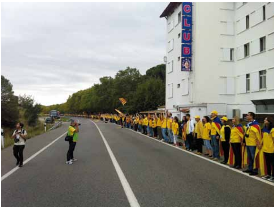
• Tram 700, Ivan Sanz