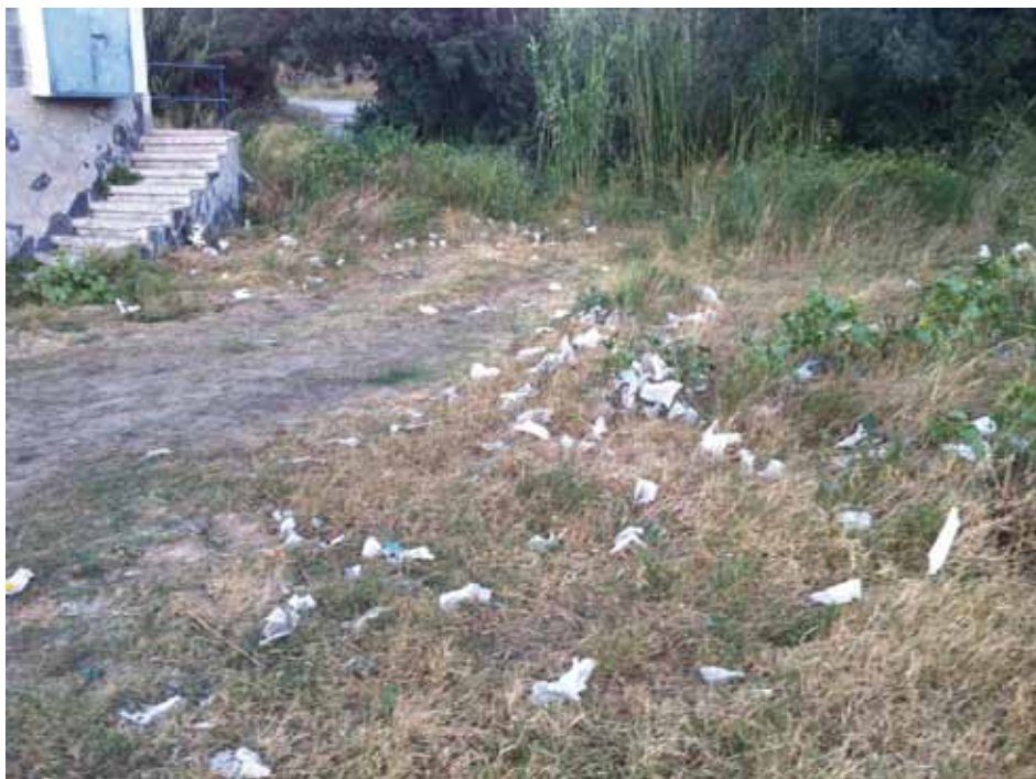
• Centenars de preservatius i tovallolletes a l'antiga captació d'aigües de la Jonquera a principis de setembre

Si durant l'hivern passat la presència de noies al carrer s'havia reduït notablement, conseqüència de la pressió policial, en els darrers mesos la presència policial s'ha reduït i això ha tornat a fer créixer la prostitució. Així, fins a 4 o 5 noies han estat dia sí dia també a la rotonda del polígon Mas Morató, i entre 3 i 4 noies més a la rotonda de Can Quartos les darreres setmanes de l'estiu. A més, cal afegir-hi la presència més discreta de noies als aparcaments dels polígons i al llarg de l'avinguda Sis d'Octubre que no només no s'han reduït sinó que també ha anat creixent la seva presència i freqüència. Els problemes que genera la prostitució s'han tornat a posar sobre la taula després d'uns mesos amb poques informacions sobre el fenomen.