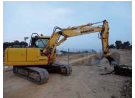
• Les màquines treballen en una zona paral·lela al traçat del TGV obrint rases per soterrar la MAT

del 2013 els operaris ja hi hagin col·locat els 240 quilòmetres de cable que hi recorreran per l'interior.