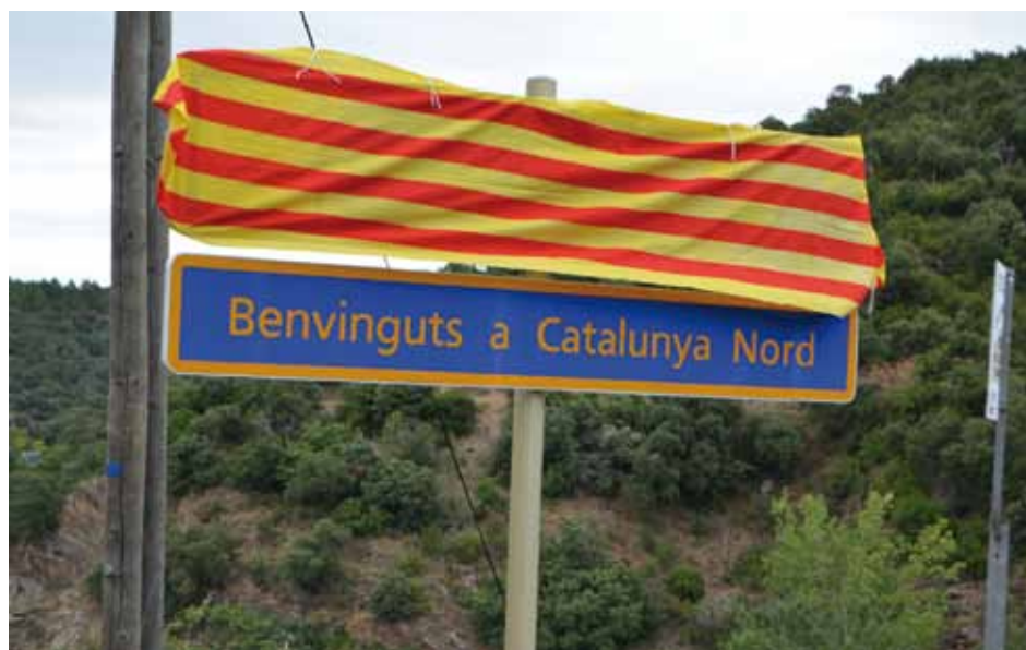
• Cartell de "benvinguda a la Catalunya del Nord, al Portús