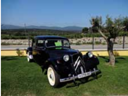
• Clàssics Agullana ofereix un servei de compra-venda i reparació i restauració de vehicles antics (Infojonquera.cat)

Divendres 27 de setembre es van inaugurar oficialment les instal·lacions de "Clàssics Agullana", un centre de compra-venda, reparació i exposició de vehicles antics situat