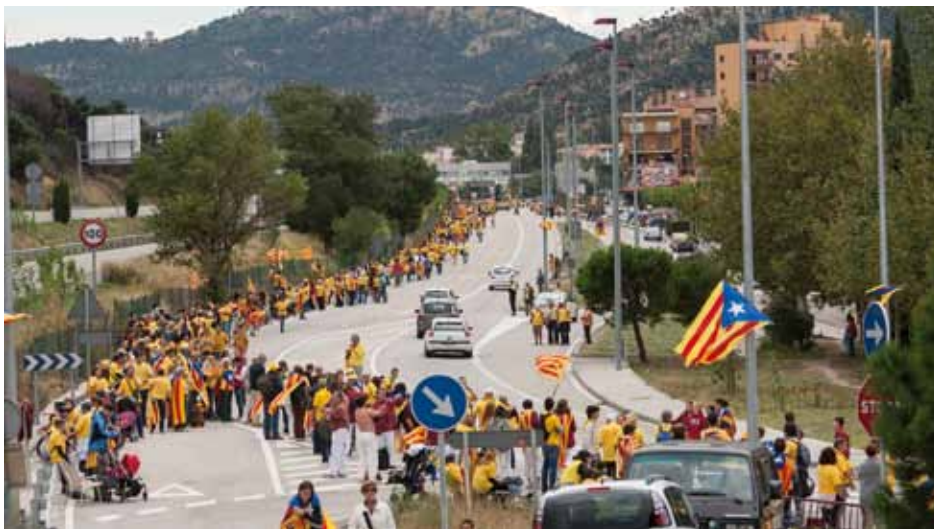
• Vista general de l'N-II des del pont del cementiri en direcció nord