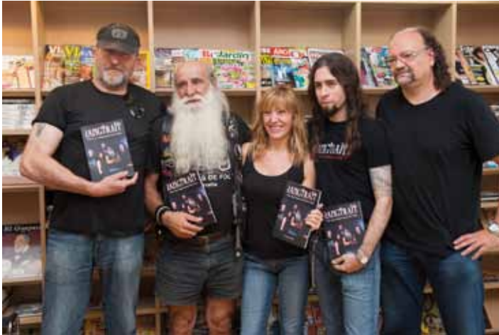
• Presentació del llibre "Sangraït, vint anys empenyant els veïns" a la biblioteca

Oficina 0191 Av. Miquel Mateu i Plà, 6 17700 LA JONQUERA Tel.: 972 55 70 00 - Fax: 972 55 59 19