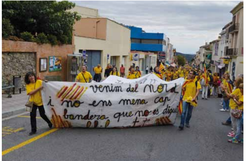
• La cadena humana al Portús es va estirar fins a l'edifici de la duana, passat el pont en direcció a El Voló