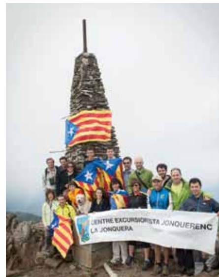
• L'estelada ja oneja al Puig Neulós des del diumenge 8 de setembre

Com a curiositat val a dir que no serà la primera vegada que el CEJ porta l'estelada a un cim, però la paradoxa és que durant més de trenta anys d'activitat alpina, l'entitat de la Jonquera havia portat una estelada a cims dels Andes, Atlas o els Alps però en canvi sembla ser, o no consta, que ho hagués fet mai al Puigneulós. Avui el CEJ ha posat fi a aquesta paradoxa.