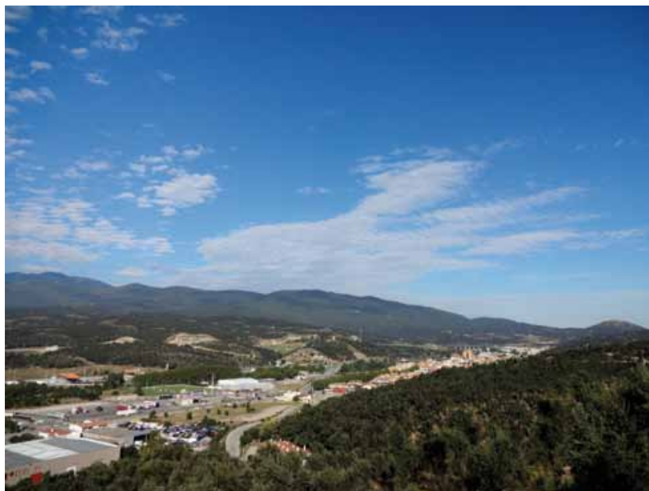
• Zona sud del casc urbà de la Jonquera des de l'altiplà de Canadal a finals de setembre (Infojonquera.cat)

"Del setembre a la tardor, torna la calor" diu una de les dites populars sobre aquest mes. Hem triat aquesta perquè realment ha estat un mes càlid. Com a foto del mes, un cel blau amb alguns núvols de poca consistència, símptoma de calma, com tot el mes. ■