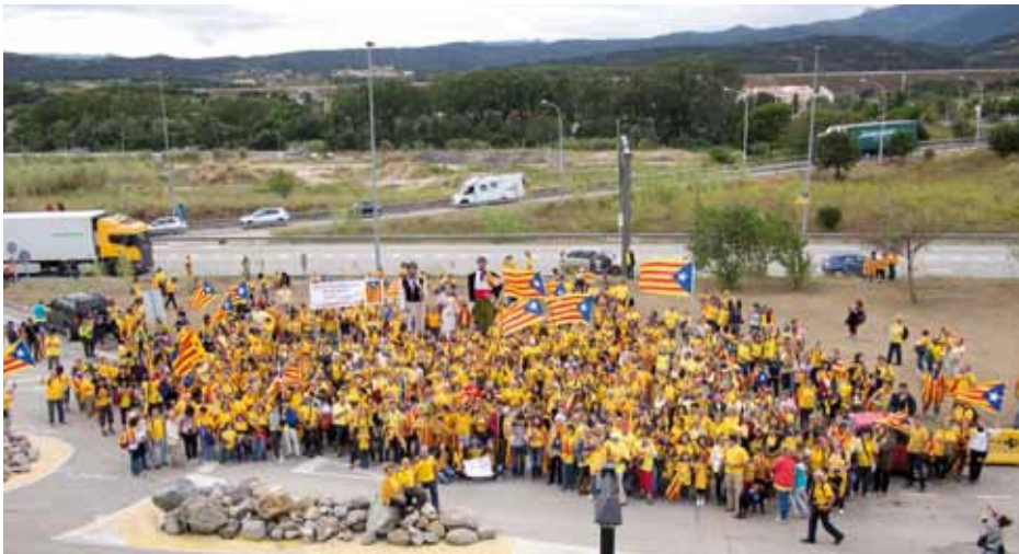
• Tram 710, Lluís Torra