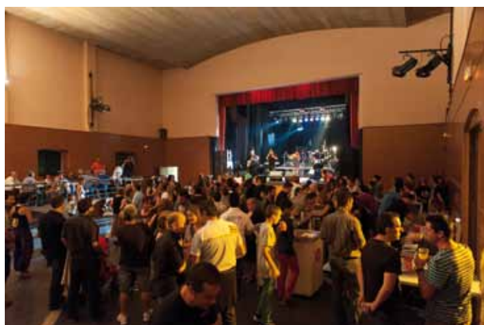
• Ball de nit, també sota cobert, amb l'orquestra Moonlight