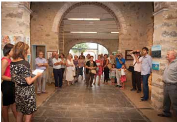
• Inauguració exposicions, tret de sortida dels actes de la Festa Major 2013