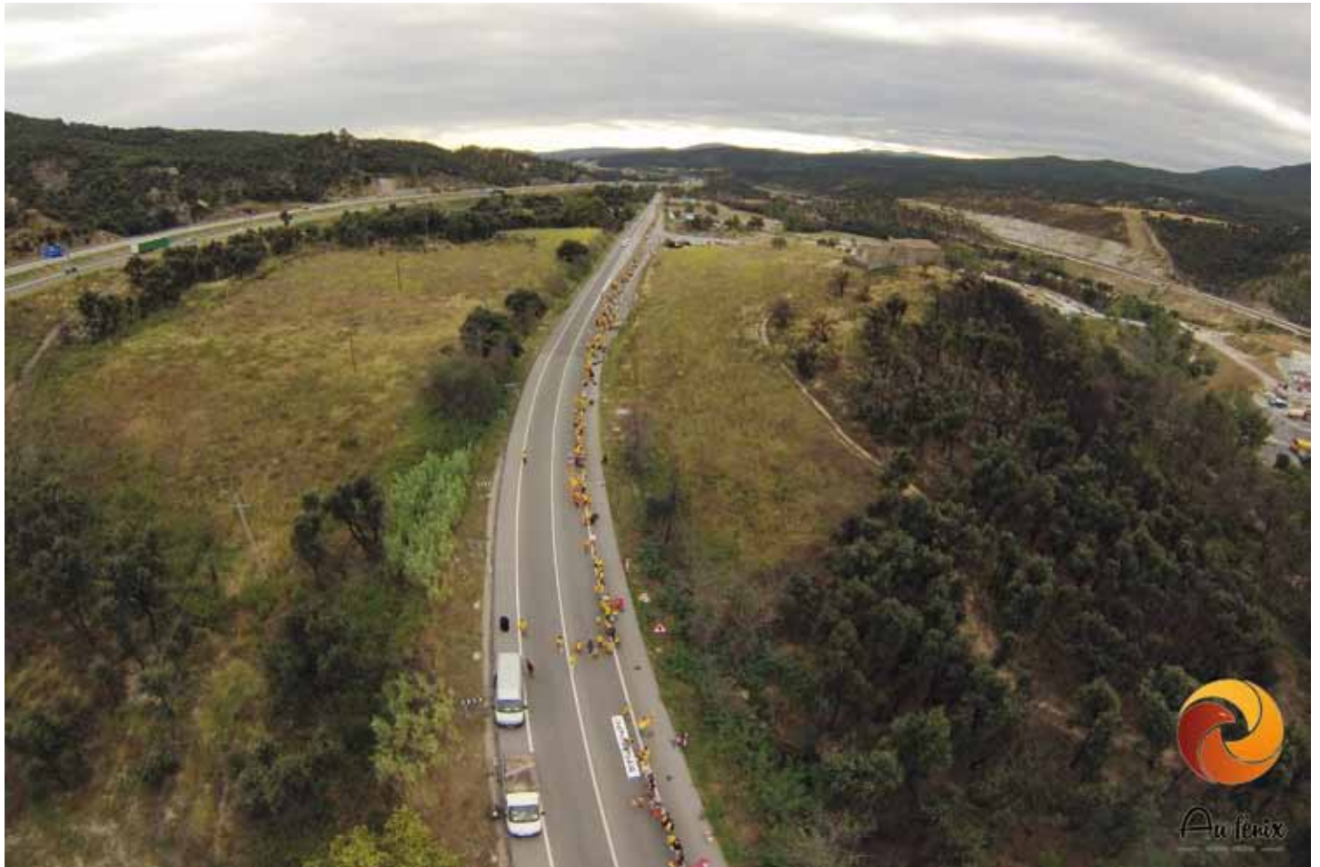
• Vista aèria del tram de via catalana (718 i 719) al Forn del Vidre, a prop del Portús, on volia anar Gustavo Puigdemolas

ANC Assemblea Territorial la Jonquera Setembre de 2013