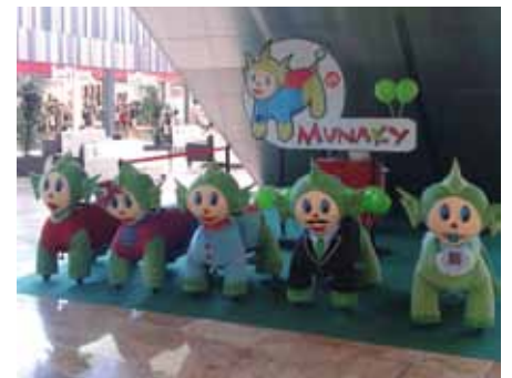
La parada dels Munakys, sota les escales mecàniques d'accés a la planta superior

Des del 31 d'agost, la franquícia Munaky s'ha instal·lat al Centre Comercial Gran Jonquera com a nova oferta d'oci infantil i familiar. Els Munakys són uns peluixos robots que permeten als nens fer una volta d'uns 4 minuts a cavall d'un dels 5 integrants de la família: el pare i mare Munakys, el fill, la filla i el bebè.