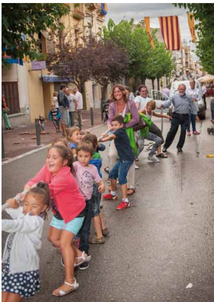
• Estirada de corda, joc tradicional català, per la tarda del diumenge. Molt renyida, malgrat la pluja.