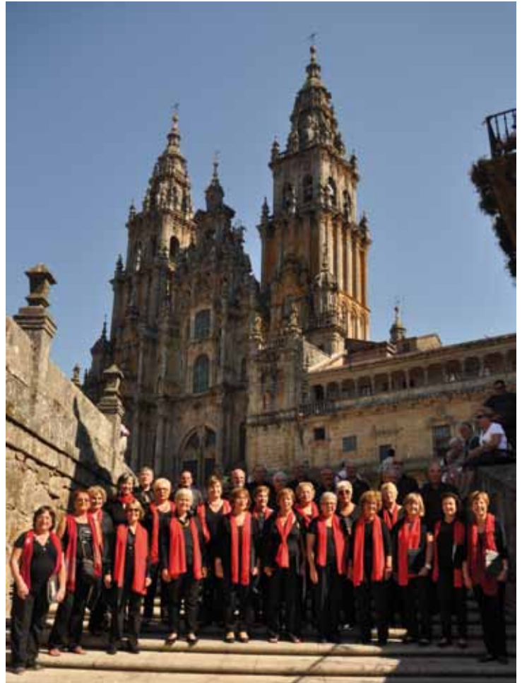
• La formació coral davant la catedral de Santiago on va cantar El Cant del Poble i Els Segadors (Orfeó Jonquerenc)

Abans de marxar, la foto de rigor a les escales de la Plaça del Obradoiro i l'homenatge a la Pàtria Catalana amb El Cant del Poble i Els Segadors.