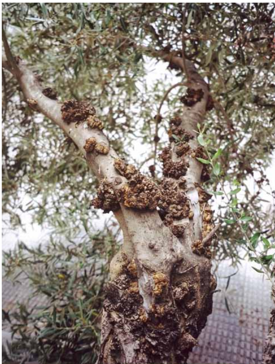
• Olivera afectada de tuberculosi

Gregorio Serrano gorioserrano@gmail.com Cantallops - Setembre de 2013