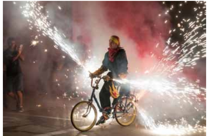
• El correfoc va ser, com sempre, una de les activitats festives més esperades