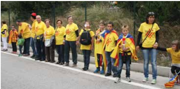
• Tram 713 (J.C.)