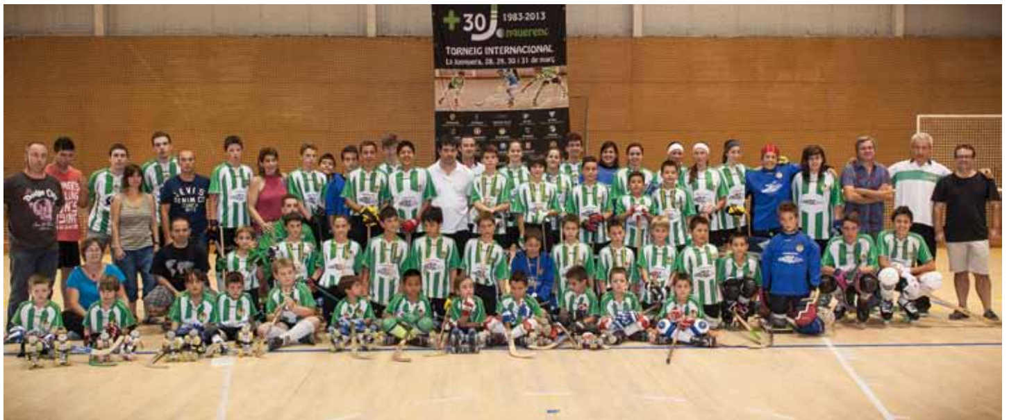
• Presentació dels equips del Club Patí Jonquerenc al pavelló poliesportiu municipal