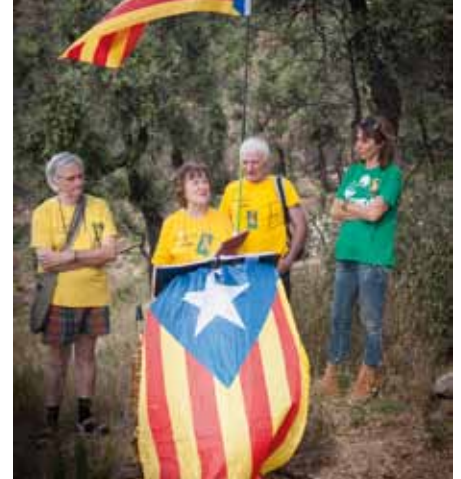
• Una imatge de la 28a trobada a Panissars, celebrada el diumenge 29 de setembre

El passat 29 de setembre es va commemorar el 728 aniversari de la Victòria Catalana (1285) a la batalla del Coll de Panissars, esdevinguda entre els dies 30 de setembre i 1 d'octubre, que va donar per finalitzada la croada contra la Corona d'Aragó, amb el resultat d'una severa derrota de l'exèrcit francès de Felip III, batut en la retirada pels catalans. Els actes, organitzats per l'IPECC amb la col·laboració de l'Ajuntament de la Jonquera, s'iniciaren amb la trobada i ofrena floral davant el monument del Coll de Panissars; tot seguit recepció d'autoritats, resum històric dels fets, parlaments, la Via Catalana al Coll de Panissars i Cant dels Segadors, acompanyat pel saxofonista Sergi Labarta, professor de l'Escola de Música de la Jonquera.