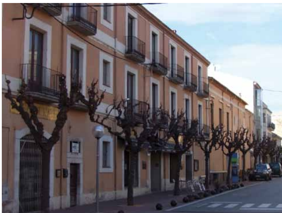
• La Societat de socors mutus La Unió Jonquerenca, una entitat benèfica amb molt de pes encara avui en el dia a dia de la Jonquera