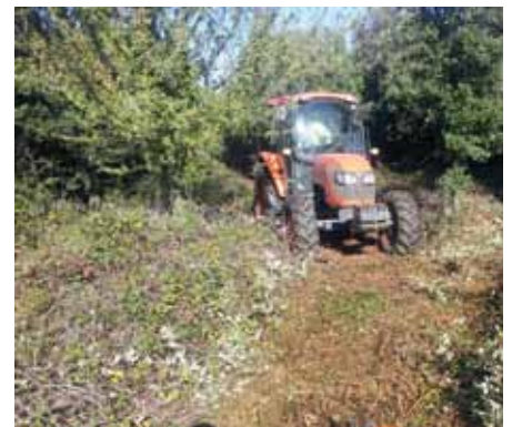
* A l'esquerra desbrossant a la font de la Figuerassa. A la dreta desbrossant la carena del Pla de l'Arca