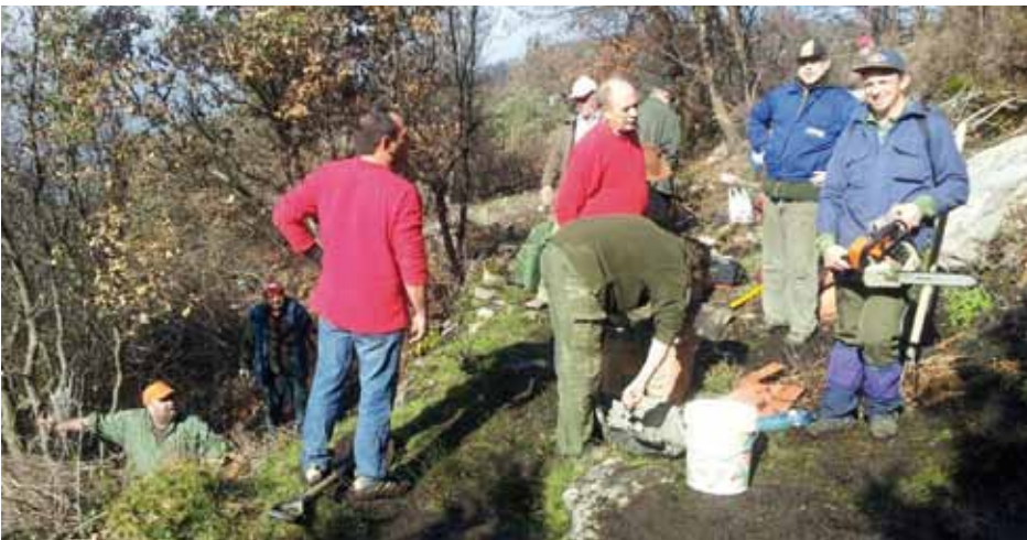
• Feines de desbrossament i arranjament a la Font dels Fangassos