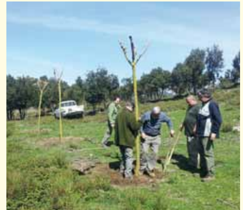
• Plantant moreres al Mas Nou i Sant Pere del Pla de l'arca

espècies animals. Els caçadors cacen, sí, però són també uns grans coneixedors de l'orografia i el bosc, i saben quins camins convé arreglar perquè no s'acabin perdent pel poc ús davant una vegetació que va creixent imparable, saben quines fonts convé restaurar perquè no s'acabin de perdre definitivament o, també, a quins espais convindria plantar arbres o desbrossar antics camps de cultiu. Des d'habilitar un refugi al Prat de l'Illa fins a repoblar amb animals autòctons el bosc.