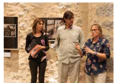
• Inauguració de l'exposició de fotoperiodisme el 18 d'octubre a Can Laporta