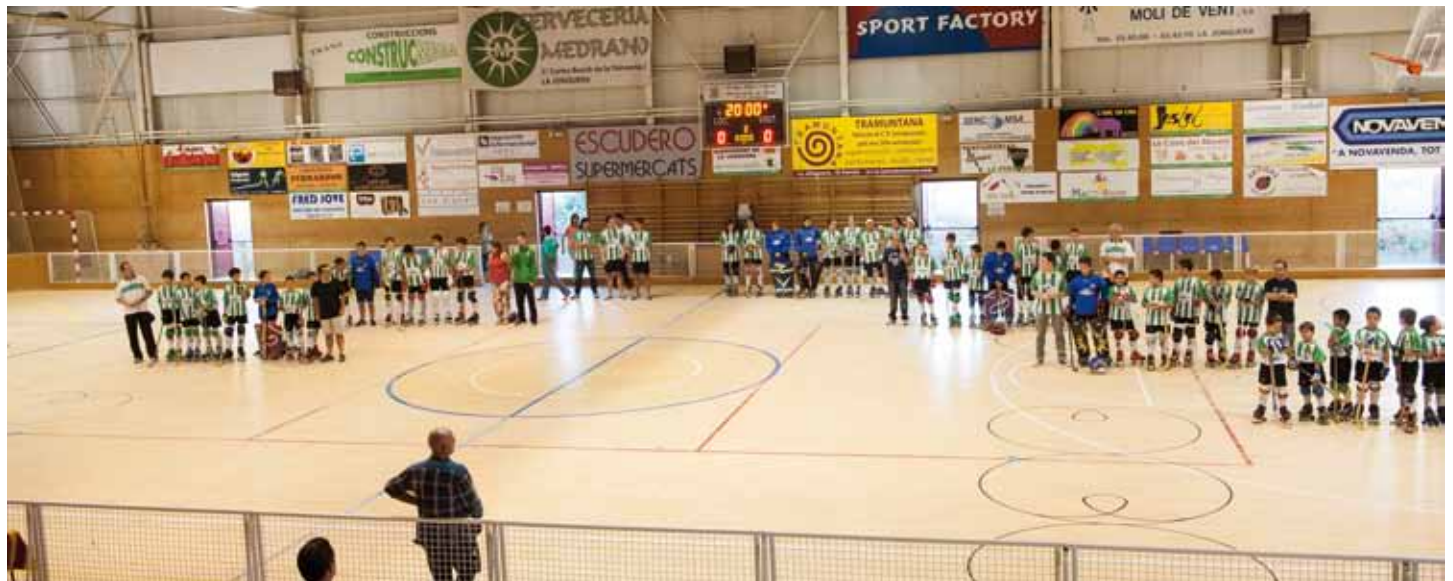
Presentació de tots els equips en pista