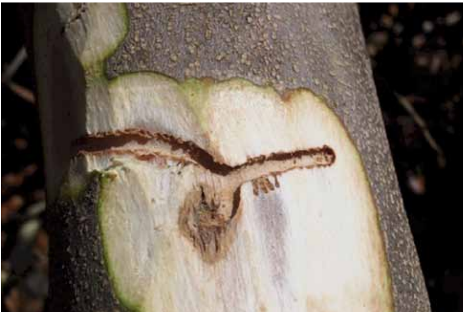
• Sota l'escorça exterior d'una olivera afectada pel corc podem observar els petits túnels que excava l'escarbat