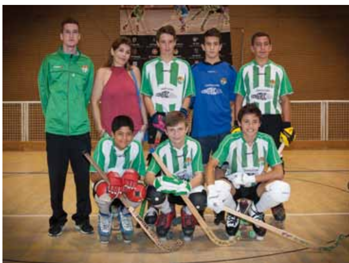
Infantils del CP Jonquerenc, temporada 2013-14