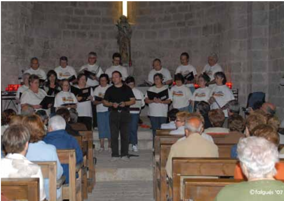
• L'Orfeo Jonquerenc, una de les entitats culturals més actives de la Jonquera. Imatge d'arxiu