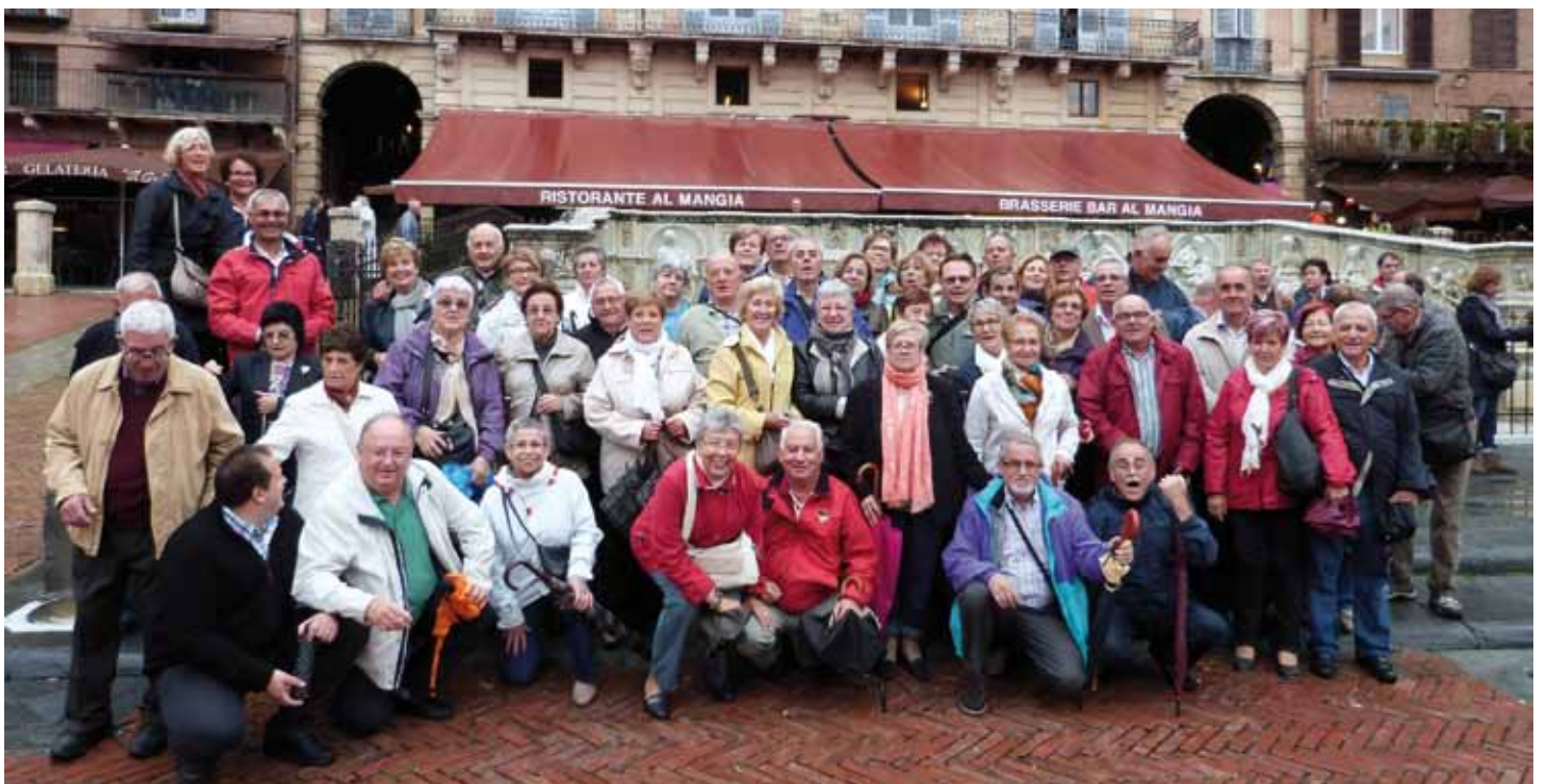
• Una de les fotografies de grup del viatge dels jonquerencs a La Toscana (Particular)