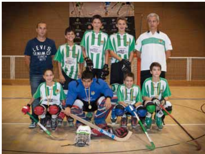
Alevins del CP Jonquerenc, temporada 2013-14