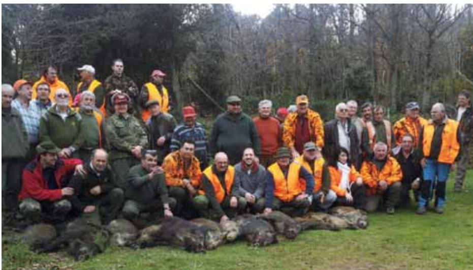
• Les colles de la Jonquera i Sant Martí d'Albera després d'una bona cacera al Pla de l'arca

Els animals es desplacen, depenen del factor alimentari que cada any varia i que ve condicionat per les pluges. S'ha d'anar controlant el moviment dels animals dies abans d'anar a caçar, buscar els rastres, les petjades, tenir en compte els canvis de