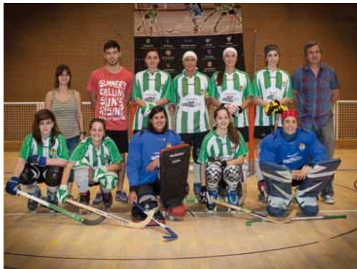
Equip femení del CP Jonquerenc, temporada 2013-14