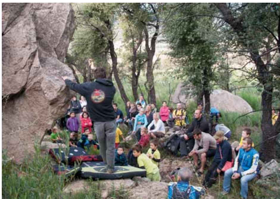
Exhibició i pràctiques en escalada al Roc de Miradones el diumenge 6 d'octubre

Així doncs, la recentment activada secció d'escalada del CEJ ha començat la temporada amb bon peu; i és que la sortida al Roc de Miradones va comptar amb més de 40 excursionistes de totes les edats, entre petits i grans.