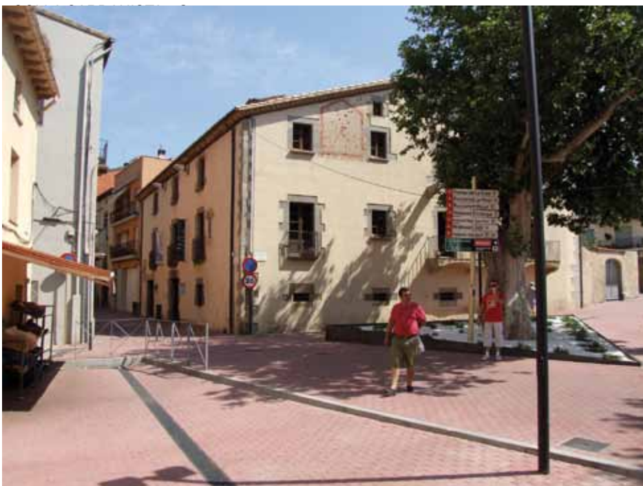
• Can Laporta i les seves funcions d'hotel d'entitats ha ajudat a conservar el teixit associatiu de la vila

• ONCOLLIGA. Secció local de l'entitat d'ajuda a les persones amb càncer i fami-