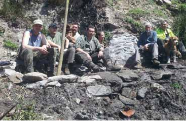
• Condicionament de la Font de la Figuerassa de dalt