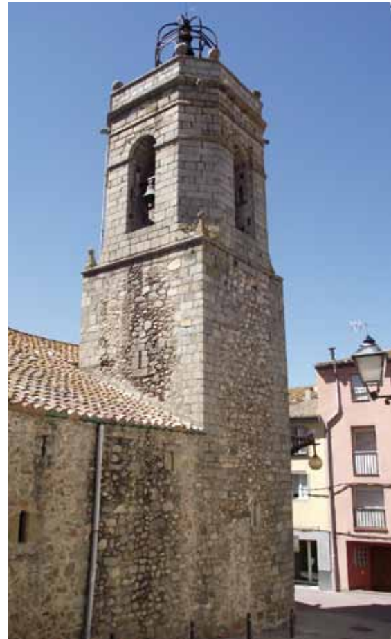
• Els Amics de Santa Maria de la Jonquera ha estat una de les associacions de nova creació amb l'objectiu de restaurar l'església parroquial