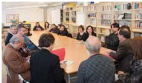
• Taula de treball amb representants locals d'ensenyament i l'Ajuntament i alumnes el passat mes d'abril

famílies, l'equip directiu del centre, la resta de l'alumnat i referents femenins externs del mateix origen que han assolit estudis superiors universitari, així mateix el jurat també ha tingut en compte la innovació de la proposta, la claredat i l'estructuració del procés.