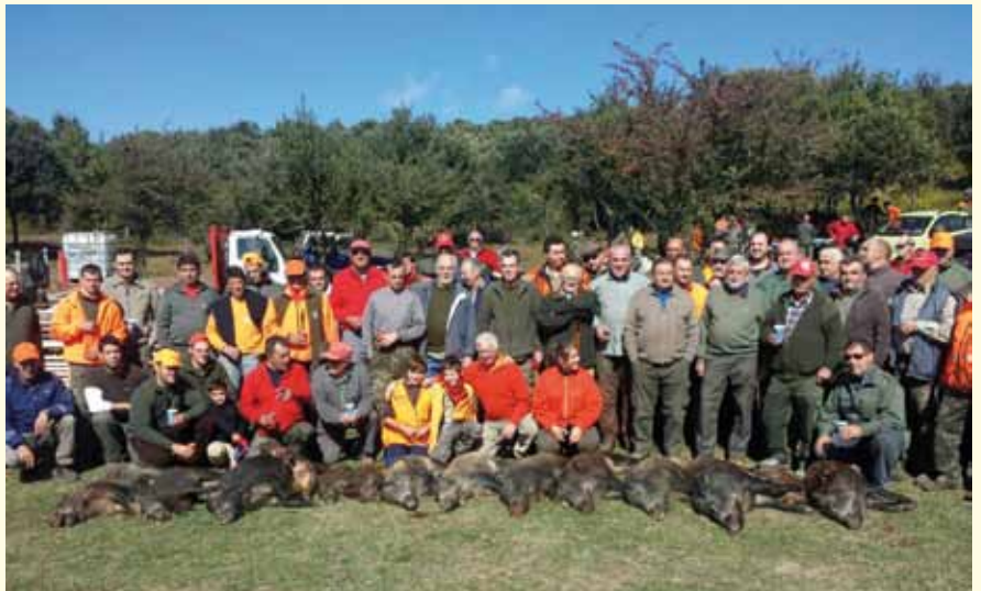
• La colla de caçadors de la Jonquera, Cantallops i Sant Martí d'Albera després d'una batuda al senglar

Temporada 2013-2014 (Iniciada el 01/09/13) Temporada encara en curs: 28 senglars i 1 cabirol (fins al 31/10/13)