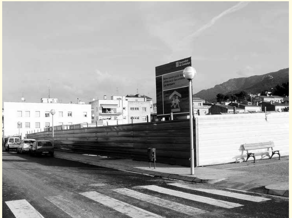
Inici de les obres del nou IES, el setembre de 2003

La conselleria d'Ensenyament iniciava el 5 de setembre de 2003 les obres de construcció del nou institut d'educació secundària. El solar de propietat municipal i 8.000 m 2 va ser cedit a la Generalitat de Catalunya. Les obres s'havien d'acabar el 2005.