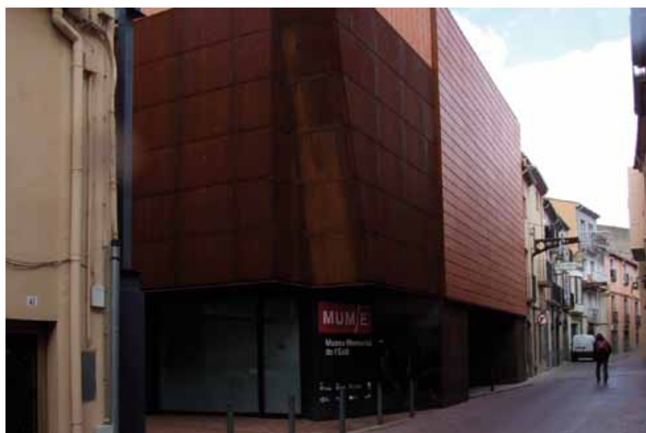
• El MUME, una dels patrimonis institucionals que ha reactivat les exposicions a la Jonquera, entre moltes altres tasques pedagògiques