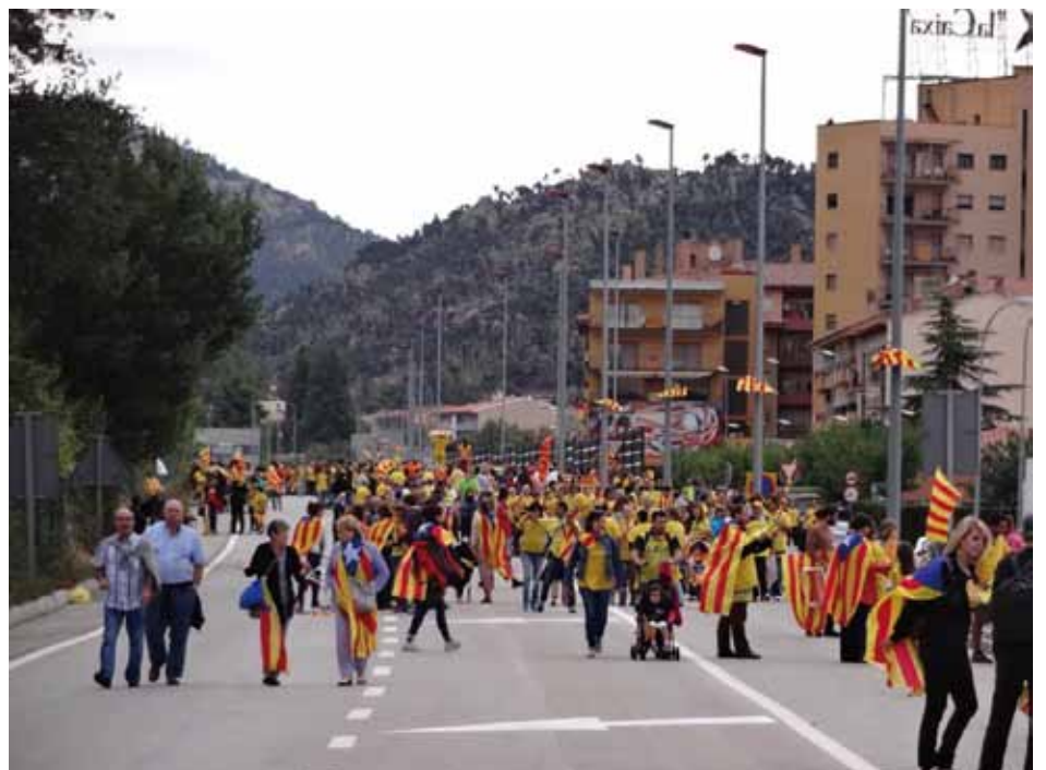
• Preparant la cadena humana de la Via Catalana a la Jonquera