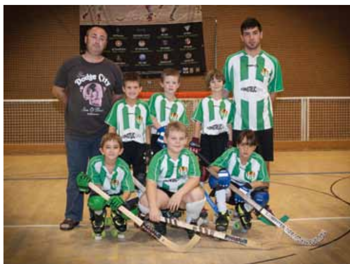
Equip de preBenjamins del CP Jonquerenc, temporada 2013-14