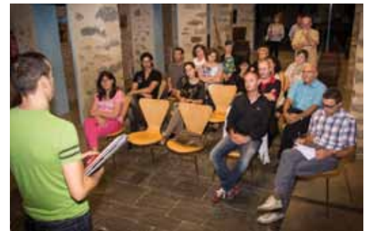
• Reunió de la Comissió de Comerç a Can Laporta el dijous 26 de setembre