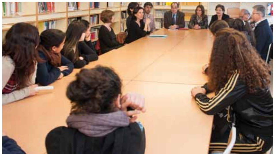
• Taula de treball amb representants locals d'ensenyament i l'Ajuntament i alumnes el passat mes d'abril

Director INS Jonquera 31 d'octubre de 2013