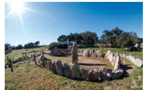
• L'itinerari dels Estanys abans del foc

La Diputació de Girona ha recuperat la ruta megalítica dels estanys de la Jonquera, afectada pel foc de l'estiu passat, gràcies a una donació solidària de l'Ajuntament de la Torre de l'Espanyol. Aquest municipi de menys de 700 habitants reserva anualment 1.000 euros per a projectes solidaris i els dona a dues iniciatives a parts iguals. Aquest any han escollit contribuir en la recuperació de les zones afectades pel foc de l'estiu passat.