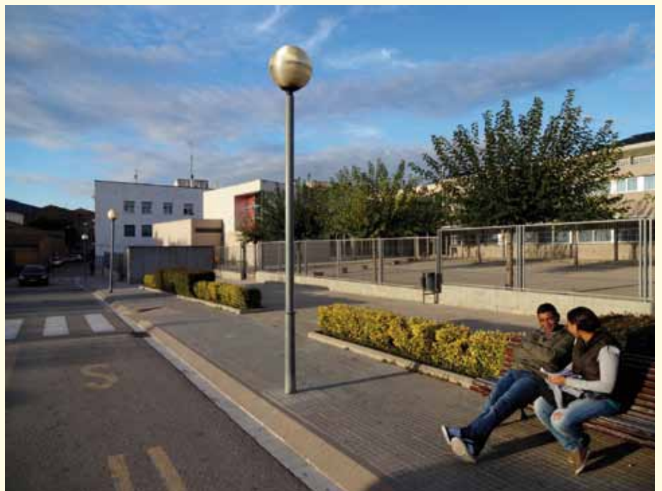
Vista de l'IES Jonquera deu anys després des del mateix punt des d'on es va fer la fotografia l'any 2003