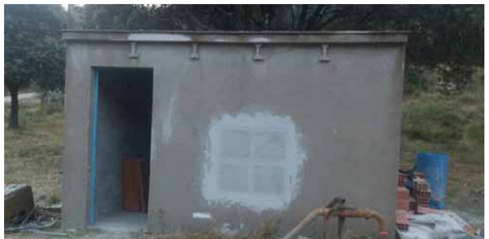
• L'antiga caseta de la captació d'aigües d'el Portús, al Prat de l'Illa, està sent restaurada i habilitada com a refugi de muntanya

També, un altre treball realitzat conjuntament