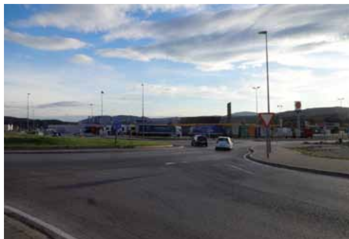
Esquerra: Inici de les obres del polígon Les Oliveres, el setembre de 2003. Cruïlla carretera de Cantallops amb el Mas del Pla i Les Oliveres. Dreta: vista de la mateixa cruïlla deu anys més tard