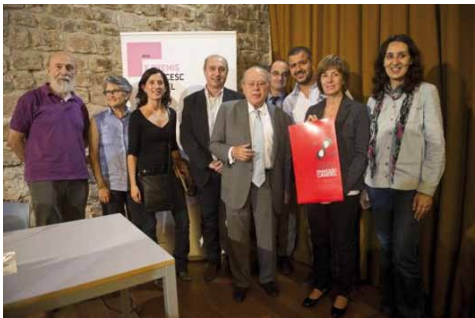
• Recepció i atorgament del Premi Francesc Candel per al projecte de la Jonquera

Ens vam posar en contacte amb els tècnics del Pla Territorial de Ciutadania i immigració (PTCI) del Consell Comarcal de l'Alt Empordà per buscar una manera d'explicar als pares i a les mares de les alumnes la importància de la importància del fet que les seves filles vinguessin a les excursions del centre.