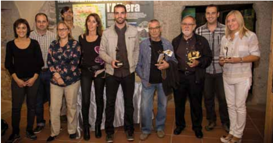
• Acte de lliurament dels premis del XIV Concurs de Fotografia de l'Albera