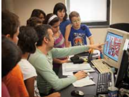
• Alumnes de 5è i 6è de primària del CEIP Josep Peñuelas del Río van visitar l'Ajuntament

Al llarg de l'any es celebren un mínim de dos Consells formats per alumnes elegits pels seu propis companys de classe. En concret hi ha 4 alumnes de 5è i 4 alumnes de 6è. i els que estan de públic van variant cada cop que hi ha un Consell, així tots els alumnes