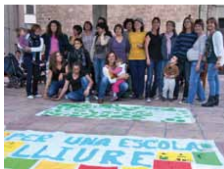
• Activitats de mares i alumnes a Agullana en la defensa de l'escola rural

traslladar-se a la plaça on van retolar i pintar lemes reivindicatius sobre lones i pancartes després exposades a la façana de l'escola.