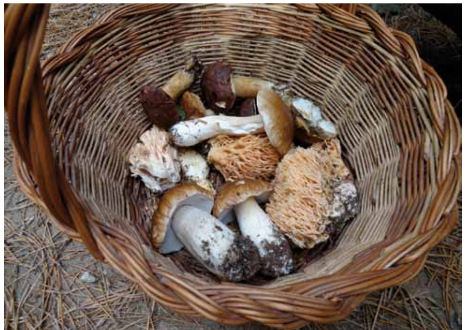
• Cistellet de bolets caçats a l'octubre (i alguna castanya amagada sota els peus de rata) entre coll de Lli i santuari de Les Salines

L'octubre ha estat un mes càlid i molt sec, i no només a la Jonquera, sinó en general a tot Catalunya, amb una mitjana d'entre 2 i 4 graus de temperatura per sobre la mitjana. Per la foto del mes, un cistell de castanyes i bolets mig ple, trobats camí de Les Salines. ■