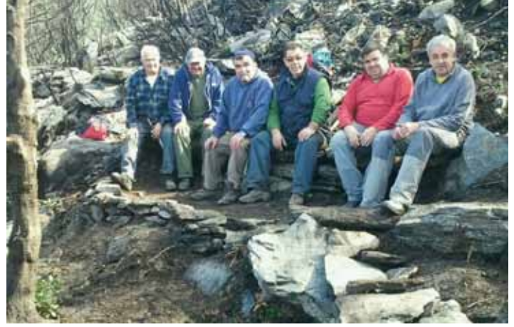
• Restauració de la Font del Massà

entre Caçadors i G.A.T i amb el suport del C.E.J, ha estat la rehabilitació i senyalització de diferents fonts: la del Vesc, la font del Massà, la dels Fangassos, Figuerassa o la dels Banyadors o dels Verns, aquestes han sigut les escollides per aquest any. També hi ha la intenció de continuar rehabilitant-ne més de cara a l'any vinent.