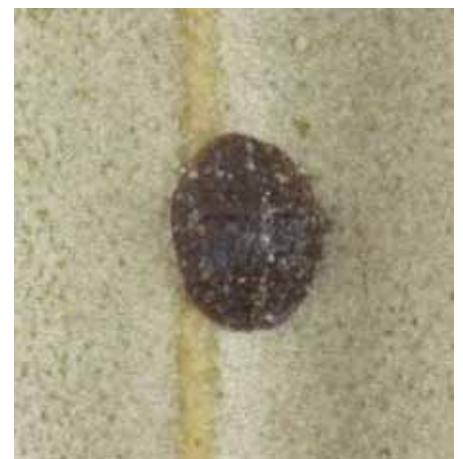
• Caparreta negra en una fulla d'olivera