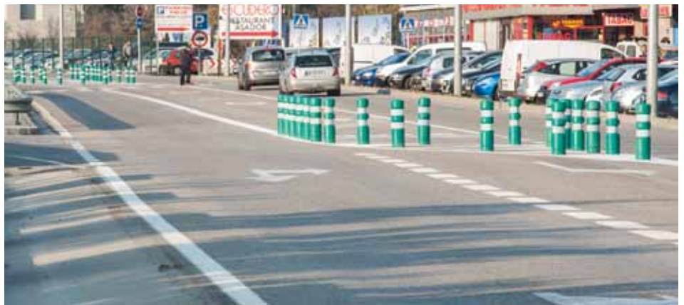
• Cruïlla de l'N-II amb el carrer Arriate (J. Ribas)

Aquesta millora important de l'N-II es complementarà amb la reordenació, per part del consistori, de l' Avda. Arriate i el carrer Llobregat prevista per l'any vinent.