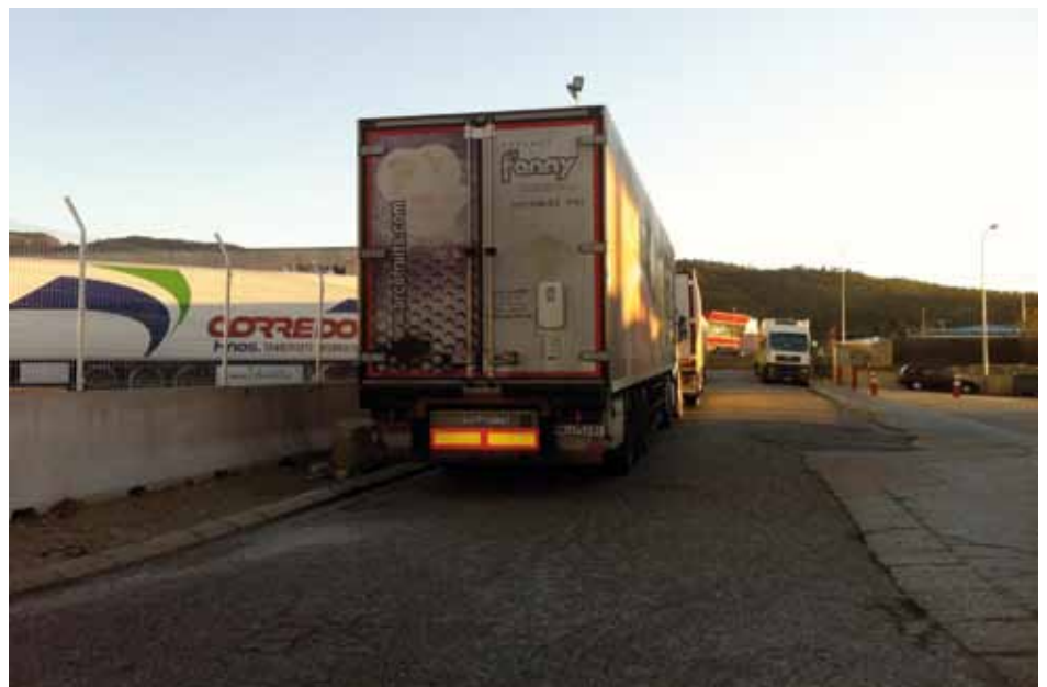
• Camions aparcats al bell mig del carrer Salines, al polígon Vilella de la Jonquera