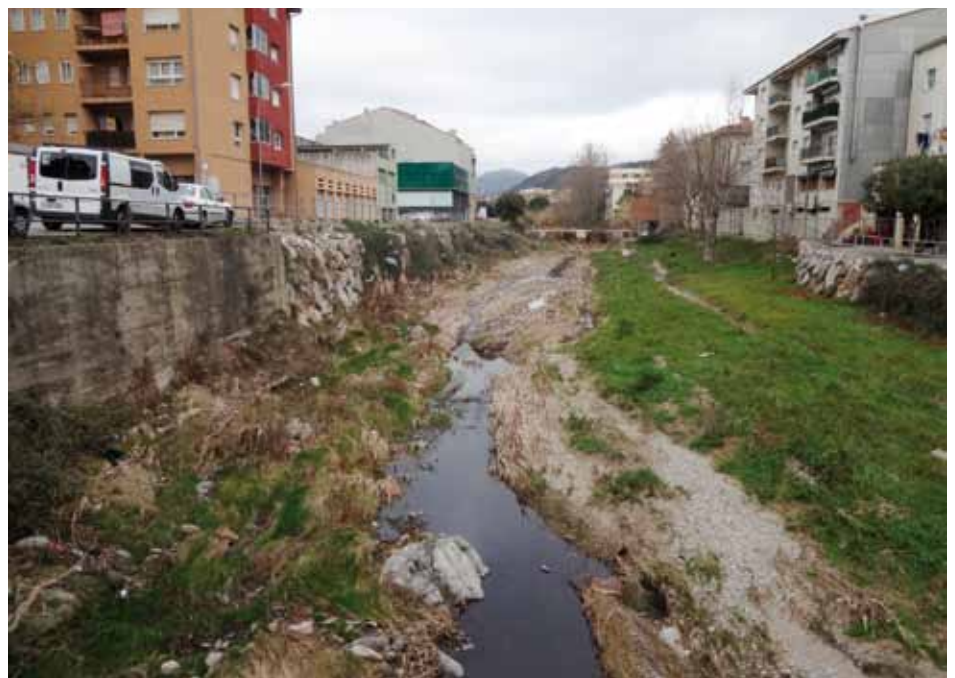
• El riu en el tram del carrer Mateu Pla fins a la resclosa de Correus (Infojonquera.cat)

El Llobregat en el tram de La Caixa. Poca aigua i força deixalles, reflex de la poca pluja del desembre, que fa que el riu es vegi lleig i brut.