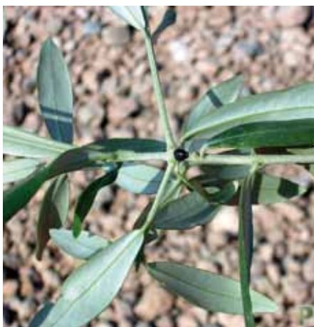
• Caparreta negra en una olivera

Fonts d'informació (bibliografia): http://gipcitricos.ivia.es/area/plagas-principales/coccidos/caparreta-negra http://www.biodiversidadvirtual.org/insectarium/Saissetia-oleae.-img175383.html http://www.agrologica.es/informacion-plaga/caparreta-negra-cochinilla-tizne-saissetia-oleae/ http://www.phytoma.com/gallery.php?autor=7