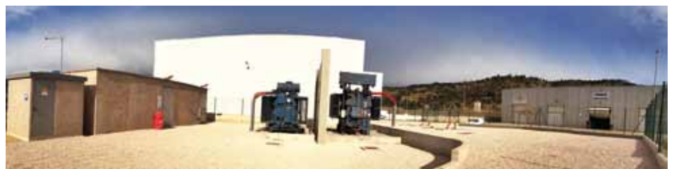
• Nou transformador, ubicat al Polígon Les Oliveres, de la Jonquera

ministrament elèctric tant a la zona industrial com de serveis ampliada de la Jonquera. A més, en cas d'incidència de la línia principal que alimenta el municipi d'Agullana, els clients veuran reforçat el subministrament gràcies a la connexió d'aquestes dues línies noves. El conjunt de reformes beneficiaran a un total de 2.231 clients de cinc municipis; Agullana, Els Límits, La Jonquera, La Vajol i Maçanet de Cabrenys.