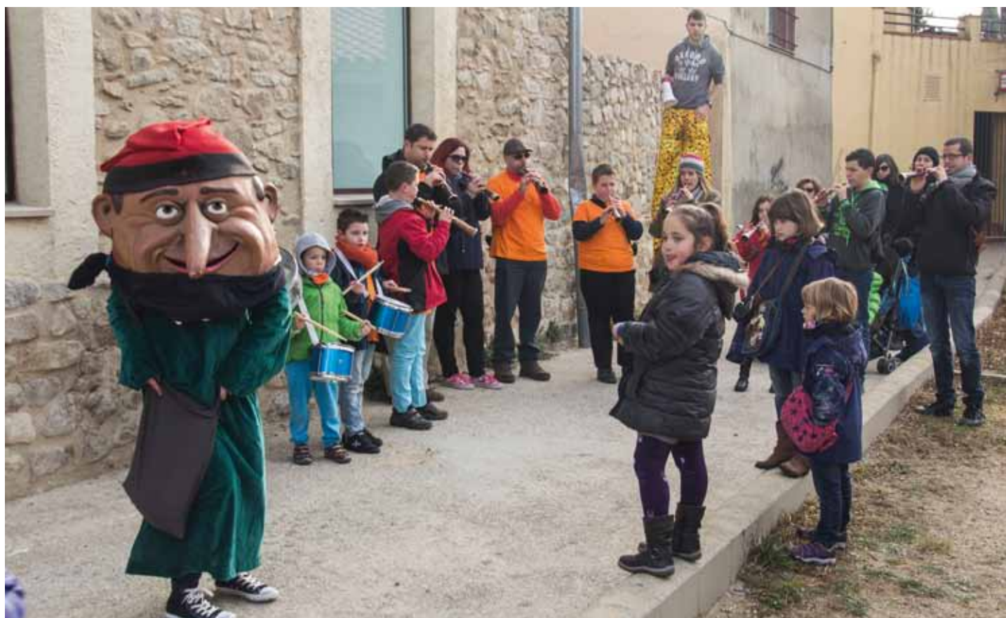
• L'Home dels Nassos va tornar a sortir pels carrers de la Jonquera el darrer dia de l'any