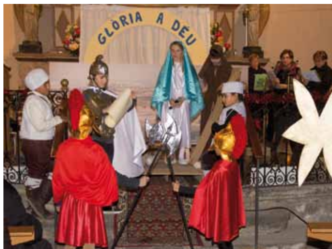
• Sessió de "Pastorets" a l'església parroquial de Santa Maria de la Jonquera.