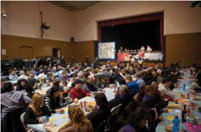
• Quina a la Societat La Unió Jonquerena