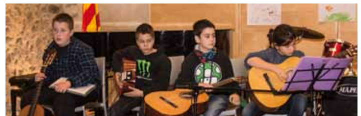
• Tradicional concert de l'escola de música de la Jonquera que cada any ofereix per Nadal amb la participació de tots els alumnes als baixos de Can Laporta