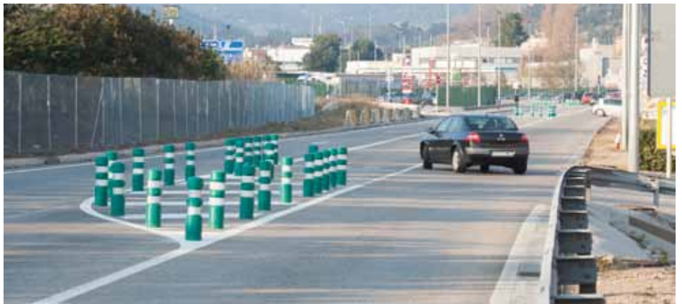
• Cruïlla de l'N-II amb el carrer Mateu Pla (J. Ribas)