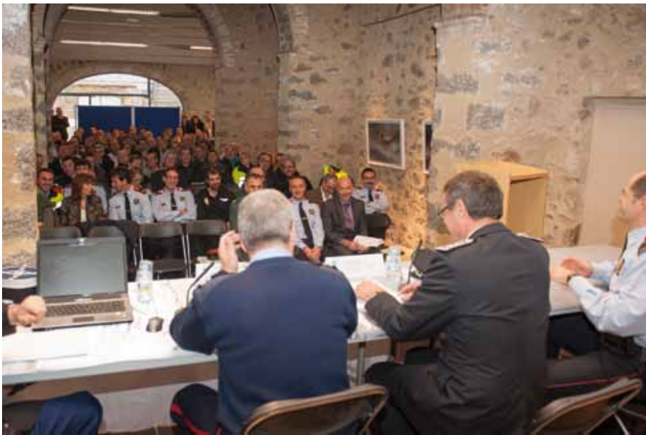
• Les jornades es van allargar fins a l'11 de desembre amb la participació de diferents ponents i assistents

Les jornades transfrontereres sobre seguretat i emergències van reunir durant dos dies un centenar de persones, entre elles alcaldes, regidors, responsables de les unitats de coordinació policial i d'emergències d'ambdós costats de la frontera i membres dels cossos, entre d'altres, amb l'objectiu d'aprofundir en el coneixement i debatre sobre la situació i les pràctiques des d'una perspectiva interdisciplinària que permetin garantir la seguretat de la ciutadania i dels béns en una zona en què la frontera física és cada cop menys present. ■