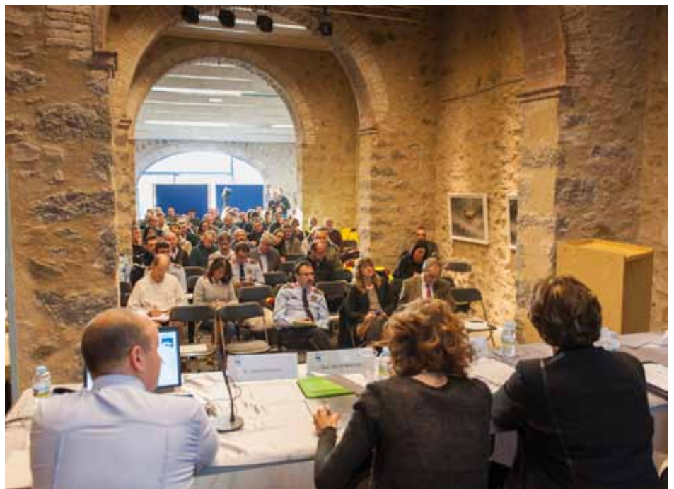
• Jornades Transfrontereres de seguretat i emergències a la Jonquera el matí del 10 del desembre

D'altra banda, els delictes contra la propietat industrial i la falsificació de marques són uns fets complexos d'abordar per part de les autoritats, que s'agregen per la falta de