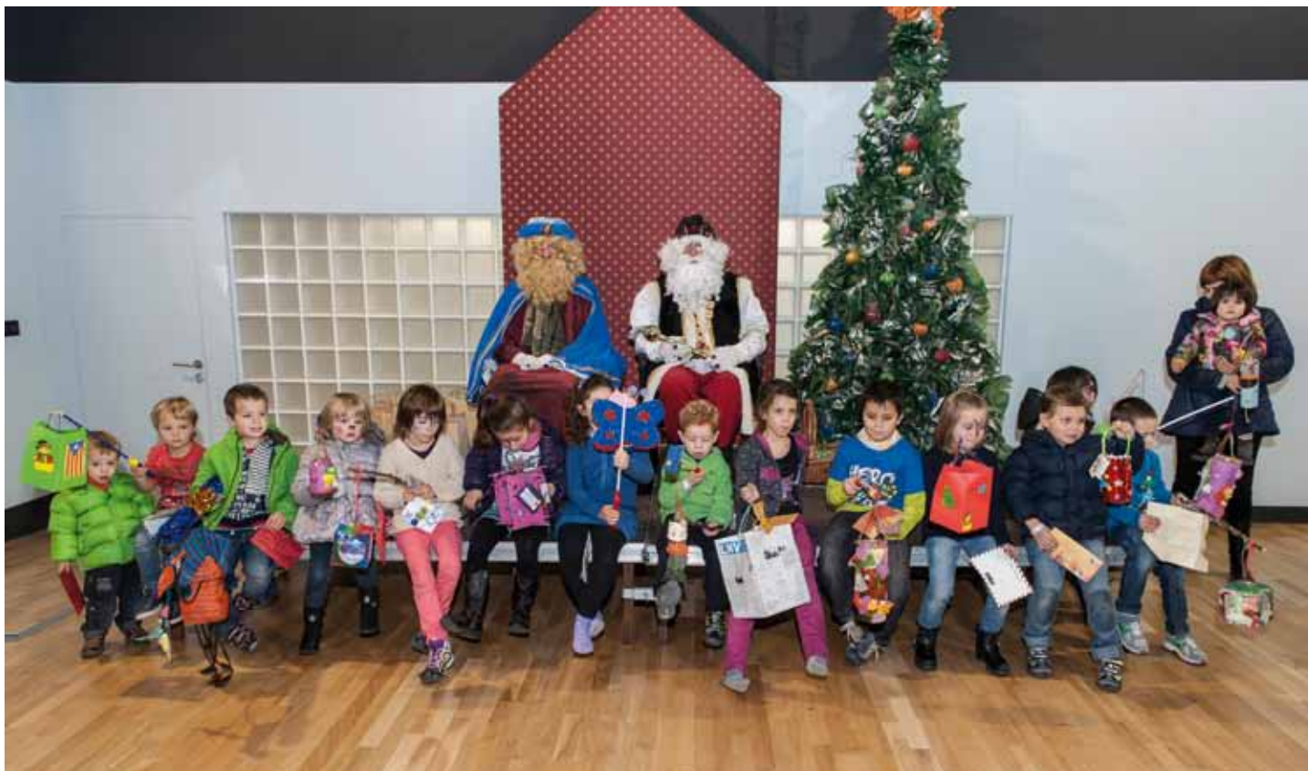
• Concurs de Fanalets, amb molta participació i per descomptat un gran nivell. Tots van rebre premi