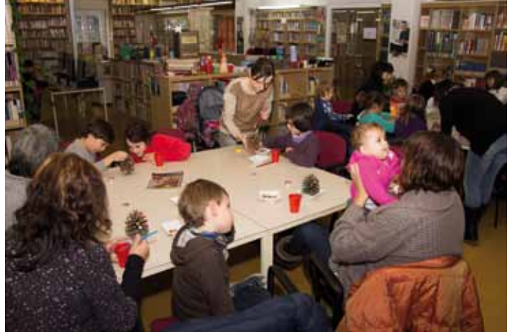
• Èxit de participació en els dos tallers de Nadal que la biblioteca de la Jonquera va muntar per el dia 23 a la tarda, es van omplir totes les places per poder fer diferents objectes de decoració nadalenca de la mà de les dues monitores de la biblioteca

impremta internacional Servei de Comunicació Integral Avgda. Euskadi, 10 nau 6 - Apt correus 151 T./F. 972 554 105 - 17700 LA JONQUERA www.impemta.info