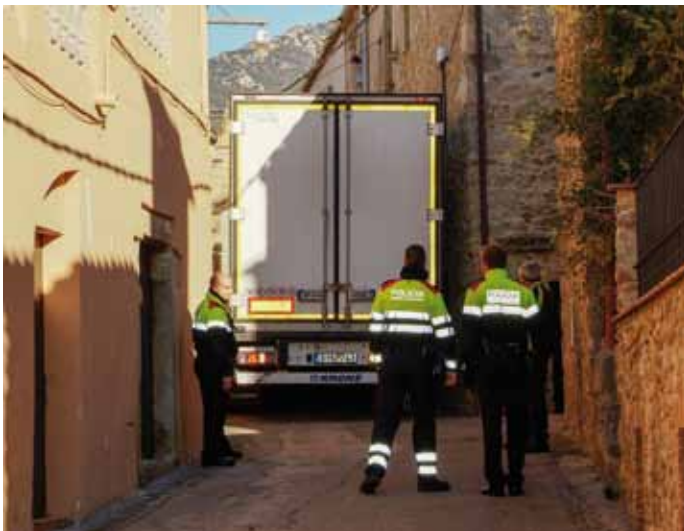
• Vista posterior del camió que va passar més de 5 hores encastat al carrer Figueres

El resultat de tot plegat van ser uns quants cotxes i façanes afectades i una diada de Sants Innocents que cal imaginar molt entretinguda al tranquil poble de Cantallops.