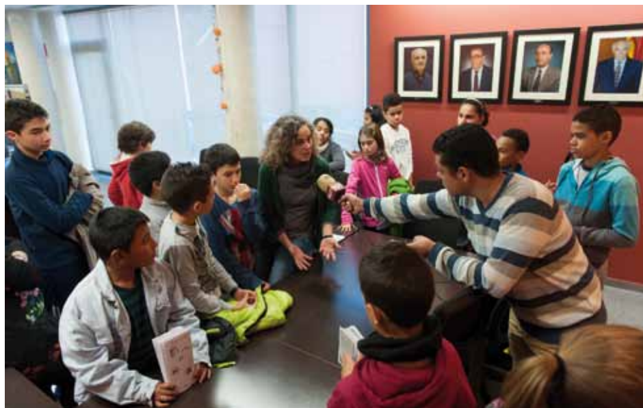
• La sessió del Consell d'Infants va despertar l'interès de molts mitjans de comunicació