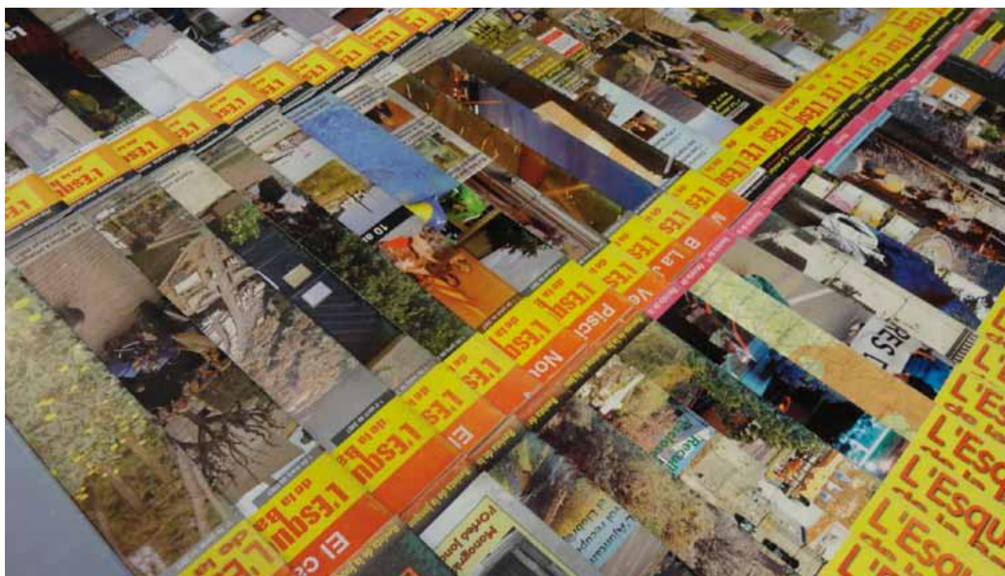
• Exemplars de L'Esquerda impresos en aquests 20 anys