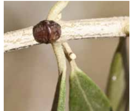
• Caparreta negra en una fulla d'olivera