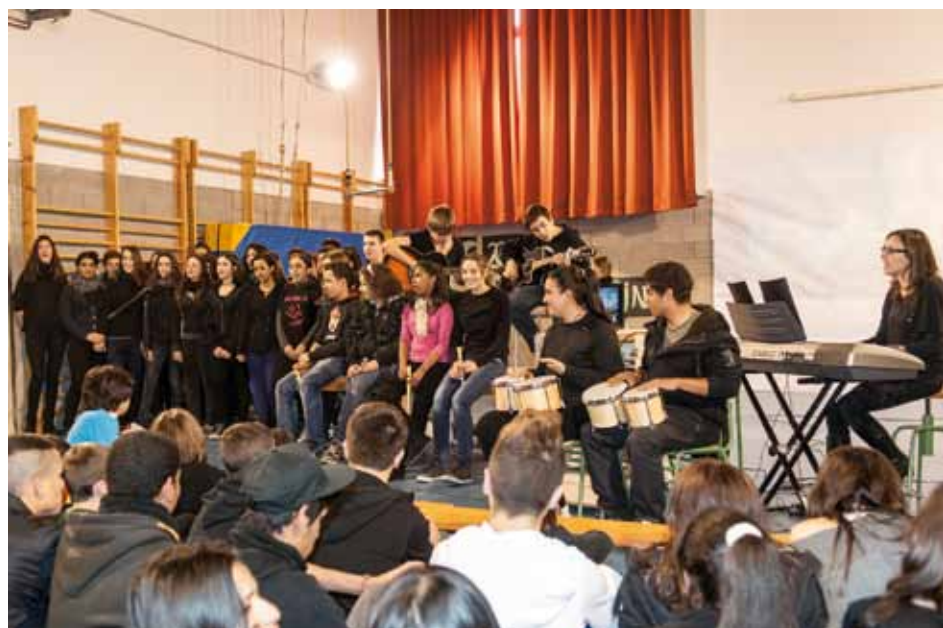
• Activitats corresponents al desembre de 2012