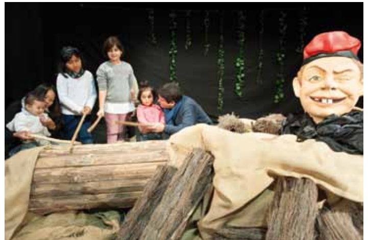
• Caga tió a la Jonquera, la tarda del dimarts 24 de desembre tot els nens i nenes que van donar-li un bon cop de bastó és van emportat un regal i caramels.