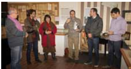
• Dissabte 30 de novembre va ser inaugurada l'exposició. J.R.

El mes de desembre el MUME ha acollit l'exposició “Josep M. Corredor (1912-1981): de casa a Europa”. L'exposició encara es podrà veure fins al 12 de gener de 2014. Aquesta exposició és una producció del Museu d'Història de la Ciutat de Girona i l'Ajuntament de Girona que commemora el centenari de l'intel·lectual gironí exiliat, Josep M. Corredor.