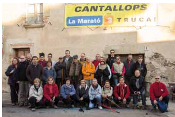
• Tots amb la Marató de TV3! A Cantallops es va organitzar una caminada fins al Mas Soler juntament amb el Consorci Aspres d'Empordà-l'Albera, amb l'objectiu de recaptar fons per a la Marató de TV3.