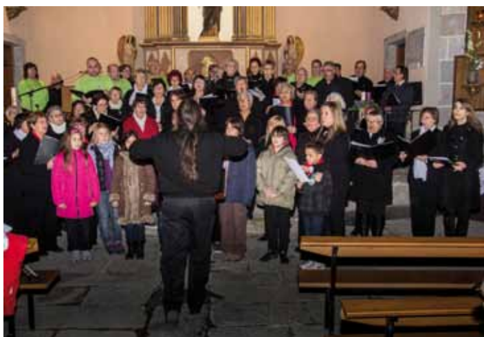
• Tradicional concert de Nadal a l'església Parroquial Santa Maria de La Jonquera a càrrec dels Alumnes de l'Escola Municipal de La Jonquera, L'orfeó Jonquerenc, la Coral els Lledoners de la Selva de Mar, la Coral Palandriu de L.Lançà i el Cor de Cambra Sota Palau de Blanes.