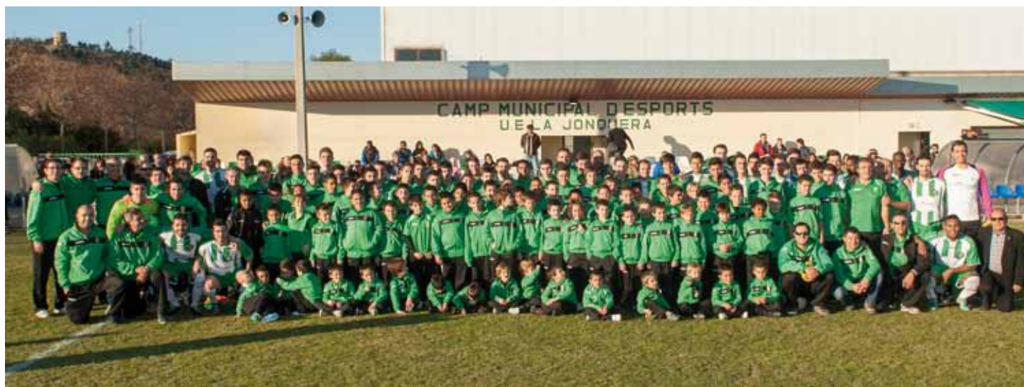
• Presentació dels equips Base de la UE la Jonquera, el diumenge 15 de desembre