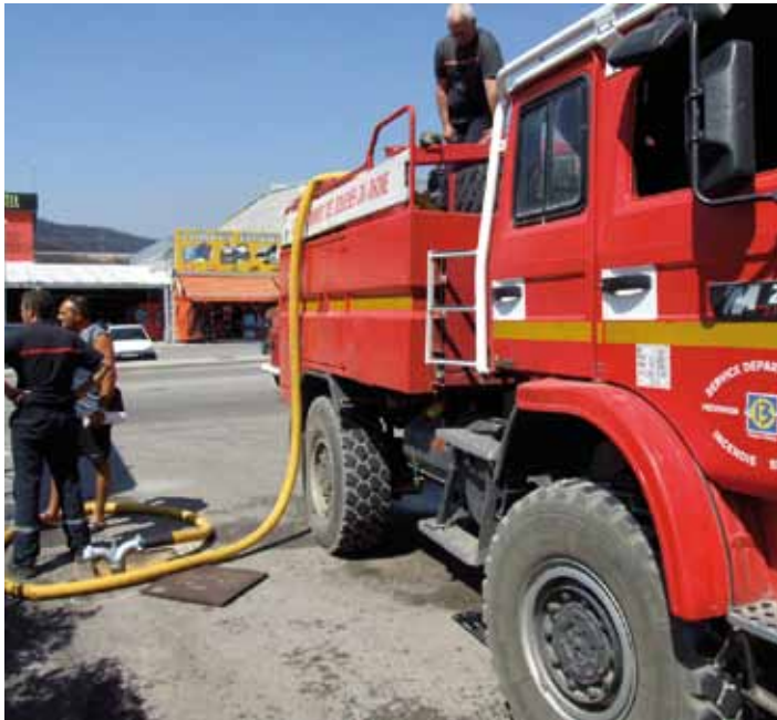
• Un camió de bombers del Departament Bouches du Rhone, a la Jonquera el juliol de 2012

Els bombers francesos denuncien mancances en la gestió dels focs del 2012 a l'Empordà: la principal és l'absència d'un conveni amb Catalunya que els permeti passar la frontera ràpidament en cas d'emergència sense haver d'esperar les autoritzacions administratives com és el cas actualment. El 2012 haurien pogut intervenir amb més eficàcia i més ràpidament, en les primeres hores del foc, però es van haver d'esperar.