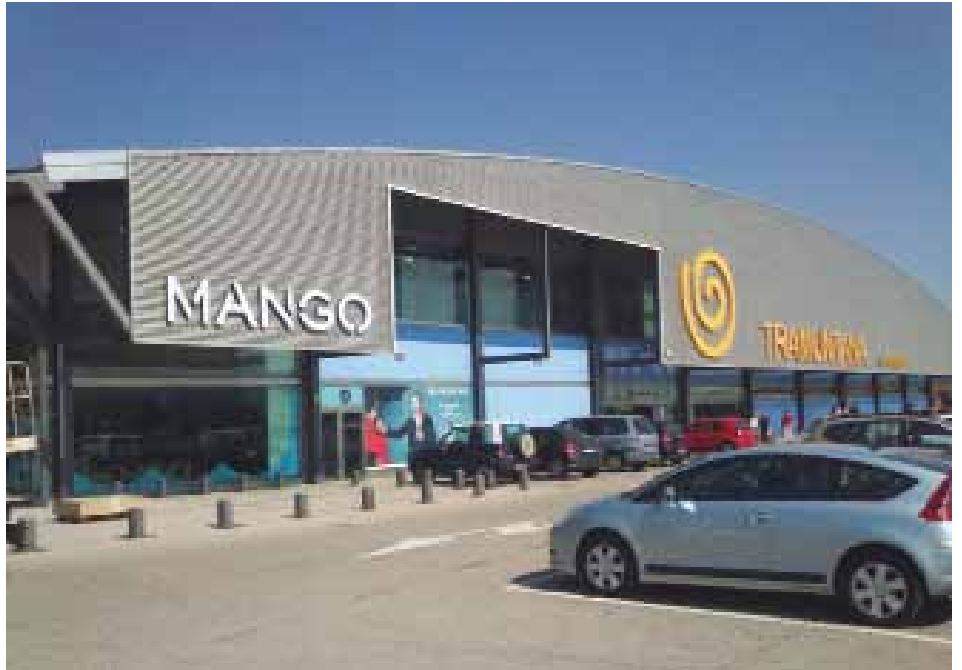
• Supermercat Tramuntana i Espai Mango al polígon Mas del Pla de la Jonquera