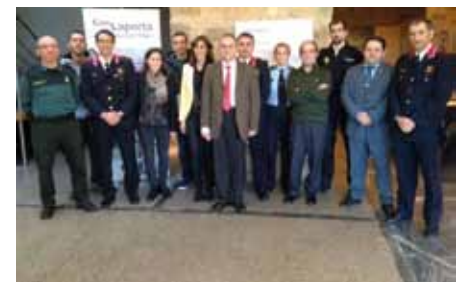
• Celebrada la reunió de la Junta de Seguretat a Can Laporta del 24 de novembre

El 24 de novembre va celebrar-se, als Porxos de Can Laporta, la Junta Local de Seguretat, en la que sota la presidència de l'alcaldesa, es va debatre l'estat de la seguretat ciutadana del municipi i s'orientaren les accions i les polítiques de seguretat municipal. A la reunió hi van assistir representants de tots els cossos policials que operen a la zona de la Jonquera.