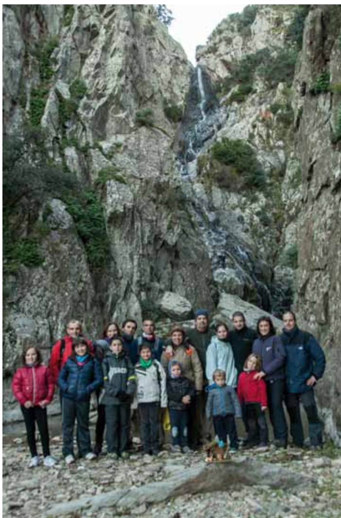
• El CEJ va portar el pessebre al Salt del Fitó. Com ja fa cada any i és tradició a les entitats alpines del nostre país, l'entitat de la Jonquera va portar un "naixement" o petit pessebre al Fitó. L'any passat la portada del pessebre es va fer al Pic de Cristau, fa dos anys a l'ermita de Sant Julià i fa tres al Puigneuós.