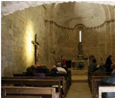
• Un moment de la missa a l'interior de l'ermita de Santa Llúcia

El divendres 13 de desembre es va celebrar, com cada any, la diada de Sta. Llúcia a l'ermita. Unes 50 persones de la Jonquera,