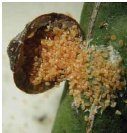
• Femella de Caparreta negra amb ous