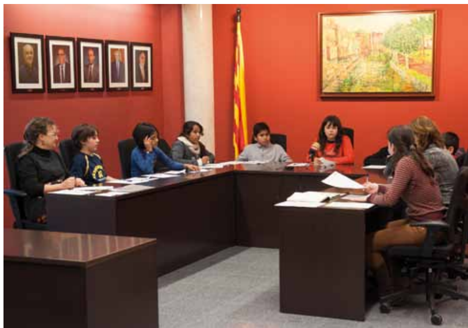
• Sessió del Consell d'Infants de la Jonquera celebrat del 12 de desembre la Sala de Plens del consistori jonquerenc

Els alumnes, que es mostren orgullosos del seu municipi, estan preocupats per la imatge que es dona de la Jonquera als mitjans “és una llàstima que només sortim al diari per coses negatives, perquè al poble s'hi fan moltes coses bones” exposava en Ricard, de 6è de primària.