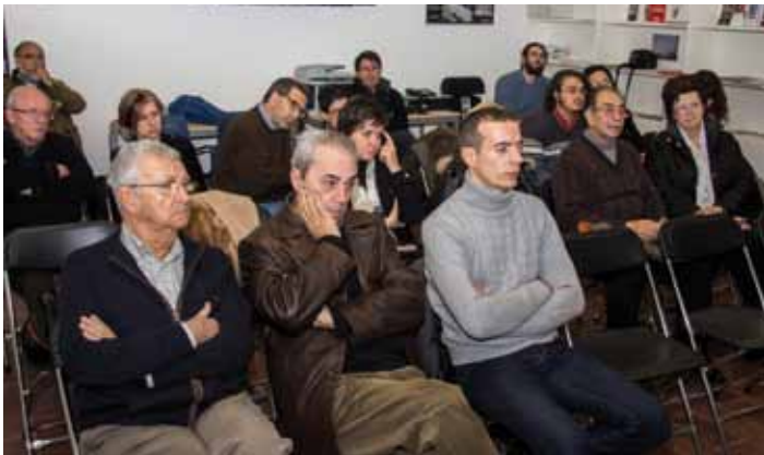
• Reunió celebrada al MUME el 14 de desembre per crear el Amics del Museu