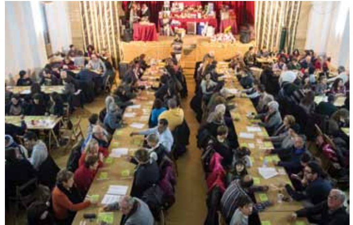
• Quina a Cantallops