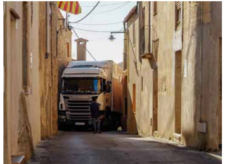
• Les maniobres per retirar el camió van ser lentes per la dificultat de maniobrar el vehicle articulat