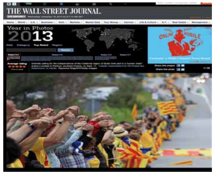
• La cadena humana Via Catalana al Portús. - Captura de pantalla de l'edició Online

Es dona el cas que una imatge de la Diada ja va ser a la portada a l'edició europea impresa el dia 12 de setembre, l'endemà de la cadena.