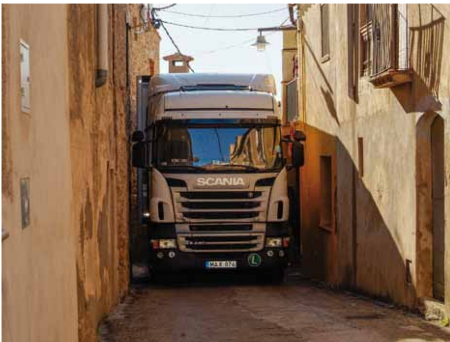
• El camió va passar més de 5 hores encastat al carrer Figueres de Cantallops