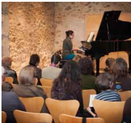
• Una imatge del festival (J. Ribas)

El de la Jonquera va ser un concert amb música de piano i de cambra, amb la participació de l'escola de música de la Jonquera, l'escola de música El Gavià de l'Escala i les escoles de música de Figueres Pep Ventura, la Flauta Màgica i Temps de Música.