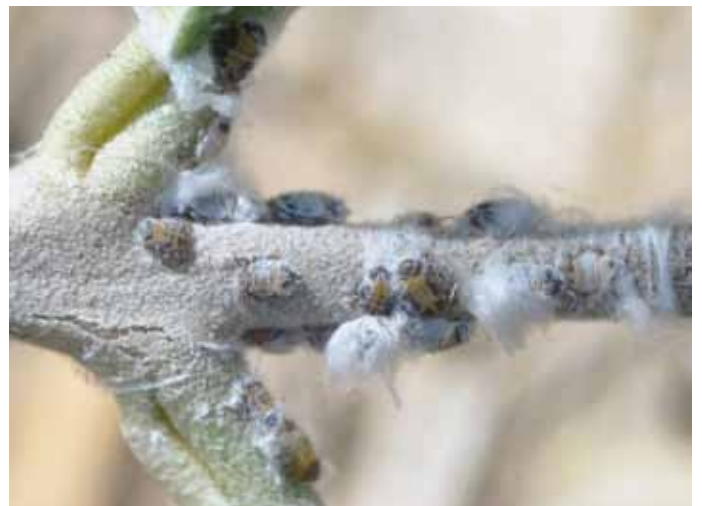
• Afectació del cotonet a les branques