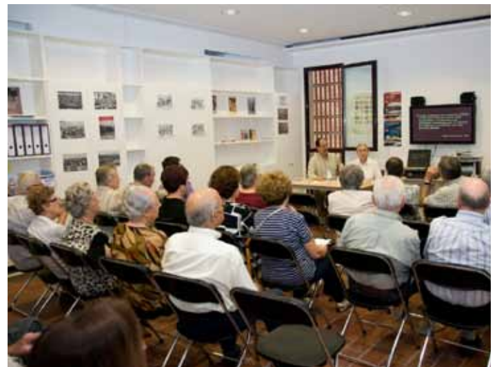
• Presentació d'un llibre al MUME