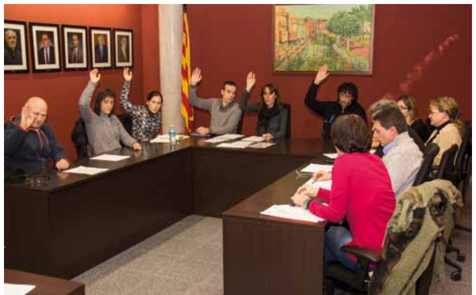
• Ple municipal celebrat el 20 de gener de bon matí

D'aquesta manera, el govern municipal que encapçala l'alcaldeessa, Sònia Martínez, podrà també tirar endavant les inversions, que preveuen, entre altres aspectes, uns 100.000 euros per a l'adquisició de càmeres de vigilància en diferents punts del municipi.