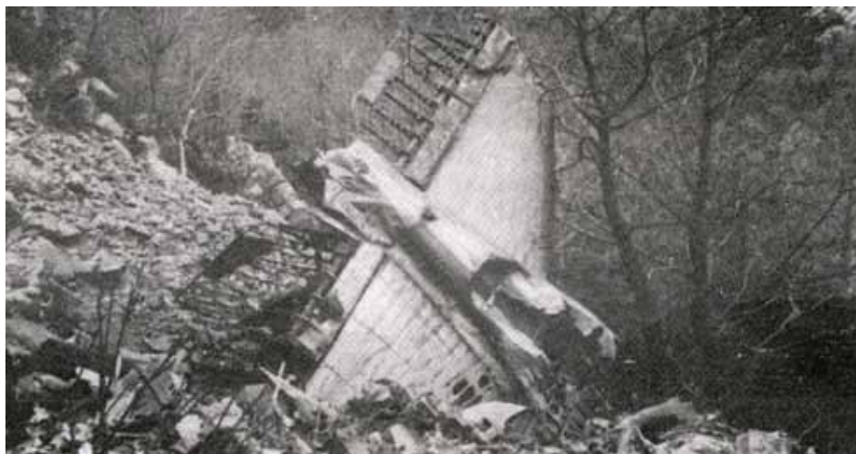
• Cua de l'avió accidentat l'any 1950, a a zona del Coll Forcat (Esquerda de la Bastida 1994)

Un avió bimotor d'hèlix, que pertanyia a