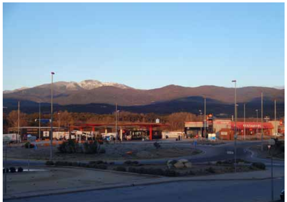
• Divendres 31 de gener de 2014, primer dia de l'hivern que s'ha vist el massís de Les Salines amb una nevada important.

Ha costat veure el massís de Les Salines cobert d'un blanc una mica consistent, és a dir, amb un gruix. No va ser fins els dies 30 i 31 de gener que se n'hi va acumular.