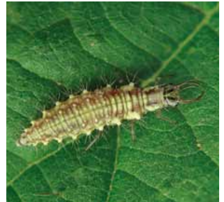
• Crisopa en estat larvari