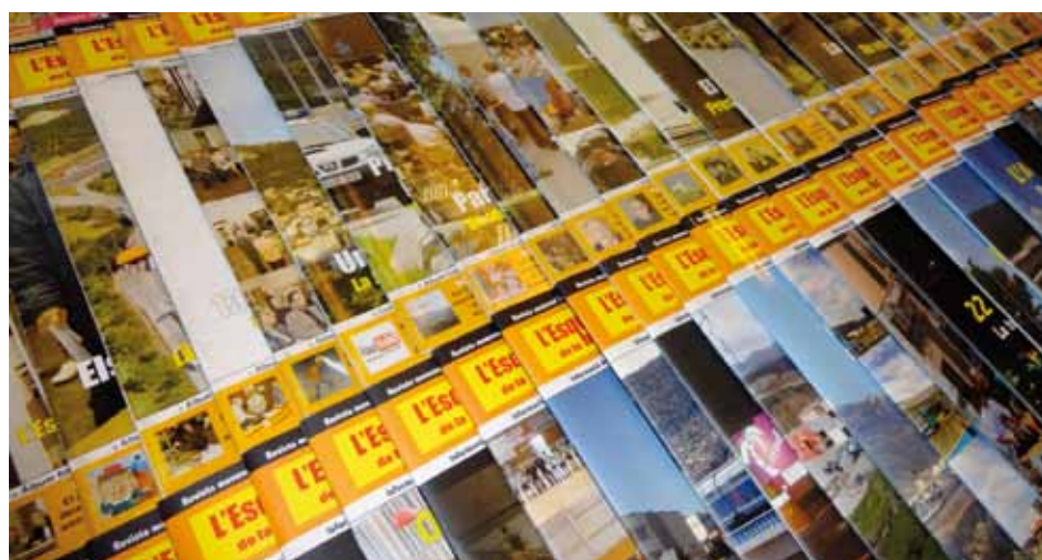
• Portades sobreposades de diferents edicions de L'Esquerda