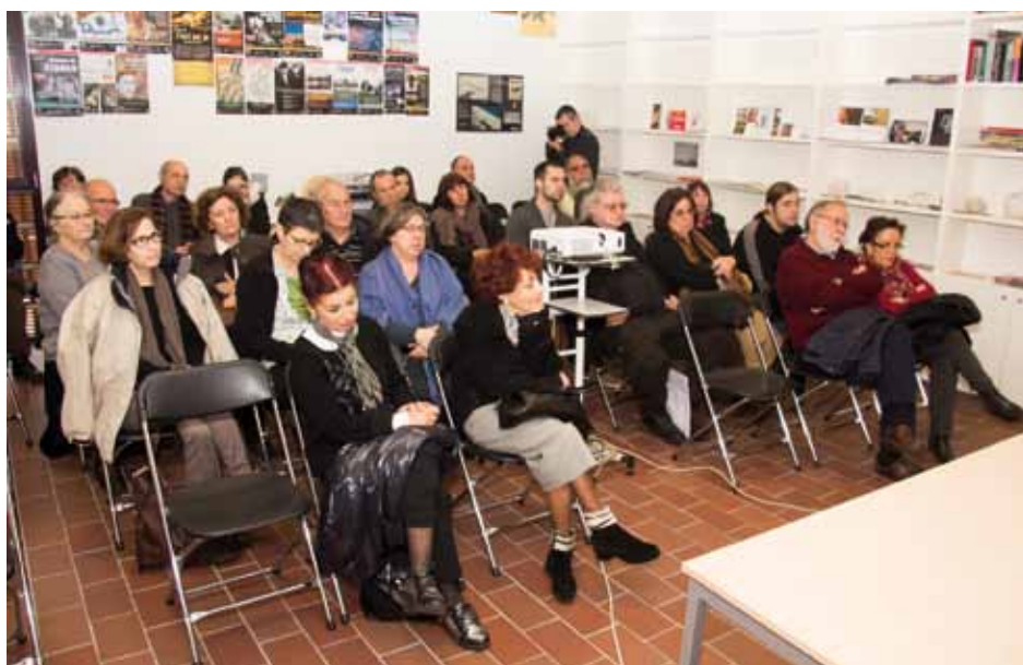
• Presentat el documental "Desde el silencio. Exilio republicano en el norte de África"