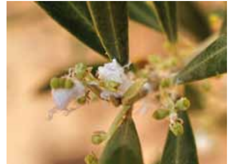
• Afectació del cotonet a les flors

Fonts d'informació (bibliografia): www.biodiversidadrural.org