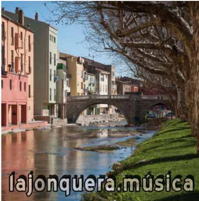
• Reproducció de la portada del CD