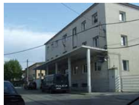
• La Policia espanyola a la Jonquera va intervenir en les detencions

La policia espanyola va detenir a mitjans de gener 26 persones a Barcelona, set a Tarragona i dues a La Jonquera que pertanyien a una trama que presumptament blanquejava diners procedents del narcotràfic de cocaïna. La droga era trasllada per mar des de Sudamèrica amagada en contenidors i carregaments de fruita o bé mitjançant "mules humanes".