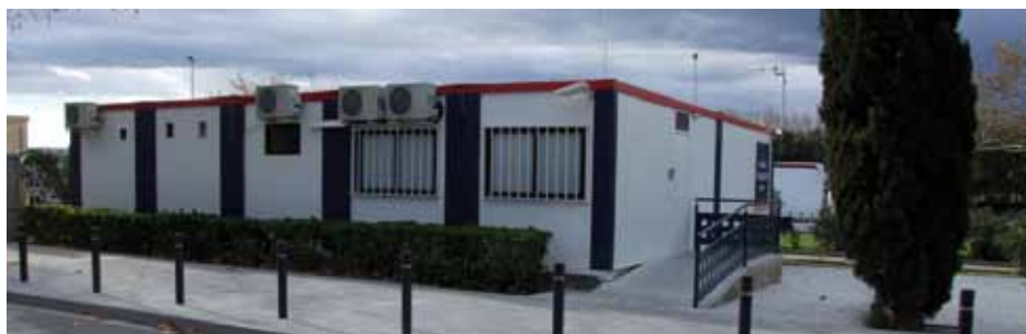
• Comissaria de Mossos d'Esquadra a la Jonquera

al costat del seu cotxe sol·licitava ajuda. En acostar-se, l'agent va veure que una dona estava seminconscient al seient davanter. Després d'avisar els serveis d'emergències, l'agent va practicar a la dona uns primers auxilis per recuperar-li la consciència. Un cop estabilitzada pels metges, la dona va ser traslladada al Trueta de Girona.