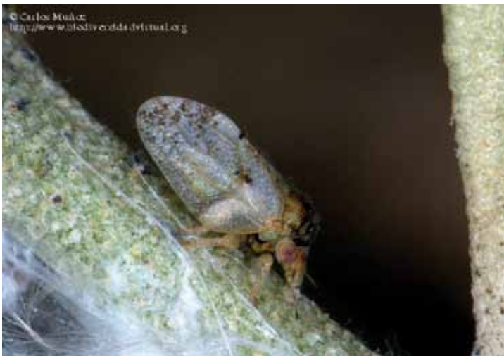
• Cotonet de l'olivera