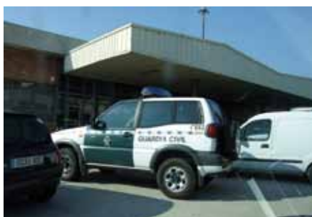
• Cotxe patrulla de la Guàrdia Civil

La Guàrdia Civil va detenir el 28 de gener a la matinada una dona de nacionalitat francesa amb una maleta a l'interior del seu vehicle on hi guardava 5,8 quilos de marihuana. Els agents van interceptar l'automòbil de la dona, de 28 anys i que viatjava com a conductora i única ocupant en un turisme amb matrícula francesa, i van inspeccionar el cotxe, on van localitzar-hi la droga repartida en diverses bosses. El Jutjat d'Instrucció de guàrdia de Figueres es va fer càrrec de les diligències.