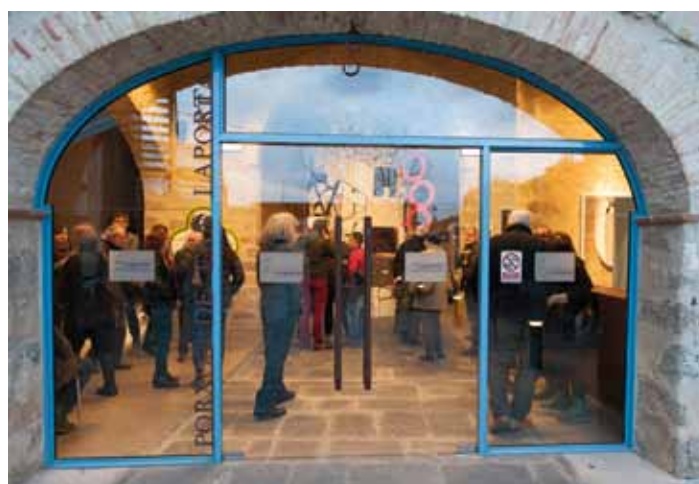
• Exposició d'A. Federico als baixos de Can Laporta