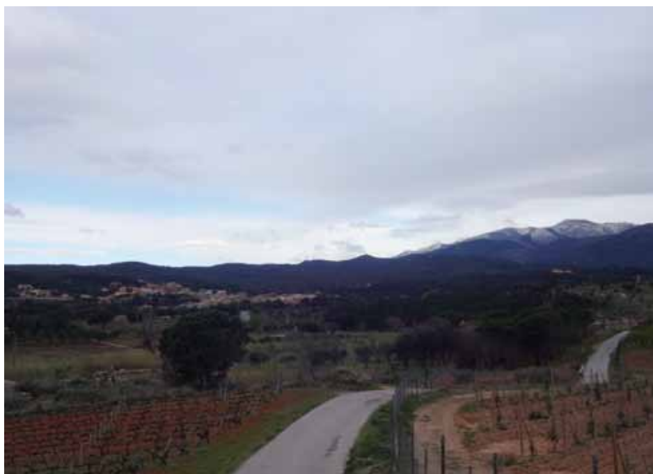
• Camps de vinyes de l'Estrada a primer terme, amb Agullana a l'esquerra i el massís de Les Salines enfarinat, a la dreta

Una imatge hivernal per acomiadar el mes de març. El dia 26 ens vam llevar amb una paisatge d'hivern als pobles de la falda de l'Albera i les salines.