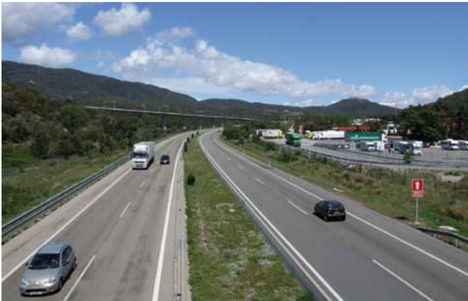
• L'autopista a la Jonquera, una infraestructura amortitzada diverses vegades però per la qual encara es paga peatge per circular-hi

El govern espanyol ha proposat rescatar la desena d'autopistes de peatge que estan en risc de fallida, integrant-les a una empresa pública, però per fer-ho planteja que els bancs creditors de les vies realitzin un quitament de fins al 50% en el deute que suporten. Foment i Hisenda esperen que el proper dilluns els bancs decideixin si accepten aquest model.