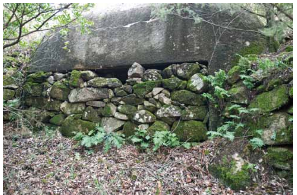
• Imatge d'un búnquer del terme municipal de la Jonquera