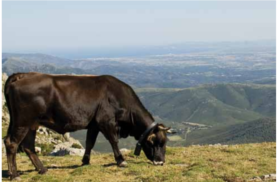
• Exemplar de vaca de l'Albera a la carena entre Puigneulós i el Puig de Sallafort

Aquestes accions formen part d'un pla de la Diputació de Barcelona, que té el suport de