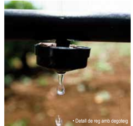
• Detall de reg amb degoteig

Cal tenir present que no és bo abusar del reg, ja que es podria propiciar l'aparició de la malaltia verticilosis, produïda pel fong Verticillium dahliae . Si aparegués, hauríem de deixar de regar. El reg excessiu pot augmentar també la producció d'olives i d'oli però