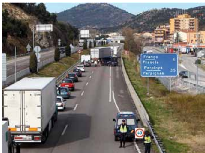
• Un control de la delinqüència itinerant de la Policia Nacional a l'autopista a la Jonquera

Un total de 2.300 vehicles registrats, gairebé 5.000 d'identificats, 28 detinguts, 150.000 euros intervinguts, i drogues i una arma carregada decomissats és el balanç dels primers trenta dies (febrer-març) de l'operació contra la delinqüència itinerant a les comarques gironines que du a terme la policia espanyola. El cos estatal hi té destinats 100 agents que fan controls per detectar aquesta delinqüència, que sol moure's a través dels punts fronterers gironins. Les dades les va aportar el director de la Policia, Ignacio Cosidó, en una trobada amb els comandaments del cos a Girona. Cosidó va presentar la incorporació de 2 oficials a la comissaria de la Jonquera. ■