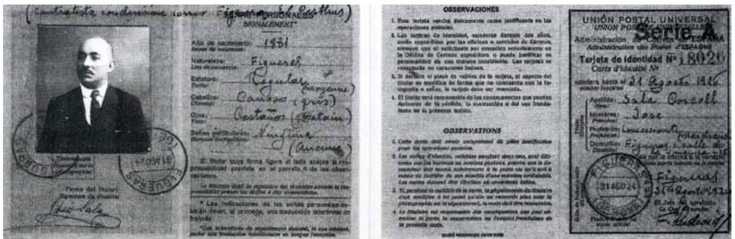
• Carnet de la Unió Postal Universal a nom de Josep Sala i Corcoll com a contractista de la conducció del correu entre el Portús i Figueras

caven camions s'utilitzava l'autobús de línia.