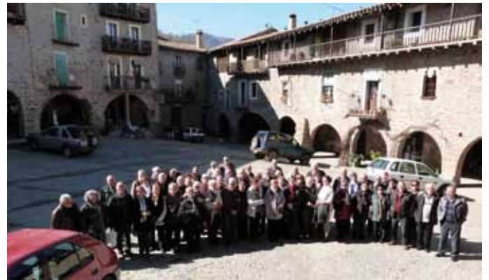
• Sortida del Casal de l'avi a Santa Pau, la Garrotxa

El 7 de març el Casal de l'Avi de la Jonquera va organitzar, conjuntament amb la FATEC, una excursió a Olot per celebrar el Dia Internacional de la Dona. Els jonquerencs van visitar Santa Pau, la Fageda d'en Jordà i van dinar al Restaurant La Deu. L'esdeveniment va comptar amb la participació de 726 socis de casals de tota la demarcació de Girona, a més del de la Jonquera. Després de dinar els assistents van poder ballar o bé fer un passeig per la Font Moixina, i llavors la tornada cap a la Jonquera. I finalment el 27 de març el Casal de la Jonquera va organitzar una sortida a Mataró per visitar la fàbrica de galetes Trias el Museu del Càntir.