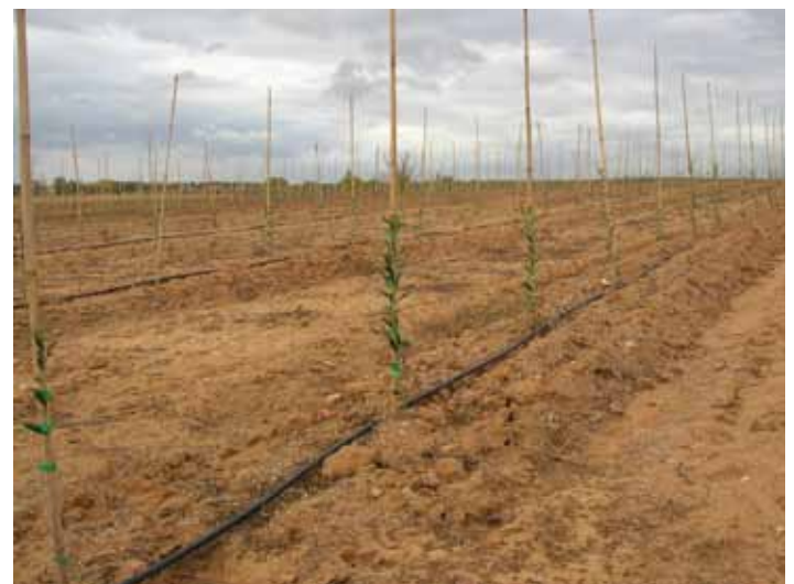
• Sistema de reg amb degoteig