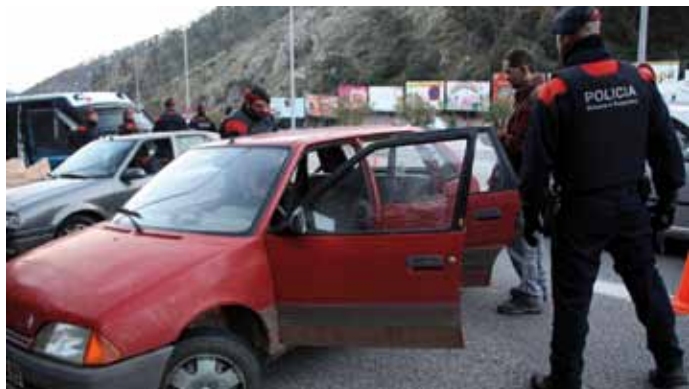
• Agents dels Mossos d'Esquadra durant l'operatiu policial a la Jonquera

La cinquena edició del dispositiu policial Pirineus, que del 6 al 9 de març va mobilitzar 358 agents dels Mossos d'Esquadra, una setantena d'agents de policies locals i efectius de la Guàrdia Civil i la Policia Nacional, s'ha tancat amb un total de 578 persones identificades, 306 vehicles escorcollats, 26 persones detingudes, 46 actes administratives aixecades (22 per comissos de substàncies estupefaents i 20 per tinença d'armes), 64 locals inspeccionats i 65 denúncies en matèria de trànsit.