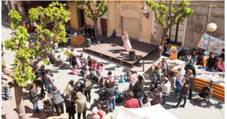
• Una imatge de com es viu el Sant Jordi als carrers de la Jonquera (Arxiu J. Ribas)

La millor flor que ens ofereix el mes d'abril és la festa de la Mare de Déu de Montserrat. Amb el seu nom comença nostra història,