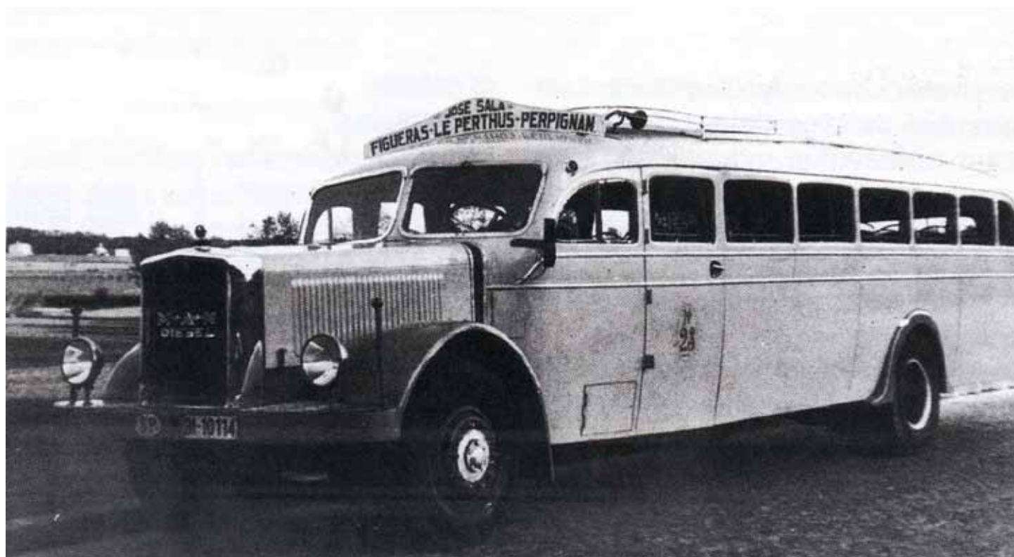
• El primer autocar en circular per la línia la Jonquera - Figueres amb motor dièsel

Amb gasolina racionada, a una quantitat mensual, en relació a la potència del motor i el destí del vehicle -particular, taxi, transport privat o públic- pocs quilòmetres podien recórrer, ja que els litres assignats no eren gaires.