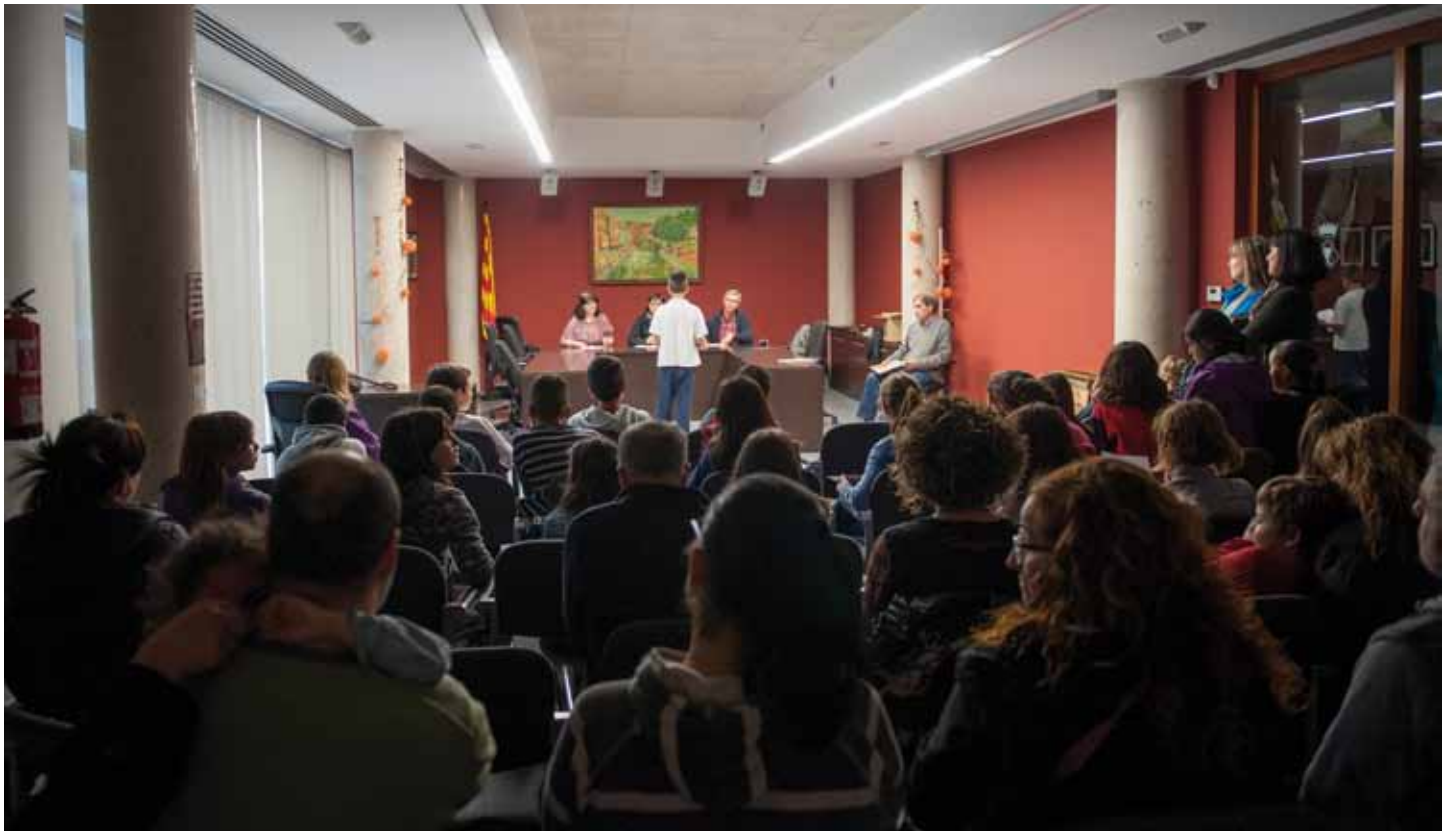
• Lectura de poemes a càrrec dels alumnes del ceip Josep Peñuelas del Rio de La Jonquera a la sala de plens de l'ajuntament del Municipi, coincidint amb el dia mundial de la poesia