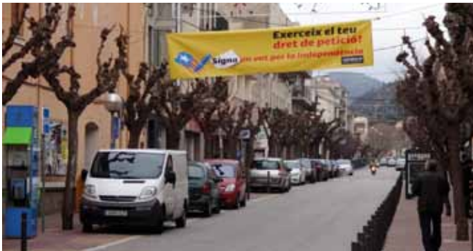
• Pancarta de l'ANC al carrer Major de la Jonquera

L'Assemblea Nacional Catalana (ANC) a la Jonquera continua la campanya "Signa un vot per la independència". La iniciativa està fonamentada en el denominat dret de petició per tal de motivar la convocatòria de la consulta d'autodeterminació i, si no es pot celebrar, forçar una declaració unilateral d'independència. Els dies 22 i 23 de març es va organitzar una nova recollida massiva de "vots" a la Jonquera i Cantallops.