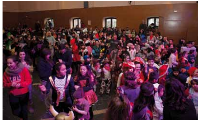
• La Jonquera també va viure el seu carnaval amb molta participació al carrer