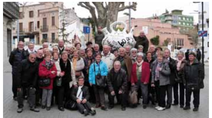
• Sortida del Casal de l'avi al Museu del Càntir, Mataró i Galetes Trias.