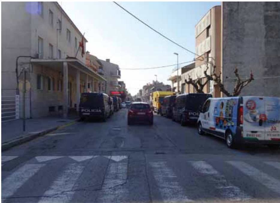
• Els vehicles de la Policia per una banda i els aparcats a la zona blava per l'altra dificulten la circulació