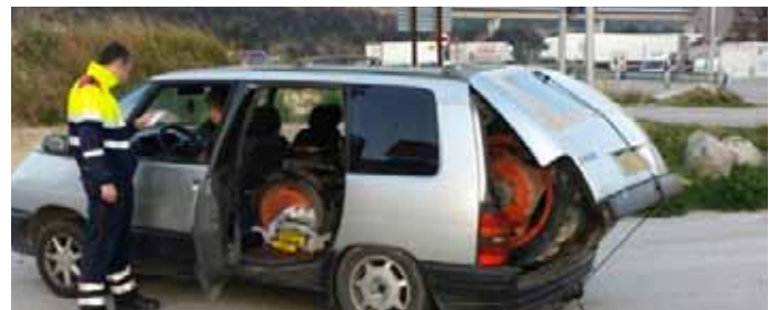
• El monovolum amb el tractor al seu interior, enxampat a la Jonquera pels mossos

Un tractor per desballestar a l'interior d'un vehicle monovolum. Això és el que es van trobar els Mossos d'Esquadra el 13 de març passat després d'aturar el vehicle a l'N-II al seu pas per la Jonquera per un evident excés de pes. Després de comprovar que el tractor no havia estat robat, els agents van denunciar el conductor, un ciutadà francès, per conduir amb massa pes i per una mala estivació de la càrrega. Després de descarregar el tractor i abonar l'import de la denúncia, l'home va poder tornar a circular.