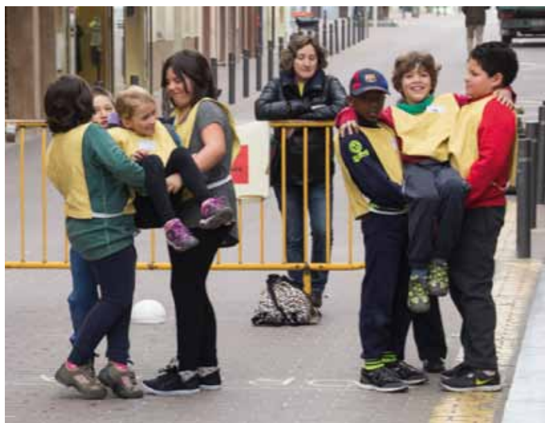
• El Rodajoc pels carrers de la Jonquera el passat 21 de març. Una activitat educativa i participativa que ja és un clàssic