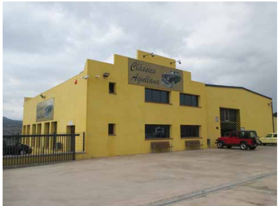
• Façana de les instal·lacions de Clàssics Agullana

"Clàssics Agullana" és una iniciativa privada que té per objectiu la preservació, la restauració i l'ús de vehicles d'interès històric i tècnic, però també ofereix servei a vehicles multimarca del mercat actual, amb un interès especial en el concepte d'atenció al client. Igual que altres tallers d'automoció, a les instal·lacions d'Agullana s'ofereix un servei de reparació mecànica i electricitat.