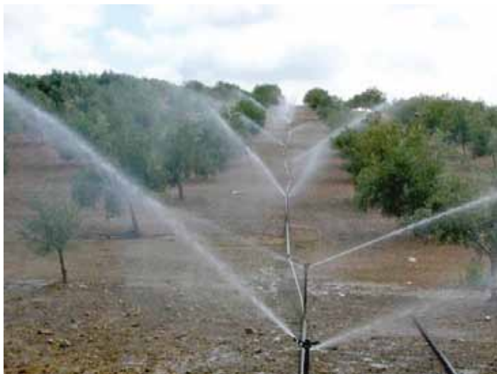
• Sistema de reg per aspersió