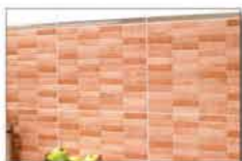
MOD. CUNEO RELIEVE ARCE 31,6X45,2 PRIX PROMOTION A 8,88 TTC/M2