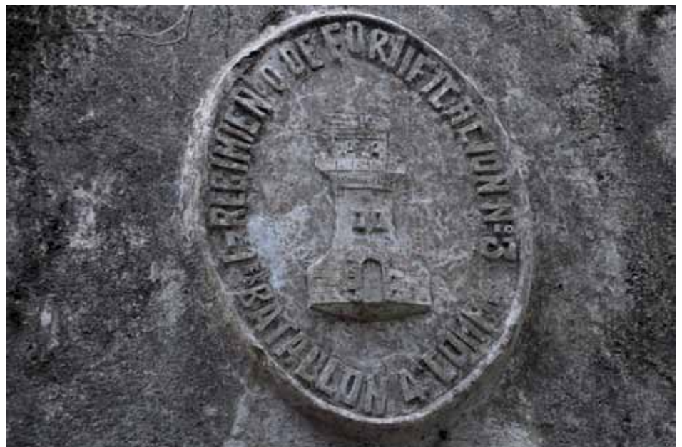
• Entrada en un bunquer situat als Planers de la Serafina

Sabem també que el juny de 1940 hi havia el Batallón de Trabajadores n. 136 (més endavant s'anomenaria Batallón Disciplinario n. 15 ), instal·lats en els