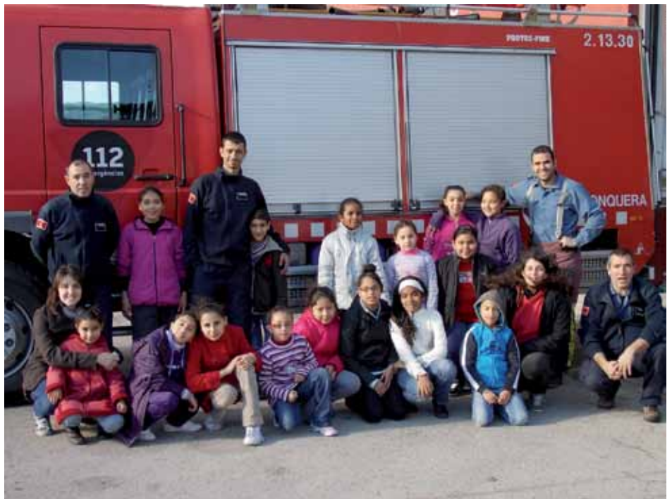
• Els nois i noies de l'Esplai de la Creu Roka en una visita al parc de bombers de la Jonquera

en pràctiques i per dues voluntàries socials. L'activitat és 100% subvencionada per Creu Roja la Jonquera. D'entre les activitats que es va portar a terme aquest dies hi havia el cagatió, un taller de llufes, un taller de cuina, els Pastorets o visitar el parc de bombers de la vila, entre d'altres activitats de joc i lleure. Un cop acabades les vacances de Nadal s'han reprès el contacte els dissabtes i s'oferirà de nou un altre Esplai diari en el període de vacances de Setmana Santa.