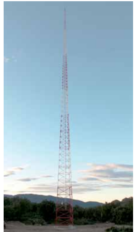
• Torre amb mesurador de vent a la zona de Canadal

L'empresa que ho ha promogut és Gas Natural, que ha iniciat els tràmits per desenvolupar una de les ZDP a la zona de l'Alt Empordà.