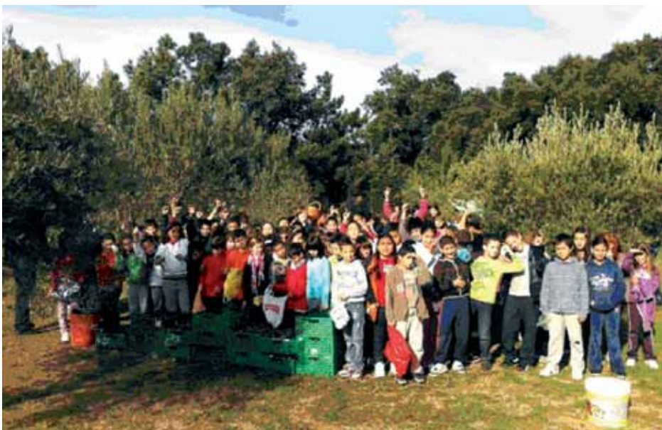
• Els alumnes del CEIP Josep Peñuelas van participar activament a la recollida d'olives del Prat del Suro"

L'olivar "Prat del Suro" compta amb 300 oliveres i va ser comprat per l'Ajuntament de la Jonquera l'any 2006 per un import de 168.000 euros, segons la partida pressupostària de aquell any, amb la intenció d'ubicar-hi una aula de natura. L'olivar del Prat del Suro està delimitat per un vallat al llarg de tot el perímetre i disposa també d'una edificació de més de 60 m 2 que serveix per a base de treball per operaris i escolars.