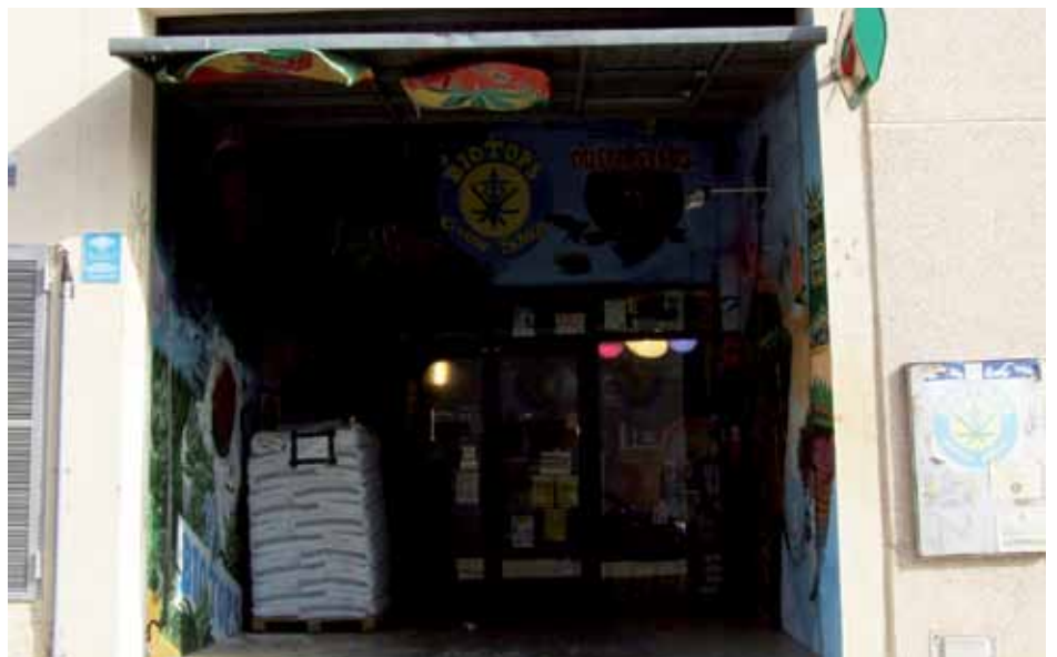
• Botiga de venda de llavors de cànnem indi al carrer Nord de la Jonquera

Maria Grow Shop o Nova Store– llavors i tot el material necessari per al seu cultiu: testos, il·luminació i sistemes de reg per al cultiu interior o hidropònic i fertilitzants. Les llavors també es poden comprar per internet i al mateix preu, però els clients francesos prefereixen el servei que es dona al Portús, com ara la informació sobre les propietats de les diferents varietats. Com a curiositat les llavors de cànnabis, a França, es poden comprar només per un ús "purament decoratiu", no per a ús domèstic ni agrícola, i està prohibit fer-les germinar. (Font: elpuntavui.cat)