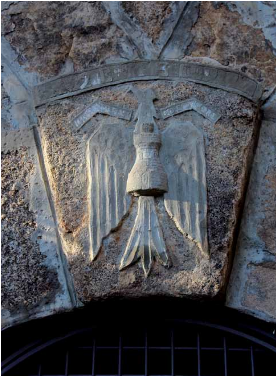
• Entrada al búnquer anomenat "Niu del Àliga"

Querols (nou jonquerencs van estar en aquest batalló). D'aquí passaren a Cabanes per treballar a la carretera de Boadella.