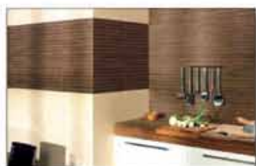
URBANA MARFIL + RELIEVE LINEAL NOGAL