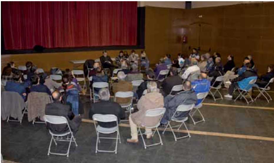
• Acte informatiu d'ERC a la sala-teatre de la Unió Jonquerenca celebrat el 30 de gener

Per contra Domènech també va posar sobre la taula exemples dels beneficis que suposaria un pacte entre CIU i ERC, i es va citar l'exemple la situació actual de l'Escola de Música o la capacitat de treball que tindria un equip de 10 regidors. ERC va descartar a curt o mitjà termini la moció de censura, que només seria possible en una situació molt excepcional, i va suggerir com a única fórmula viable un pacte entre CIU i PP un cop els intents amb ERC han fet fallida. Segons Domènech continuar en la situació actual i prorrogar els pressupostos en els tres anys que queden de legislatura no seria bo per la Jonquera. L'acte va durar 3/4 d'hora i el públic va poder fer preguntes. (Font: Infojonquera.cat)