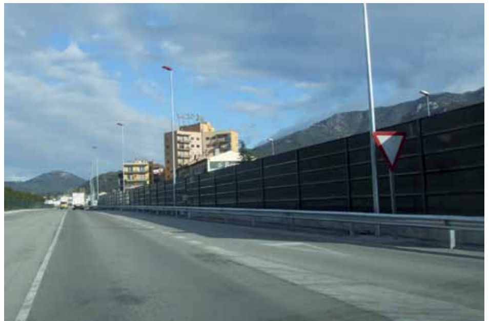
• Les pantalles acústiques instal·lades dificulten la visió del mercat setmanal i part del comerç del carrer Mercader

aquesta obra s'explica pels nombrosos entrebancs que ha patit des del seu inici. Així quan gairebé es complia un any d'obres aquestes van interrompre's a l'agost de 2008 i es feien públiques les desavinences entre la constructora i el Ministeri per motius econòmics. El 2009 va ser el torn de les desavinences amb l'ACA (Agència Catalana de l'Aigua) i el 2010 faltava un gest tant simple com la signatura del Ministre per autoritzar el reinici de les obres. (Font: Infojonquera.cat)