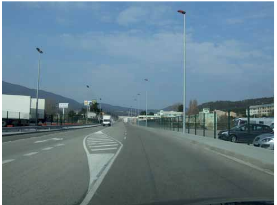
• Tram de carretera N2 en el qual s'hi han realitzat obres a banda i banda amb permís municipal

el grup empresarial va proposar signar un conveni de col·laboració per tal de finançar íntegrament el cost dels treballs de redacció. Va ser precisament aquest conveni el que va ser aprovat en el Ple municipal del 23 de novembre passat, el qual va comptar amb els vots de CIU, ERC i PP. (Font: Acta de Ple de l'Ajuntament de la Jonquera)