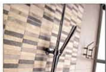
MOD. POLIS RELIEVE GRIS 31,6X45,2 PRIX PROMOTION 8,88 TTC/M2