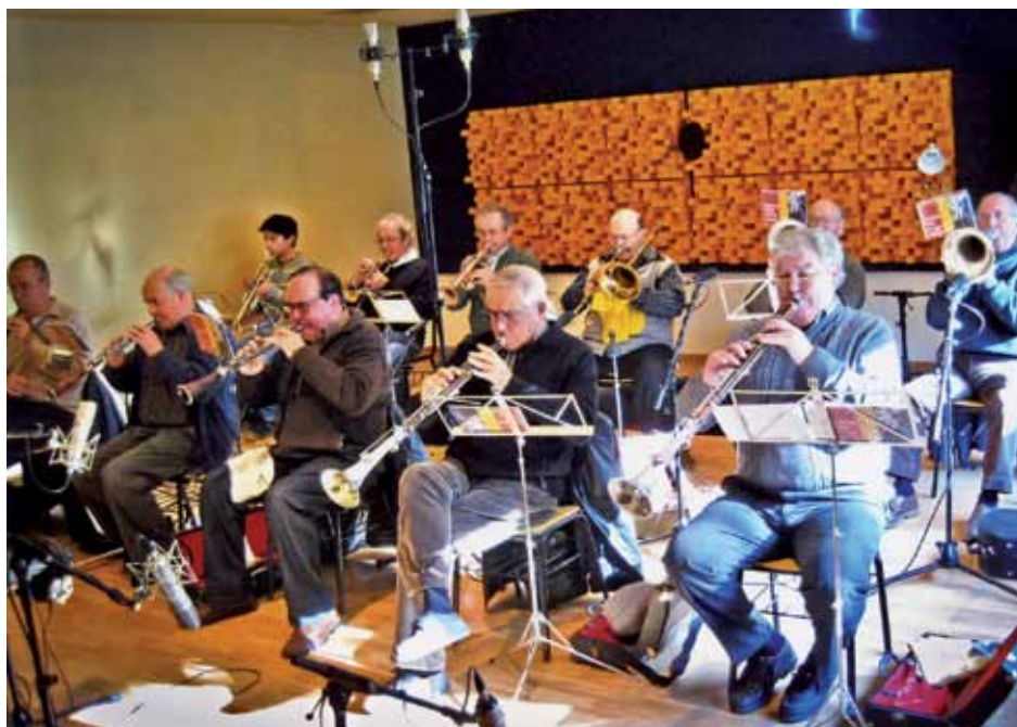
• La cobla a l'estudi de gravació de Girona "44.1"