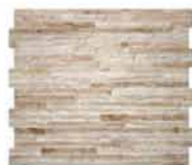
Escocia Arena 34x50 11,80 €/m 2 /iva inclòs

c/ Euskadi, 8 (Pol. Industrial Mas Morató) 17700 LA JONQUERA