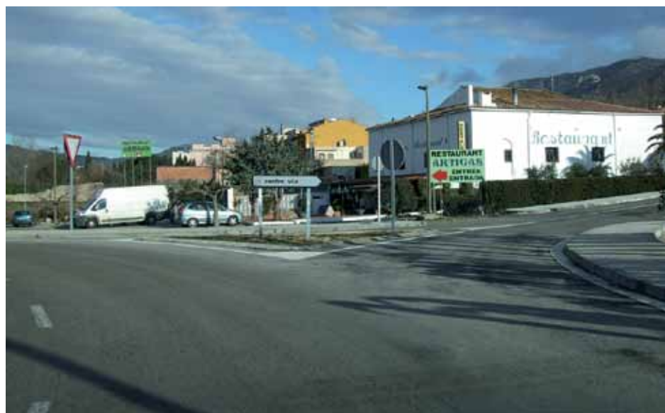
• Nou accés al casc urbà pel sector sud. La Jonquera incorpora dos accessos dignes gràcies a la nova obra