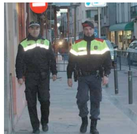
• Mosso d'Esquadra i Policia local pel carrer Major la setmana de Reis (Foto: ACN)

04/01/2012 Els Mossos d'Esquadra de la comissaria de Figueres i agents de la Policia Local de la Jonquera (Alt Empordà) van establir un intens dispositiu de seguretat coincidint amb l'època de compres de les festes de Nadal. L'objectiu va ser garantir la seguretat dels clients i els comerciants de la zona i se centrava en tres grans eixos, patrulles conjuntes, vigilància i consells de seguretat a comerços així com facilitar el poder presentar una denúncia per part del comerciant sense haver de deixar l'establiment. El patrutatge conjunt entre agents permetia recórrer els principals eixos comercials del poble amb una major presència policial que pogués dissuadir als possibles delinqüents o actuar amb rapidesa davant qualsevol acte il·lícit. Així, els agents visitaven els establiments amb freqüència per poder captar les inquietuds que poguessin tenir els seus propietaris. (Font: ACN)