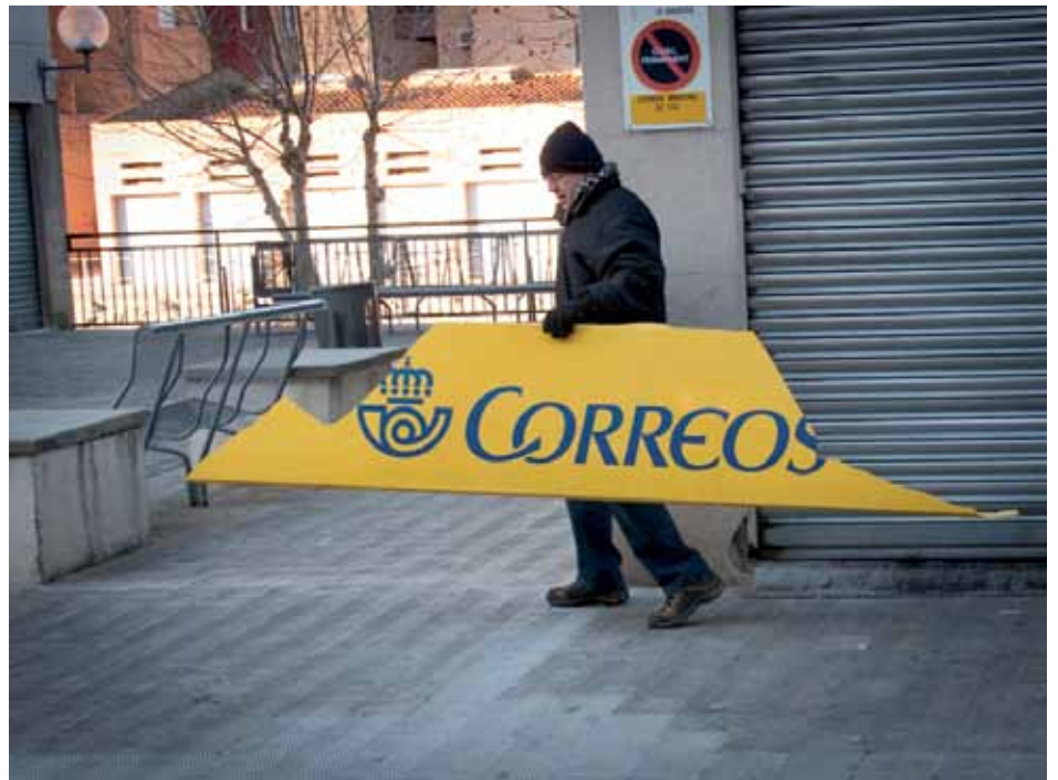
• La tramuntana molt intensa de la nit del 4 de febrer va provocar estralls en diversos punts de la Jonquera

quilòmetres per hora, una velocitat a la qual el vent comença a ser més molest. En el cas de la Jonquera bufa més dies per la presència del coll del Portús i Panissars, un accident geogràfic que converteix la vall del Llobregat d'Empordà en un canal de vent més constant i exposat que altres zones. Un dels episodis més violents es va viure la nit del 3 al 4 de febrer passat, quan la intensitat del vent va fer caure senyals de trànsit, rètols comercials, teules, faroles i antenes. Aquell dia, a més, la temperatura màxima d'1 i una mínima de -4°C van crear una temperatura de sensació de -20 °C.