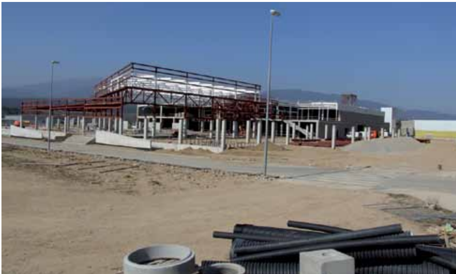
• L'edifici principal "Gran Jonquera" es troba en estat de construcció molt avançada i s'hi treballa acceleradament

realitat queda avalada per xifres: l'any 2009 més de 15.000 autobusos francesos van visitar la Jonquera per fer les seves compres i es calcula que el municipi rep un total de gairebé 7 milions de visitants anuals. Pel que fa al centre o edifici principal està previst que disposi de 12.000 m 2 d'espais comercials destinats a moda i complements, 2.000 m 2 de supermercats i 1.700 places d'aparcament en la seva primera fase. Tot i que no es concreta les xifres destinades a espais d'hostaleria és segur que hi haurà oferta de restaurant i buffet. Es tracta d'una inversió propera als cinquanta milions d'euros i la previsió és que es puguin acabar les obres el desembre de 2012 i condicionar els espais interns per obrir a la primavera del 2013. El complexe crearà prop de 250 llocs de treball.