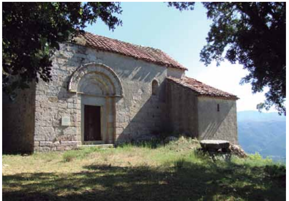
• Ermita de Sant Julià dels Torts, en una imatge d'arxiu

però per contra no consta així en el registre de la propietat. De moment el seu propietari legítim seria el Bisbat de Girona tot i que un "edictes" de l'any 1887 dona a entendre que el propietari és l'Ajuntament. L'edictes convoca a subhasta pública l'arrendament de les terres, la casa i el santuari, un fet que fa pensar que aleshores l'ermita ja era propietat de l'Ajuntament, i des d'aleshores no consta cap document de compra-venda. Finalment es va deixar sobre la taula el punt a l'espera de corregir els errors i presentar-lo més endavant.