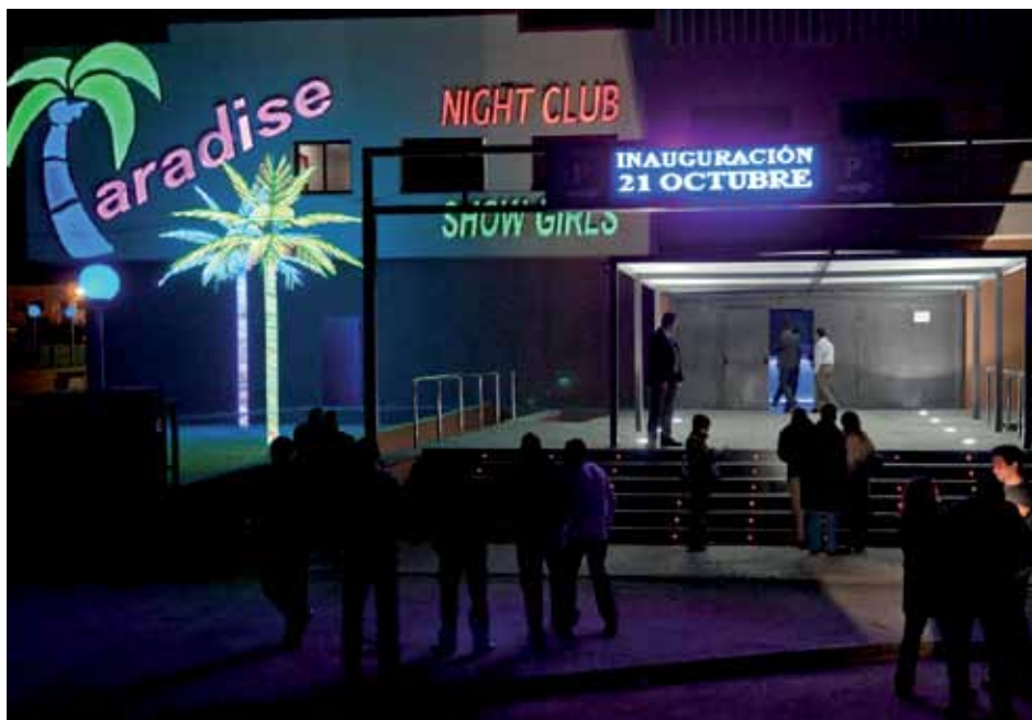
• El “Paradise” va obrir l'octubre de 2010 amb una llicència de local de concurrència pública on s'exerceix la prostitució. Ara també incorpora la llicència de pensió

De fet, l'octubre de 2010, en plena polèmica per la que aleshores era la imminent obertura del “Paradise”, el popular ja va demanar expressament que la normativa fos molt clara en el sentit de no permetre que en els prostíbuls Desiré i Paradise s'hi permetés la residència permanent. El regidor advertia que s'havia d'evitar que un cop acabada la “jornada laboral” de prostitució, les noies pernoctessin allà mateix. Per Botana la nova condició pot portar les noies a viure una situació similar a la d'una “presó”, segons va citar textualment i va posar com a prova les sancions que reben si arriben més tard de l'hora d'obertura al local.