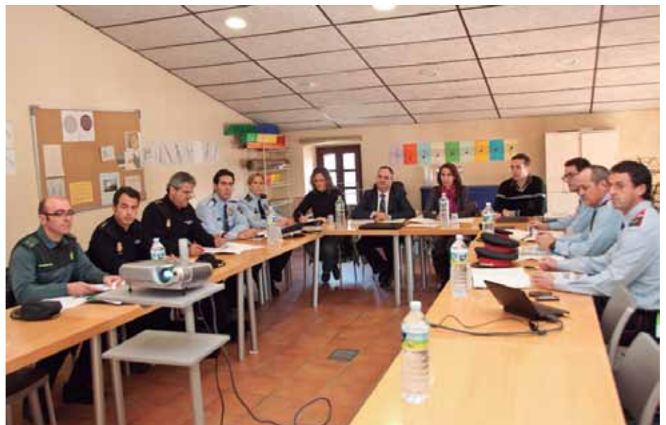
• Junta de Seguretat local de la Jonquera reunida el 20 de febrer a Can Laporta

Finalment es va parlar de la necessitat de gestionar les saturacions de trànsit que es produeixen a l'estiu, amb cues quilomètriques a la Nacional 2, l'AP7 i accessos al casc urbà. Un altre dels temes tractats va ser la necessitat de que la Jonquera s'adherís a la xarxa RESCAT, per fomentar la coordinació policial en casos d'emergència.