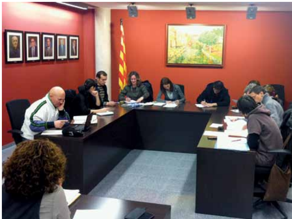
• Ple municipal del 23 de febrer de 2012

La moció, que recull l'oposició de l'Ajuntament a aquestes coaccions i que demana als responsables de les forces de l'Estat que vetllin perquè els fets no es tornin a produir, serà tramesa al Departament d'Interior i al Ministeri de l'Interior.