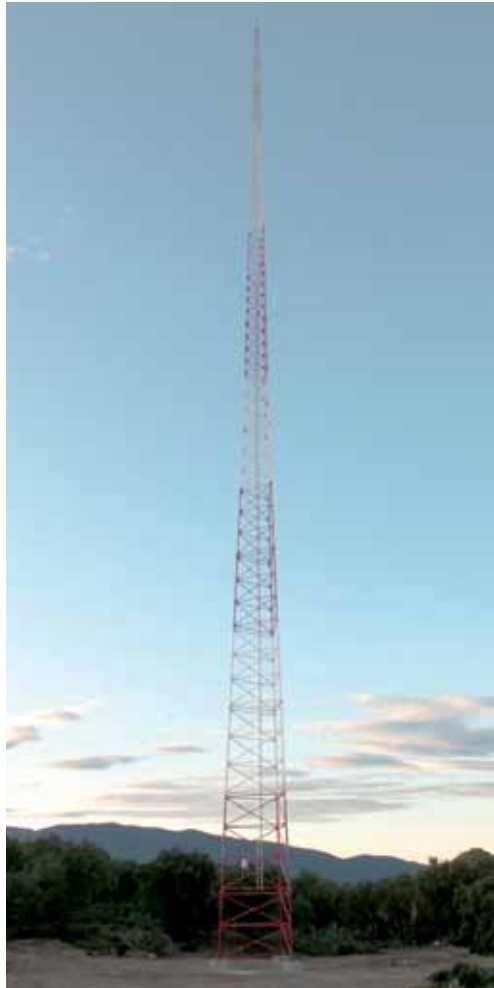
• Torre per mesurar el vent instal·lada a principis de gener a l'altiplà de Canadal

L'alcaldeessa va recordar que la posició del consistori sempre ha estat contrària als projectes plantejats des de fora el municipi per empreses com WindMaster i ho va contraposar, en certa manera, al Pla local de Molins que es va crear des de l'Ajuntament però que el Govern Tripartit de l'anterior legislatura a la Generalitat va desautoritzar per què no s'adaptava al mapa eòlic català. Martínez encara hi va afegir que el parc eòlic de Santa Julià té actualment tots els permi-