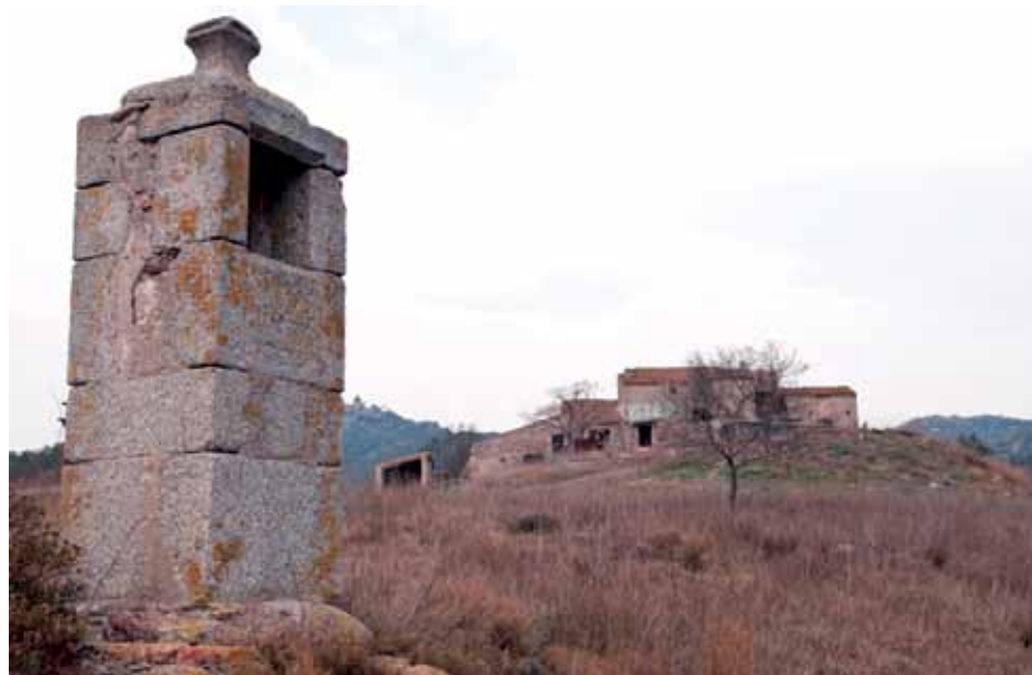
• A primer terme l'oratori de la Trinitat i al fons, dalt el turó, el mas de Sant Martí del Forn del vidre