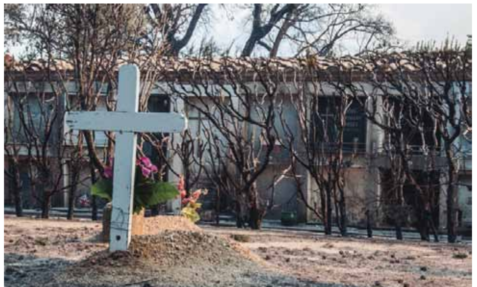
• Cementiri de la Jonquera

La casa de Colònies de Canadal ha hagut de cancel·lar tots els grups que tenia reservats per aquest estiu i fins l'any que ve que pugui tornar a obrir són 1.729 places perdudes.