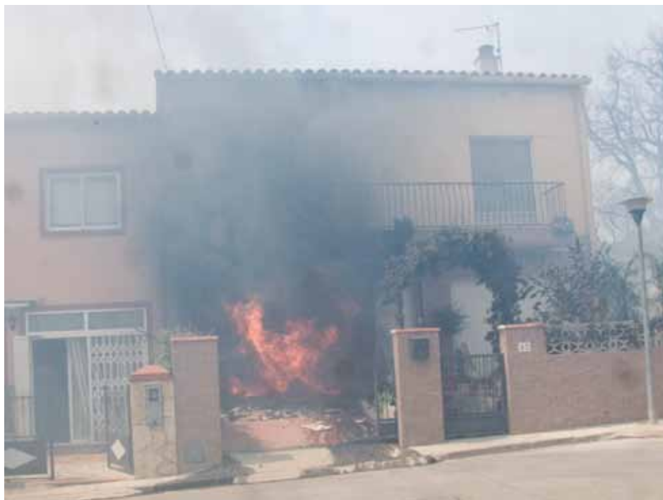
• El foc riba al carrer Vallespir i Prat d'en Malagrava. Una vivenda i el cotxe resulten greument afectats

forestal. S'envia els afectats al pavelló municipal. El foc avança imparable, a la zona oriental amenaça directament el carrer Vallespir i la urbanització del Prat d'en Malagrava. Per l'occidental ja arriba a la riera dels Querols.