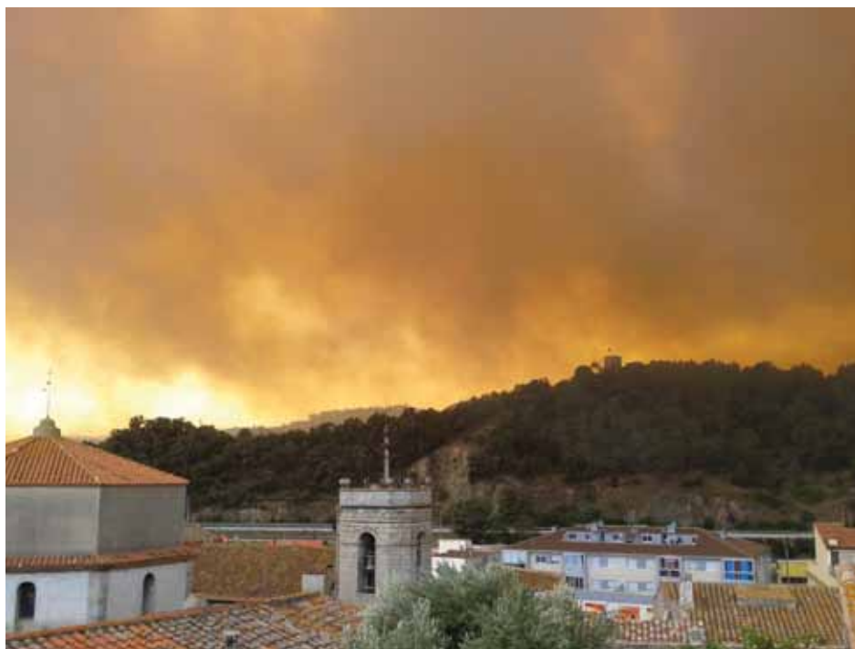
• Núvol de cendra i tramuntana sobre la Jonquera i el Serrat de la Plaça