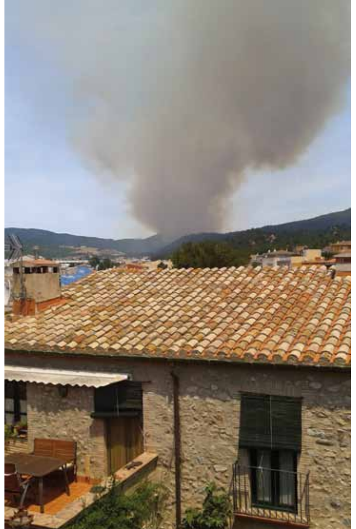
• Castell de fum sobre la Jonquera en la fase inicial de l'incendi (Marta Salellas)