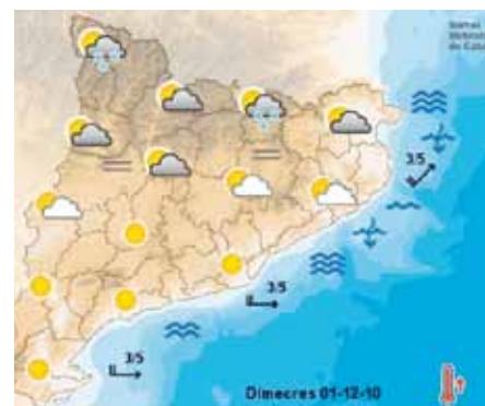
DADES DE LA JONQUERA EN DIRECTE A:

Temperatura màxima absoluta: 34,6 °C Temperatura mínima absoluta: 14,2 °C Mitjana del mes: Cop de vent màxim en km/h: 69,1 Pluja recollida en litres: 11,6