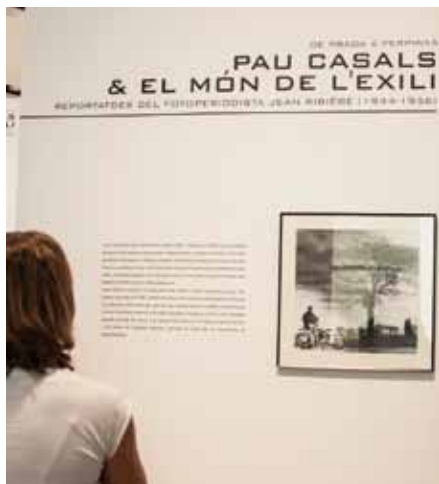
• L'exposició al MUME el dia de inauguració