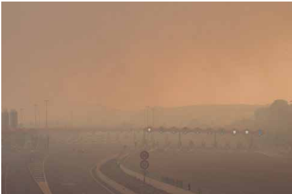
• El foc rriba al carrer Vallespir i Prat d'en malagava. Una vivenda i el cotxe resulten greument afectats

vions més de la Generalitat, cinc mitjans francesos i el govern espanyol envia tres mitjans aeris per col·laborar. S'obre al trànsit l'AP7 sentit nord. L'N2 està tallada en tots dos sentits.