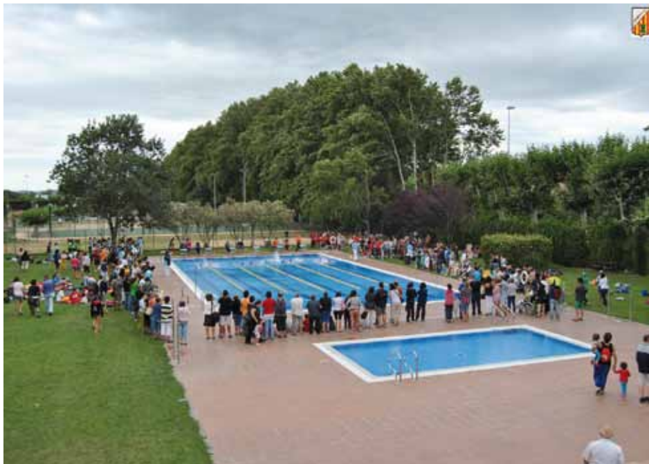
• Piscina municipal de la Jonquera el passat dissabte 14 de juliol quan es disputava la Copa Pirineus de Natació

d'ells, pujant així un grau en la classificació de la jornada. El primer classificat continua sent el Castellfollit però la Jonquera va poder superar el Besalú, només per uns pocs punts. Així doncs ara mateix la classificació general queda d'aquesta manera: C.N. CASTELLFOLLIT 1.098 BESALÚ C.N. 928 A.C.E.J.LA JONQUERA 816 C.P. Santjoanenc 618 C.P. FLAÇÀ 424 C.N. FARNERS 486