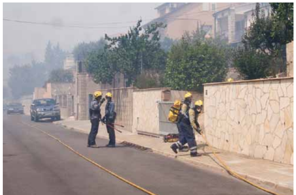
• Bombers i ADF actuant al carrer Vallespir