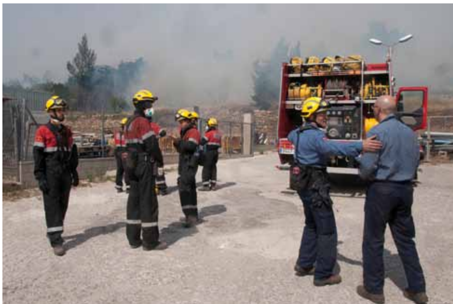
• Bombers al parc de bombers de la Jonquera