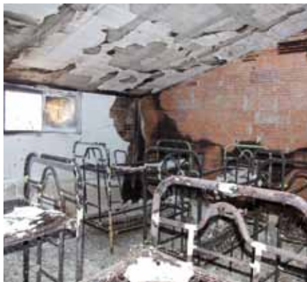
• Casa de Colònies de Canadal (Infojonquera.cat)