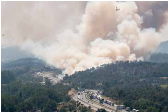
• L'incendi revifa al sud de la Jonquera i Agullana el 23 de juliol