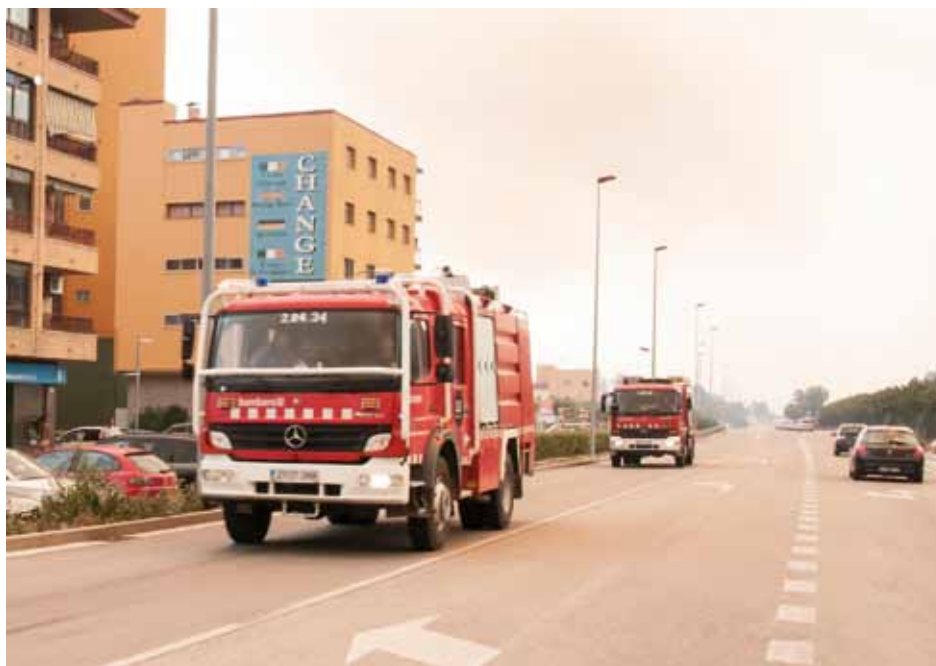
• Camions de bombers de diferents parcs de Catalunya es dirigeixen cap al Portús

A la zona est de Capmany etc, hi vam deixar menys efectius perquè la zona oest, a un costat i a un altre del pantà, en no haver cremat mai, comportava més risc, perquè hi ha més massa forestal i és una zona de més