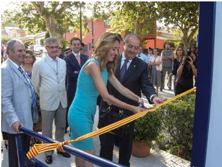
• Inauguració de l'oficina de Mossos d'Esquadra a la Jonquera el 30 de juliol