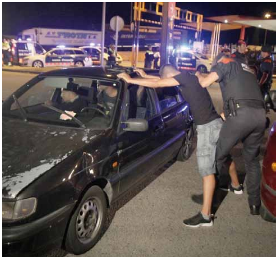
• Control de Mossos d'Esquadra, Policia local i Policia estatal a la zona sud de la Jonquera

fent absolutament res relacionat amb la seva professió”, ja que anava de festa per l'Alt Empordà amb dos amics. Li van requerir que el pròxim cop deixés “tots els estris a casa o al taller” i també van comissar una navalla plegable que el copilot duia en una bossa.