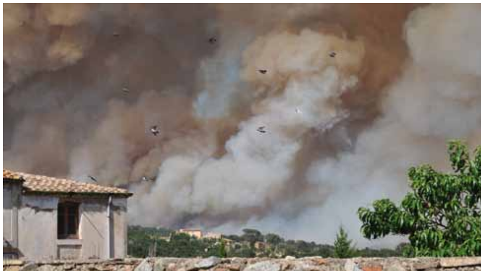
• A primer terme el casc urbà d'Agullana. Al centre el Mas Mallol i al fons la columna de fum del foc a la Jonquera