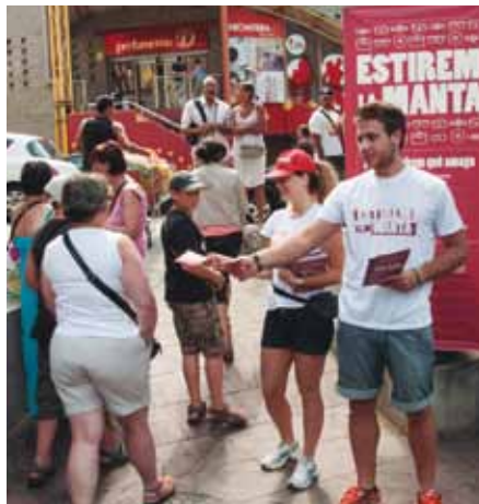
• Posada en marxa al Portús de la campanya “Estirem de la manta”

El dissabte 21 de juliol va començar al Portús la campanya del top manta. A l'acte hi van ser presents autoritats catalanes, representants de les associacions de comerç del municipi i diversos cossos policials.