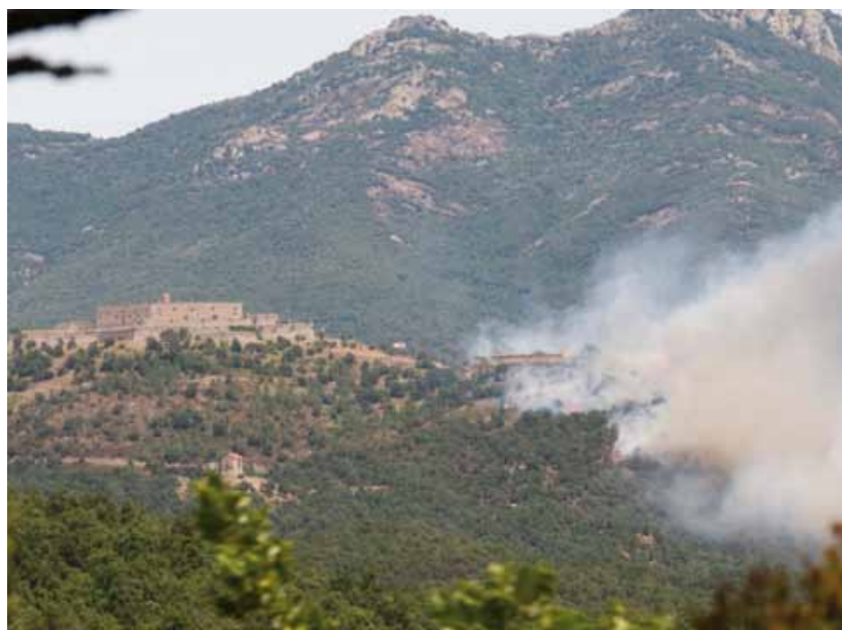
• Fase inicial de l'incendi, a tocar del Fort de Ballaugarda

gar (segons les investigacions), no hi ha res a dir més enllà d'enrabiarse i lamentar-se per la poca educació, sensibilitat i la molta irresponsabilitat d'una conducta encara molt freqüent per part d'una part minoritària de la societat.