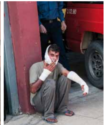
• El fum no deixava respirar i amb prou feina deixava veure més enllà dels 50 metres al carrer Prat d'en Malagrava. Primers ferits i intoxicats pel foc i el fum