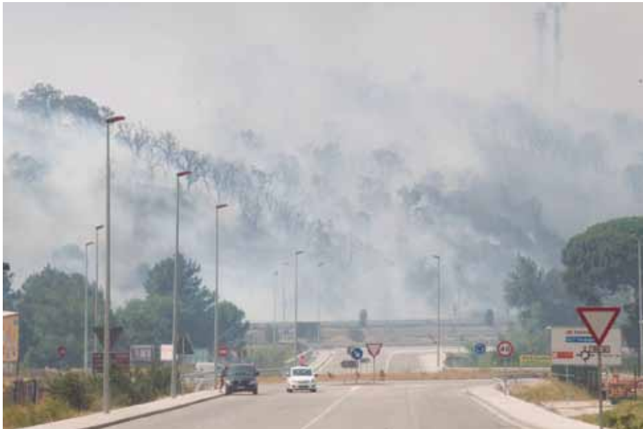
• El foc ha passat a gran velocitat perr la zona del cementiri deixant un rastre de fum, cendres i un bosc calcinat

de Catalunya Santi Vila inicia una polèmica al vincular el model de negoci del comerç jonquerenc amb l'inici del foc.