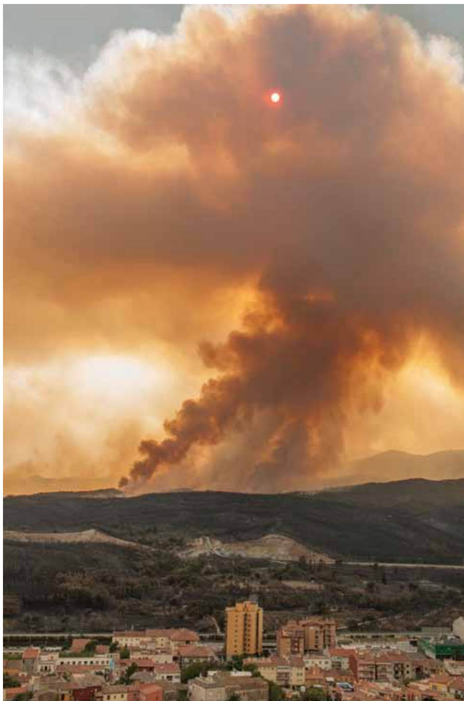
• La tarda del dilluns 23 de juliol l'incendi prenia una direcció de sud a nord i remontava cap a Santa Eugènia, a Agullana

Sobre l'origen del foc, una burilla sense apa-