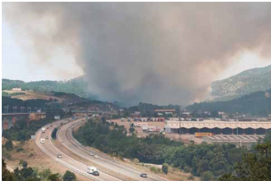
• El foc avança amb celeritat cap al casc urbà de la Jonquera. La columna de fum ja és monumental

13.45 h. - El foc ja remonta pel còrrec del Mas Brugat i Mas Pobre. Avança amb gran celeritat amb un front central per la zona del riu Llobregat. Es mobilitzen els membres del servei de Protecció Civil de la