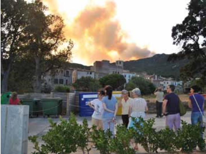
• Veïns de Cantallops concentrats als afores del poble (M. Serrano)