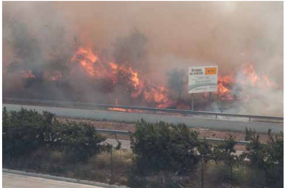
• El foc arrasa el bosc del serrat de la plaça, a l'alçada del carrer Mateu Pla cruïlla amb l'N2