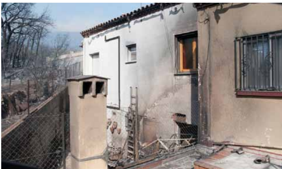
• Zona de patis del darrere de les vivendes afectades pel foc als carrers Vallespir i Prat d'en Malagrava

> La natura rebrotarà, més vella, més cansada, però ho farà davant dels ulls dels que la vulguin veure. <