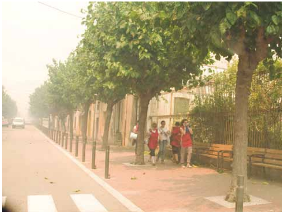
• El fum feia l'ambient irrespirable. En els carrers més perifèrics es viuen moments de pànic

18.00 h - Es té coneixement que hi ha un ferit greu a Agullana-L'Estrada, un ciutadà francès amb el 90% del cos cremat. Es calcula ja en 8.000 les hectàrees que han quedat calcinades