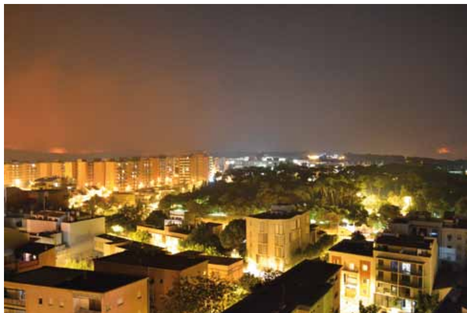
• L'incendi iniciat a la Jonquera s'expandida ja de nit al nord de l'Alt Empordà. Figueres a primer terme i el foc al fons (Miquel Cruañas)