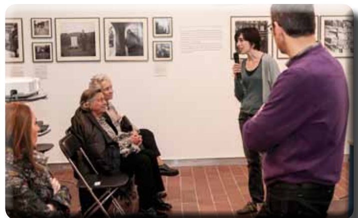
• Assistència massiva al passi del documental "Conxita Badia no existeix" al MUME, el 27 de gener. A l'acabar, un col·loqui va permetre ampliar el coneixement d'aquesta història amb vincles jonquerencs.