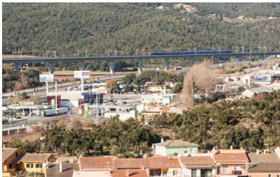
• Un TGV procedent de Perpinyà circula pel viaducte de l'alta velocitat a la Jonquera