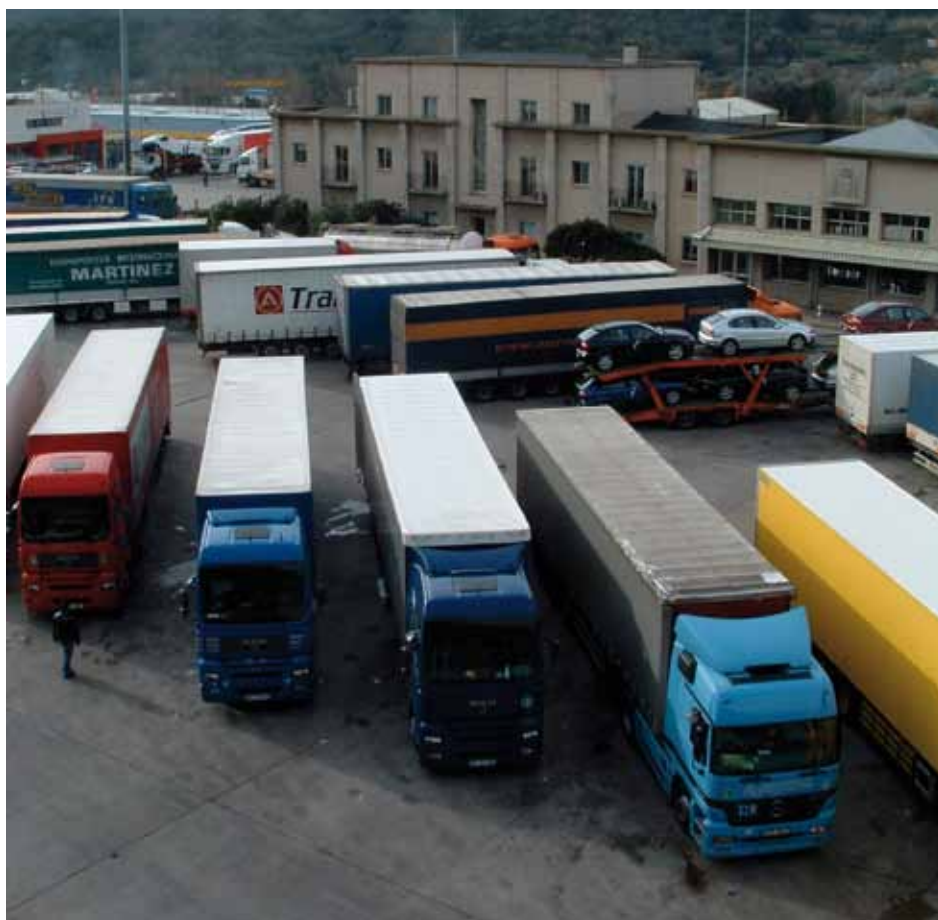
• Zona de la duana en una imatge d'arxiu que correspon a l'any 2004

Poc a poc, la situació començaria a remuntar i al final la Jonquera encara en va sortir reforçada. ■