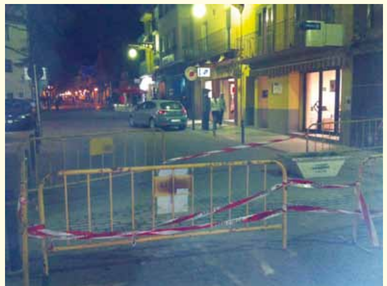
Unes obres de connexió al carrer Major van provocar un cert "caos" al vial que travessa la gasolinera GALP

A mitjans de gener el carrer Major va quedar tancat dos dies per unes obres de connexió a la xarxa de clavegueram. Aquest fet va obligar que els vehicles que circulaven per aquest carrer en direcció nord haguessin de baixar cap al riu a l'alçada del número 77, direcció carrer del Rec, travessar el riu i recular pel carrer Llobregat fins anar a buscar el carrer del Pont. En aquest punt calia travessar, pel mig, la gasolinera GALP i anar a buscar l'enllaç cap a la N2 o el carrer Jesús Mercader. Prou complicat... no? El cas però és que per als clients de la gasolinera no hi ha cap senyal que els indiqui que entre les dues marquesines hi ha un carrer. Això fa que s'incorporin sense gaires miraments. Costaria molt posar-hi un senyal per cedir el pas? Per què els qui acabaven fent un Stop eren els vehicles que provenien del carrer Major?