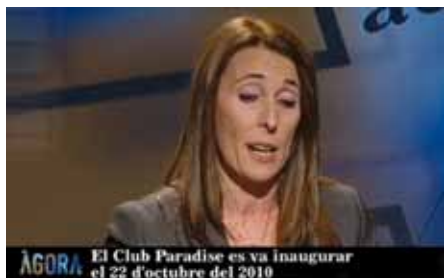
• Captura de pantalla del programa de TV3 "Àgora"