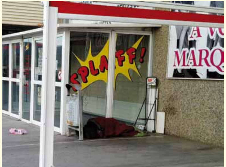
Una dona dorm des de fa dies en diferents racons del polígon Mas Morató.

Així passa els dies, un dia sí, i un altre també. I la pregunta que es fan els propietaris de la zona, clients, visitants o desconeguts que la veuen és: i per què tenim els serveis socials? Pot ser que no en sàpiguen res?