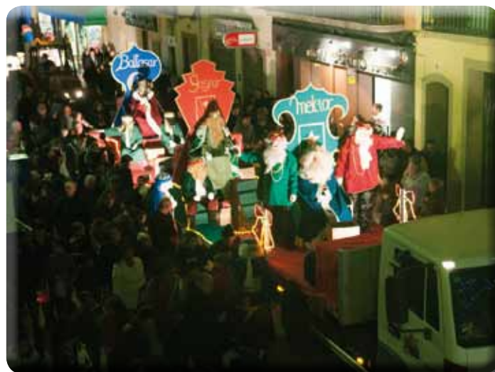
• La Cabalgada va reunir un bon seguici i molt de públic al llarg de tot el carrer Major