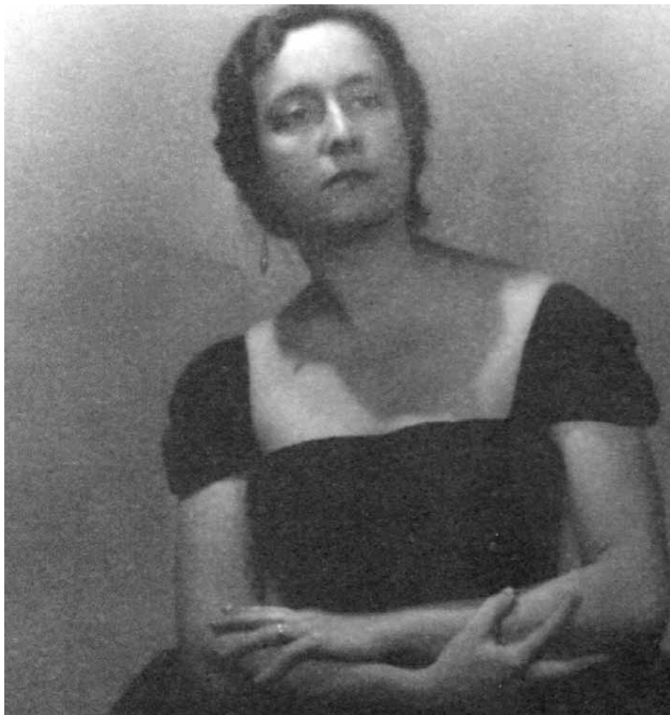
• Conxita Badia al Gran Teatre del Liceu, 1935

“Conxita Badia no existeix” és el llargmetratge debut de la directora, productora i guionista Eulàlia Domènech. Un documental ambiciós i de qualitat, fruit d'un treball exhaustiu teixit de forma sòbria i elegant a partir del poc material disponible. Cada testimoni, cada recerca, cada gest del documental, descobreix una emotivitat i una veneració ben justificades cap a la figura de Conxita Badia. La superposició constant de dues veus, la de la primera persona que busca, i la de la veu retrobada de Conxita Badia que ressuscita d'antigues gravacions, fa sorgir un intens i emotiu diàleg entre present i passat, entre record i oblit. El documental és un exitós exercici per posar veu a la memòria, la memòria de la que fou una veu excepcional i una font d'inspiració inesgotable.