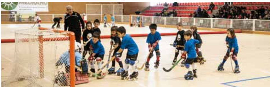
• Partits d'hoquei entre les diferents escoles participants (J. Ribas)

En l'acte protocolari de lliurament de diplomes a tots els participants, el Club Patí Jonquerenc va fer entrega d'una placa en record d'aquesta diada a l'Hoquei Banyoles, club format recentment i que estrenava la seva activitat en aquesta trobada a la Jonquera.