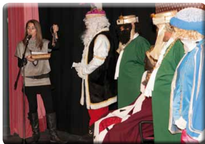
• Entrega de les claus de la vila a ses Majestats Els Reis de l'Orient