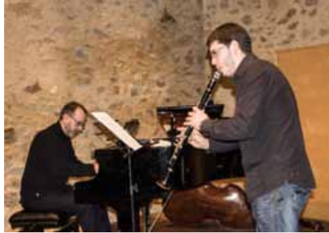
• Concert a Can Laporta el 13 de gener

El diumenge 13 de gener la Jonquera va acollir el 2n Concert del Festival “Fem Música”. Aquest esdeveniment comptava amb la participació de diverses escoles de música de l'Alt Empordà i es va celebrar als Porxos de Can Laporta. El ple de la sala pert part del públic va ser total i la qualitat del concert va ser d'un gran nivell. L'esdeveniment va ser organitzat per l'Escola de Música de la Jonquera i va comptar amb la participació activa i coorganitzadora de les escoles La Flauta Màgica, Temps de Música i Pep Ventura de Figueres, El Gavià de L'Escala, l'Escola de Música de Castelló d'Empúries, Tons de Llança, Bufaventfort de Cadaqués i els Paratges Nacio-