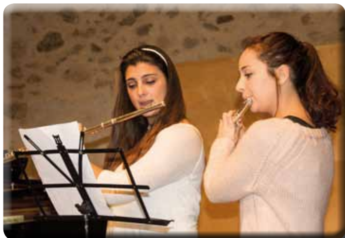
• Segon concert del Festival "Fem Música" a Can Laporta el 13 de gener. Grans i petits van oferir un concert d'alt nivell en uns porxos que van quedar petits