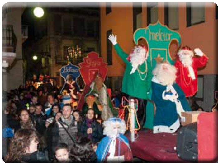
• Cabalgada dels Reis pel carrer Major, just després de travessar la Plaça de l'Ajuntament