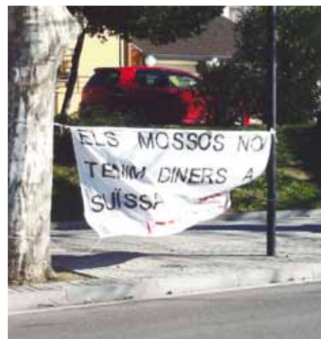
• Esquerra: Comissaria provisional del Mossos d'Esquadra a la Jonquera. Dreta: Una unitat de patrullatge de la Guàrdia Civil torna a les oficines. Pancarta de protesta