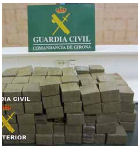
• Esquerra: Imatge d'arxiu en una actuació conjunta de Policia local i Mossos. Dreta: Haixix intervingut el 27 de gener