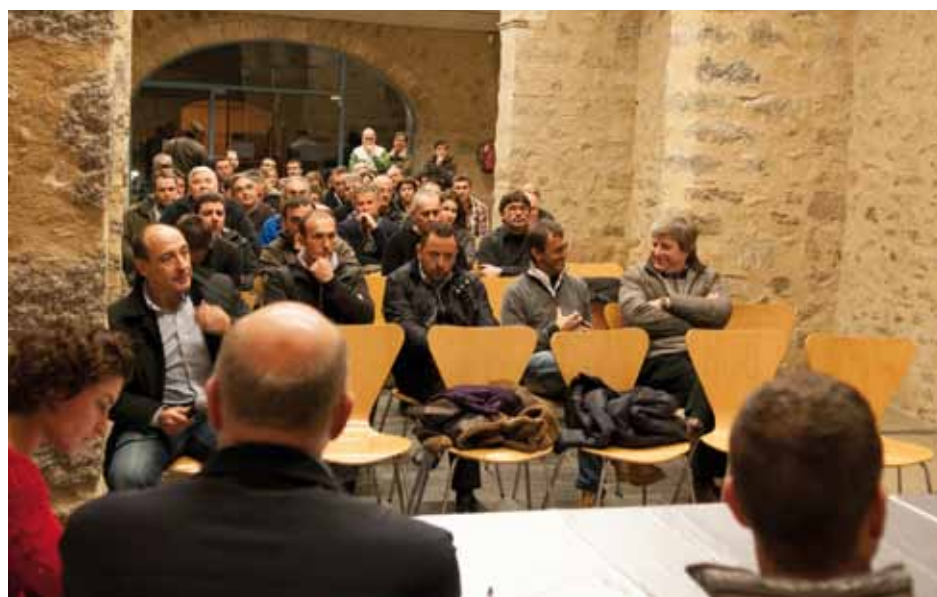
• Reunió de comerciants i empresaris de la Jonquera i el Portús a Can Laporta (J. Ribas)

“prostitució al carrer” i la “venda ambulat” o de les “falsificacions”. Com a paradoxa de tot plegat es va qüestionar el paper de les diferents policies, considerant que els límits competencials o la politització dels cossos de seguretat repercuteixen que sovint un delictes no sigui perseguit degudament, o no sigui prioritari, o bé que per falta de recursos d'un cos policial no pugui ser assumit per un