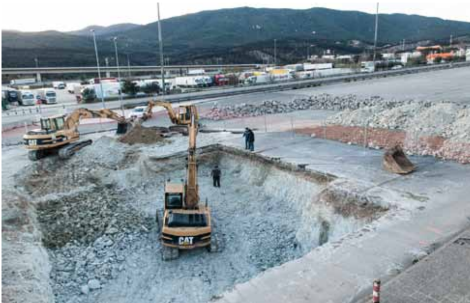
• Aquesta setmana han començat les obres del nou aparcament a la zona de l'antiga campa d'exportació de la duana (J. Ribas)

La construcció d'aquest nou equipament permetrà millorar la zona tant des del punt de vista urbà com el de la imatge i la seguretat, actualment deteriorada per la presència de prostitutes i un entorn degradat pel pas del temps.