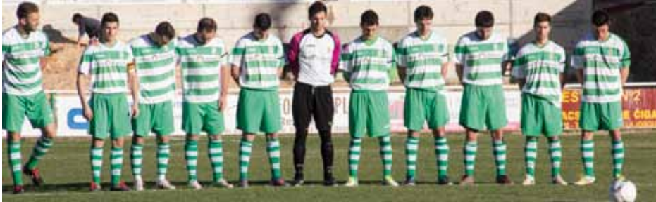
• Tots els jugadors de la UE la Jonquera (Primera Catalana) van lluir un braçal negre en el partit contra el Farners (J. Ribas)

un braçal negre. Ho van fer en memòria del pare del coordinador del futbol base del club, mort sobtadament el 15 de gener.