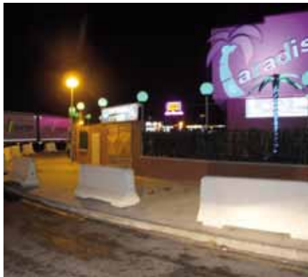
• L'entorn del "Paradise", amb noves tanques de seguretat