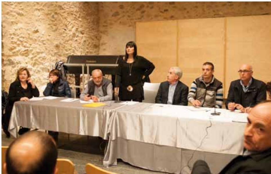
• La taula presidencial estava formada per empresaris i comerciantst de la Jonquera i el Portús

Finalment els comerciants van assumir l'objectiu de potenciar l'associació per tal de refundar-se i constituir-se en una veritable associació de pes, que pugui ser una interlocutora vàlida amb les administracions o que en determinats casos pugui erigir-se com un grup de pressió en defensa del bon nom de la Jonquera i les seves activitats econòmiques. Per tractar aquest darrer punt els organitzadors estan tenint noves reunions de treball, en les quals es posaran les bases per a un projecte que es considera vital, professional i unitari per fer front al futur més immediat. ■