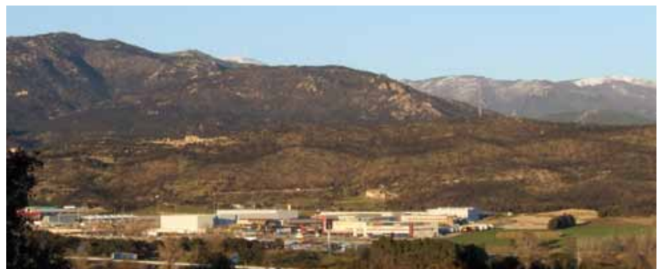
• La Jonquera a primer terme amb el Puig Neulós i el Puig dels Pastors al fons ben nevats el 17 de gener de 2013

Pel que fa a la pluja s'han recollit 20,8 litres/m², una xifra baixa només superada a la baixa pel gener de 2007 (1,4 l/m²) i el gener de 2012 (16,8 l/m²).