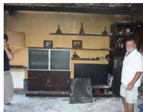
• A l'esquerra, la finestra del garatge per on va entrar el foc. A la dreta, una imatge general del menjador