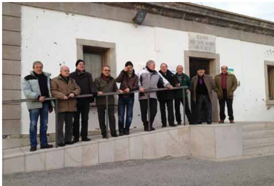
• Els membres de la Cobla Vila de la Jonquera al far del Cap de Creus l'1 de gener

La Cobla Vila de la Jonquera va ser fundada l'any 2001 i ara fa un any, el gener de 2012, va gravar el seu cinquè CD musical que porta per nom "Deu anys de sardanes". La cobla ha portat el nom de la capital de l'Albera a arreu del país, fent una difusió musical i positiva del nom de la Jonquera, la música catalana i les sardanes amb el "segell" de la cobla.