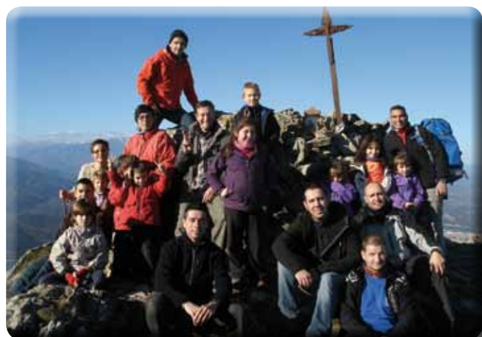
• Portada del pessebre al Pic de Sant Cristau per part del CEJ