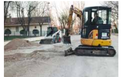
• Obres a la plaça de la Llar d'Infants "Terra de Vents" (J. Ribas)

L'Ajuntament de la Jonquera ha començat les obres a la plaça de la Llar d'infants. Les obres es van aprovar el mes d'octubre de 2012 i s'han iniciat aquest mes de gener. L'actuació disposa d'un pressupost de 57.000 € i l'Ajuntament té concedida una subvenció de 36.000 € de la Diputació de Girona. Amb aquesta assignació els serveis tècnics del consistori han redactat una reforma que inclou el sistema de rec automàtic dels jardins del recinte i un condicionament de l'aparcament paral·lel al riu. Tot i tractar-se d'un espai inundable en el POUM és compatible com a zona d'estacionaments.