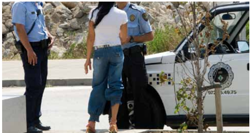
• La Policia Local informa a una prostituta de les normatives locals