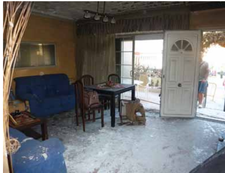
• A l'esquerra, el cotxe calcinat dins el garatge. A la dreta el menjador, la porta corredissa i la porta principal que donen accés al pati des del menjador