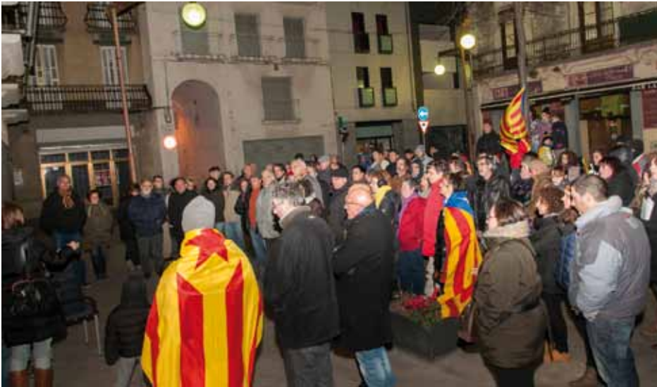
• Concentració davant l'Ajuntament de la Jonquera la vesprada del 23 de gener de 2013 (J. Ribas)

Durant la concentració els participants van cantar i recordar alguns dels lemes de la manifestació de l'11 de setembre de 2012: "Què vol aquesta tropa? Un nou estat d'Europa. Què vol aquesta gent? Catalunya independent". Van aplaudir amb entusiasme el manifest i els parlaments mentre els més petits feien onejar les estelades al vent de Tramuntana. Entre els participants hi havia un bon nombre de nord-catalans, una cinquantena, que havien estat convocats per Catalunya Nord Per la independència que es va sumar a aquesta crida, i van convidar els seus simpatitzants a fer-ho davant l'ajuntament de la Jonquera, segons el comunicat "junts amb els d'aquest poble proper i germà".