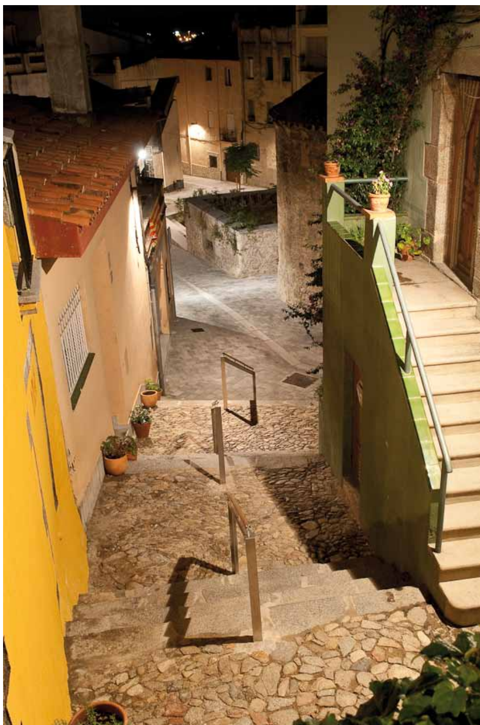
• Escales al carrer de la Torre

(≡) ACPC Associació Catalana de la Premsa Comarcal