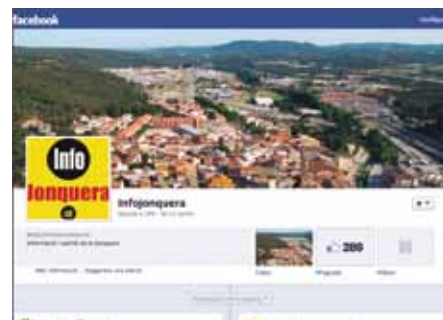
• Captura de pantalla del canal d'Infojonquera a Facebook

els darrers tres mesos. En el cas de Facebook li falta molt poc per arribar als 300, una xifra que en cas d'assolir-se suposaria arribar al 10% de la població de la Jonquera, o vist des d'una altra perspectiva es podria dir que el 10% dels jonquerencs ja s'estan relacionat via xarxes socials.