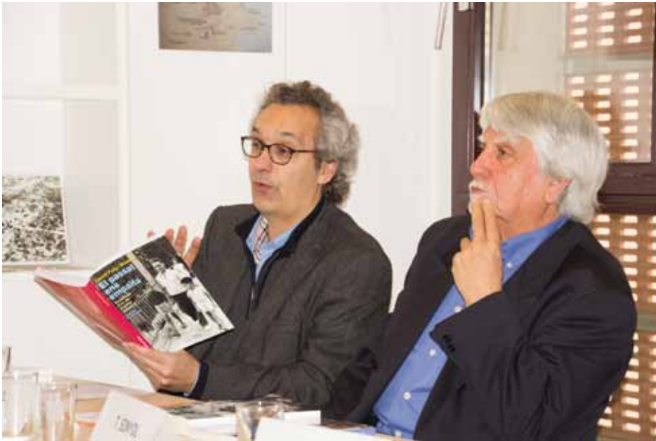
Acte de presentació del llibre al MUME aquest passat dissabte