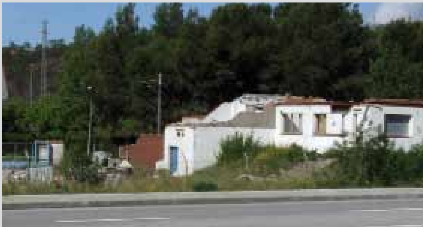
• Parcel·la abandonada i enrunada al costat de la zona esportiva i la N-II

Que les prostitutes són un dels elements identificatius de la Jonquera dels darrers deu anys és ja un fet incontestable. Una realitat enquistada que ningú, absolutament ningú amb un criteri objectiu i gens romàntic, pot negar. Ara bé, de la mala imatge que donem de la Jonquera als qui transiten per la N-II, no només en tenen la culpa les noies. De les parcel·les abandonades i els edificis mig enrunats que hi ha a la zona de la piscina, i perfectament visibles des de la carretera, no n'hem de dir res? Quant temps fa que està així de deixat i abandonat? Doncs en tenim la resposta: com a mínim del gener de 2011!