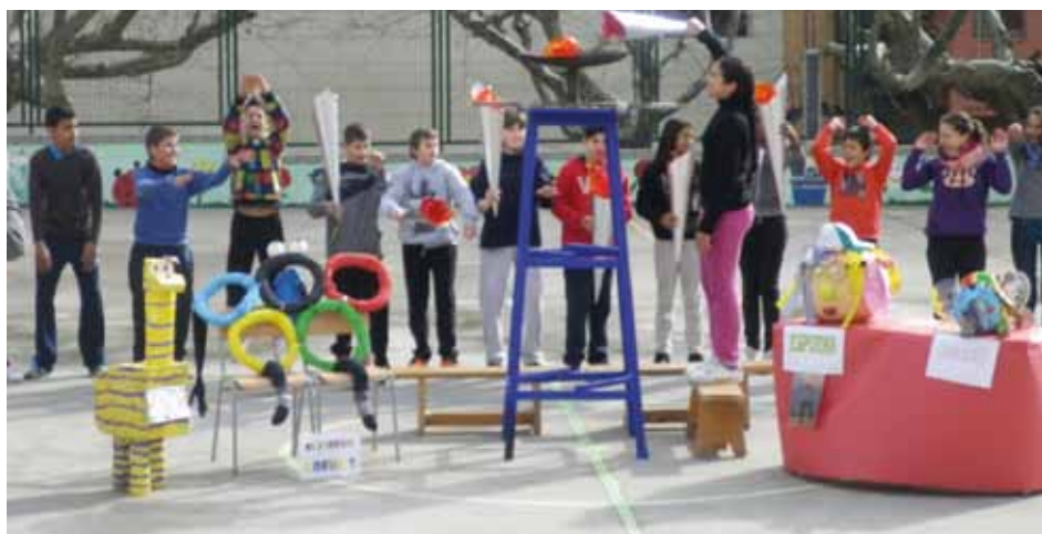
• Encenent el pebeter al pati de l'escola (Escola J.P.)