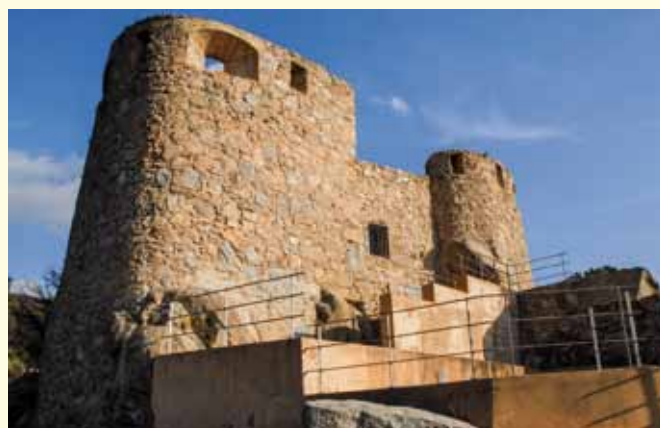
Refugi de Carmanxel en una imatge recent

Informació de les últimes activitats realitzades pel Centre Excursionista Jonquerenc (CEJ). S'hi inclouen activitats físiques i calendari d'actuacions de l'entitat.