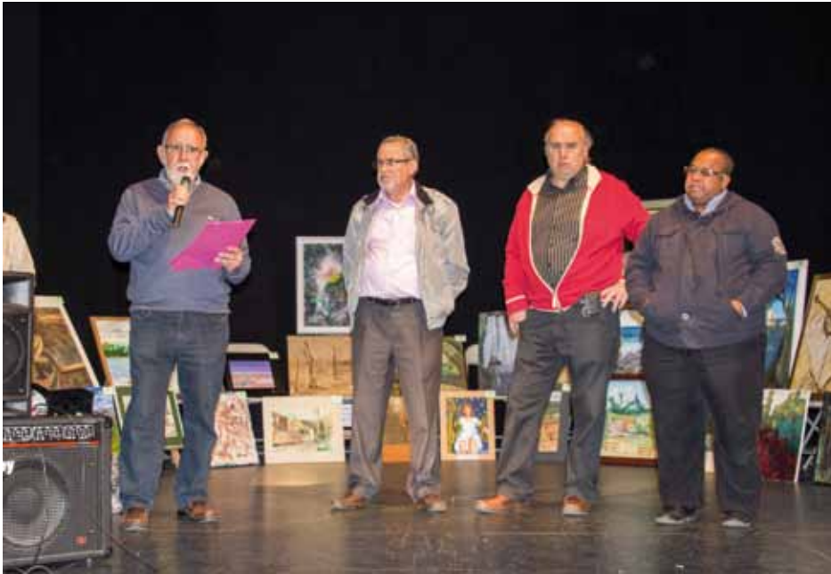
• Sorteig organitzat per l'Associació Amics de Santa Maria diumenge 21 d'abril

> El sorteig forma part de la campanya dels Amics de Santa Maria per reformar l'església