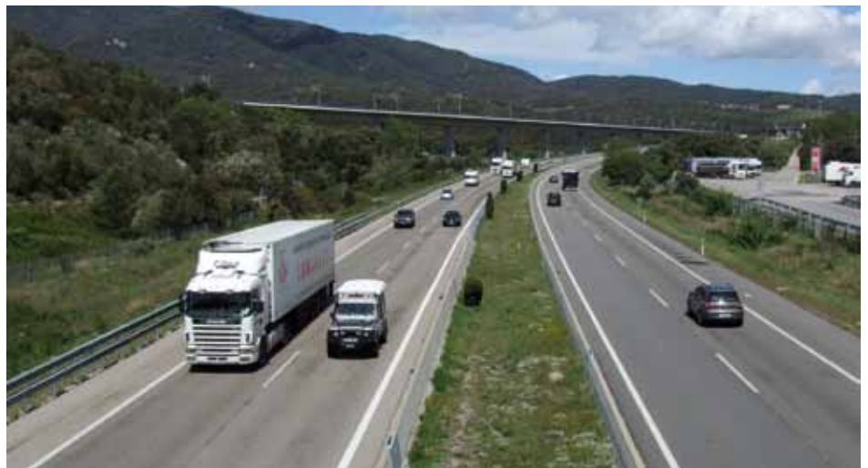
• Camions circulant per l'AP-7

Segons dades de l'any 2012, la Intensitat Mitjana Diària (IMD) de camions pel tram gironí de la N-II és de 3.842 vehicles pesants, dels quals s'estima que un 93% són de la categoria de 4 eixos o més. Es considera que una petita part d'aquest trànsit (uns 700 vehicles diaris) és local o d'agitació, per la qual cosa la xifra estimada de camions de quatre eixos o més que es desviaran de la N-II és de 2.850. ■