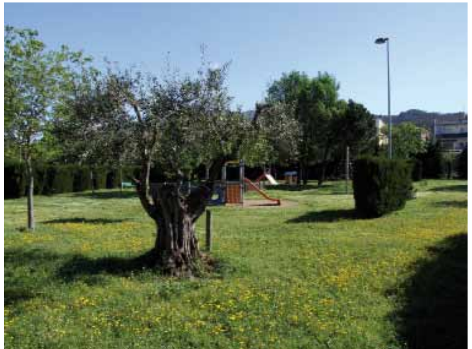
• El Parc d'en Lloveres llueix un verd intens als arbres i el terra és ple de flors i gespa

Si el mes passat la fotografia del mes havia de ser forçosament relacionada amb l'aigua, i per tant a discutir entre el Salt del Fitó o els Estanys, aquest mes l'element a destacar havia de ser una foto que transmetés verd. Hem optat per un espai dins el casc urbà. ■