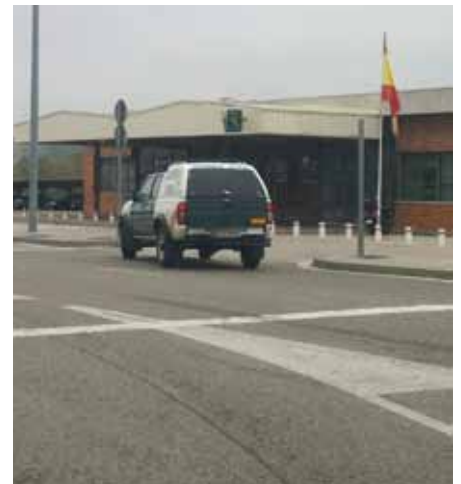
• Un vehicle de la Guàrdia Civil torna a la caserna