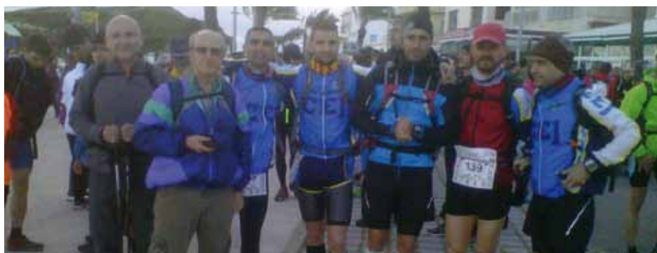
• Jonquerencs a la Marxa de Resistència de Llançà

La Marxa dels dòlmens arriba al seu trentè aniversari. El recorregut és de 13,5 Km. i durant el trajecte es poden observar diferents dòlmens i menhirs de la Jonquera i Capmany. La marxa dels dòlmens és la més antiga de l'Empordà i es celebra el tercer diumenge del mes de maig, que en aquest 2013 coincideix amb les Festes de Pasqua de la Pentecosta. ■