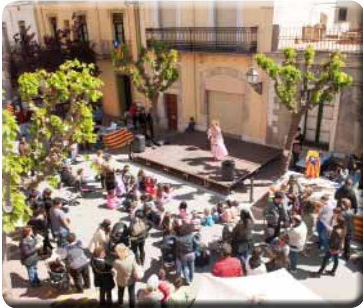
• Celebració de la Diada de Sant Jordi al carrer Major de la Jonquera