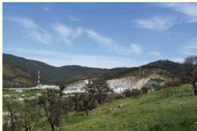
• Al fons i centre de la imatge, el coll de Panissars (Infojonquera.cat)

Des del pas pels Pirineus dels soldats cartaginesos d'Annibal camí de Roma l'any 218 aC, que acampen a Il·liberis (Elna) i degut a la proximitat de l'Albera, és segur que una part del nombrós exèrcit cartaginès va passar pel coll de Panissars, coll del Portús i possiblement també pels colls de la Massana i de Banyuls. Aquest espai pirinenc occidental es va convertir en època romana en una important zona de pas.