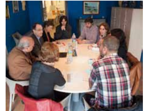
• Taula de treball amb representants locals d'ensenyament i l'Ajuntament