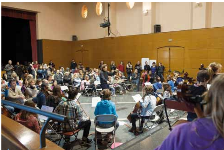
Concert dels violoncel·listes a la Sala-Teatre de la Unió Jonquerenca

Els participants a la trobada preparen, amb l'ajuda d'una desena de professors, les peces que es tocaran al concert de l'últim dia.