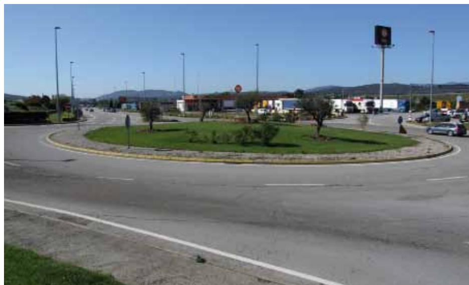
• Una imatge actual de la rotonda dels bombers. Deu anys després el verd predomina sobre el negre i el color terra