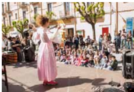
• Ambient al carrer Major a la diada de Sant Jordi

Durant tot el dia hi van haver parades de llibres i roses al carrer Major, al migdia hi va haver espectacle infantil al mateix carrer i a la tarda es van ballar sardanes amb la Cobla Vila de la Jonquera.