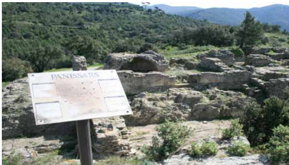
• Vista general del coll de Panissars (J. Cabezas)

efectuats s'ha determinat que corresponen al trofeu gegantí que féu bastir el general Pompeu l'any 71 aC, en retornar vencedor d'Hispania, dels exèrcits de Sertori.