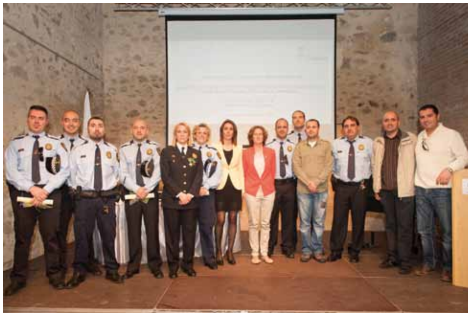
• Fotografia de grup dels protagonistes que han rebut reconeixement a la Festa de la Policia local de la Jonquera

drogues i venda ambulants- després que el desembre passat la Jonquera fos notícia arran dels atacs contra el macroprostíbul Paradise per part d'uns desconeguts. Des de llavors que el comerç, els empresaris i l'Ajuntament treballen conjuntament amb les forces de seguretat i el Departament d'Interior per consensuar un paquet de mesures. Entre elles, hi ha sobre la taula posar càmeres a la N-II a peu de carretera, aparcaments i polígons. Fins que no estigui el pla detallat, no se sabrà el pressupost que requerirà i com es finançarà, ja sigui des de les administracions com del sector privat. ■