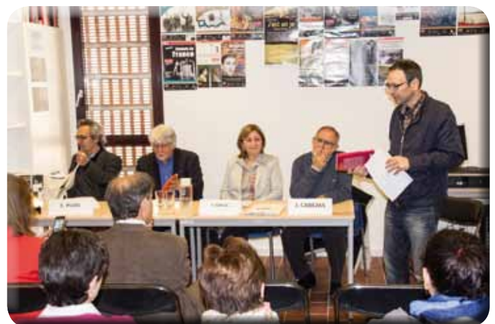
• Acte de presentació del llibre "El passat ens empaita. Vicissituds d'un fill d'exiliat republicà"