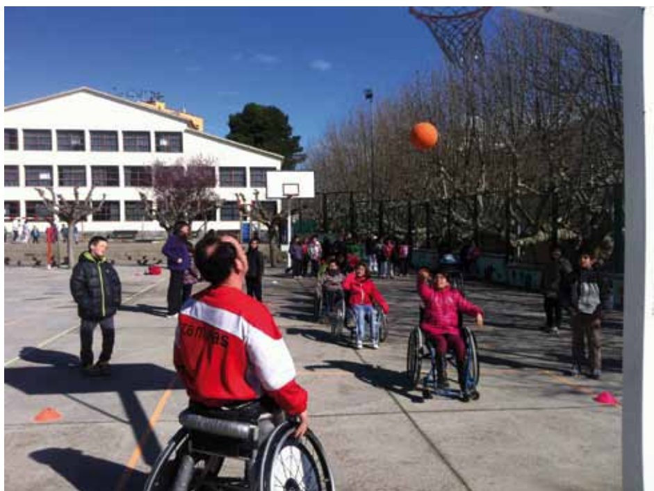
• Realització de proves amb limitacions (Escola J.P.)

atès els alumnes, a més de gaudir de valent fent esports que no es solen treballar a Educació Física (com ara rugbi, hoquei o salt d'alçada), van poder comprovar en primera persona com, amb molt poc pressupost, es poden realitzar activitats de grup altament educatives i saludables.