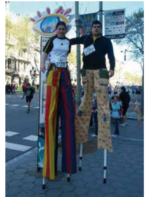
• Els Xanquers de l'Albera, de la Jonquera, a la cursa del Corte Inglés de Barcelona

(Informació ampliada a Infojonquera.cat - Veure notícies del dia 17 d'abril).