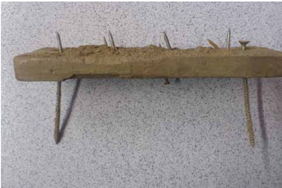
• La trampa trobada al corriol de Santa Llúcia

El corriol de Santa Llúcia és un dels espais habituals que fan servir molts veïns de la vila per passejar, caminar o fer esport i per tant és habitual que amb l'arribada del bon temps aquest corriol, i altres que se'n deriven, sigui freqüentat per persones de la zona. Hi ha la sospita, però, que els claus no estiguessin adreçats precisament a les persones, sinó més aviat a altres usuaris com ara motoristes que esporàdicament han fet servir el camí com a trialeres o per a la pràctica d'enduro.