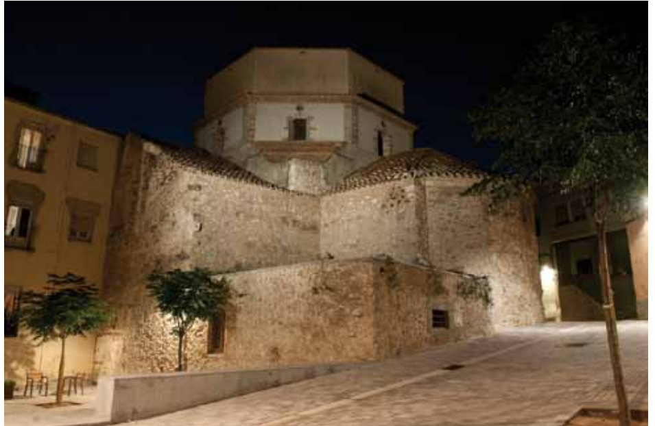
• Vista actual de la façana de llevant de l'església parroquial de Santa Maria

La Jonquera és un comerç obert tots els dies de l'any i això molts no ho perdonen. Venem mercaderies que vénen de tot arreu. Per lo tant, tothom participa dels beneficis. El dia