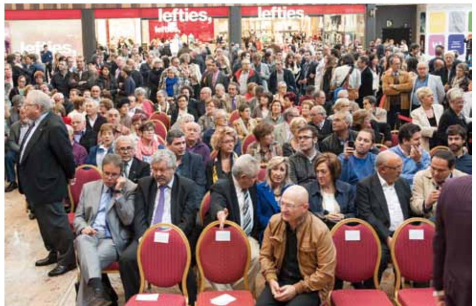
• Moments previs a la inauguració de l'outlet & shopping Gran Jonquera