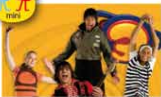
Super3 en concert