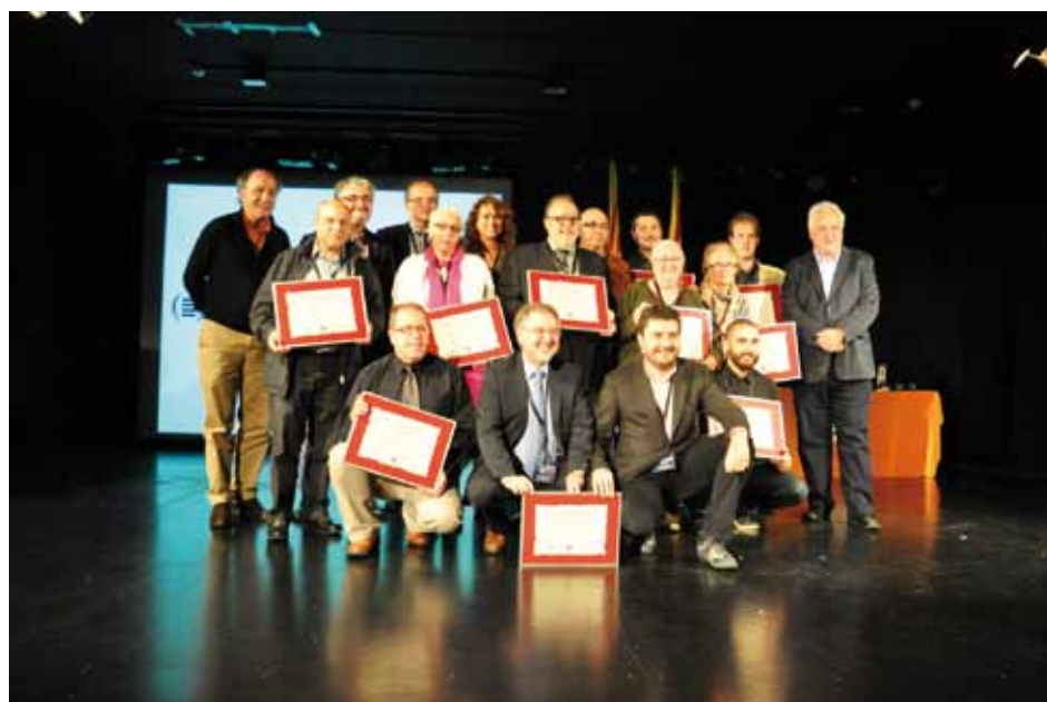
• Representants de les publicacions que celebraven els 25, 30, 35, 40 o 65 anys. (ACPC)