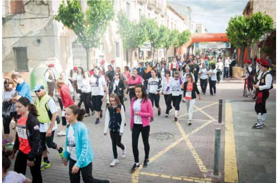
• Sortida dels caminants que van participar a la Marxa dels Dòlmens

A pas tranquil passem pel passadís dels Trabucaires i travessem el carrer Major, encara fumejant pels trets dels trabucs, fins arribar a Bosch de la Trinxeria. Girem i enfilem cap al carrer Horta d'en Geli on de seguida abandonem el carrer pavimentat i ens endinsem al bosc per un corriol humit. En fila índia anem guanyant metres cap a munt, sota un sol que en absolut escalfa, malgrat ser un 19 de maig. La temperatura és agradable però al cel es deixen entreveure alguns núvols que entranynen a la nostra esquena la visió cap a les Salines. Passem dos còrrecs d'aigua, un dels quals és el de Santa Llúcia