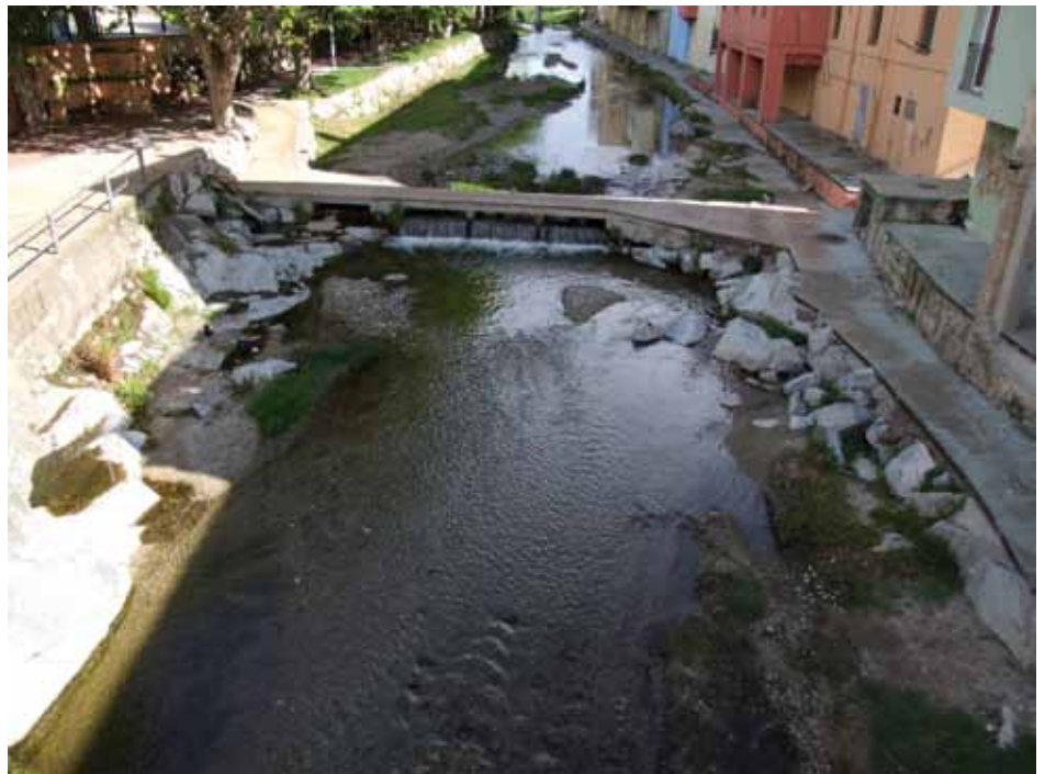
• El Llobregat d'Empordà amb aigua neta i transparent des de fa mesos

El mes de maig ha resultat com li pertoca i com diu la dita: "pel Maig cada dia un raig". Bosc verd, fons amb aigua, riu amb aigua neta i transparent. Hem optat altre cop per una imatge de dins el casc urbà, en aquest cas del Llobregat. ■