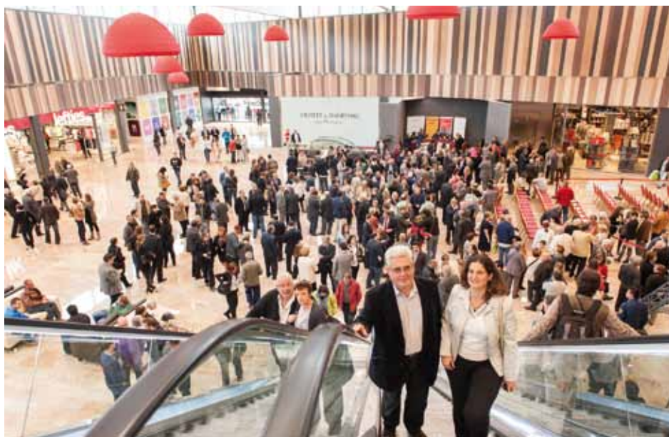
• Moments previs a la inauguració de l'outlet shopping Gran Jonquera