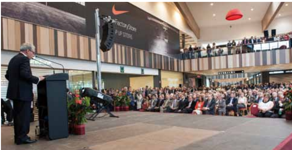
• Acte d'inauguració de l'outlet Gran Jonquera