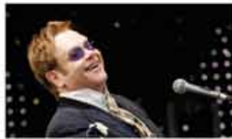
Sir Elton John