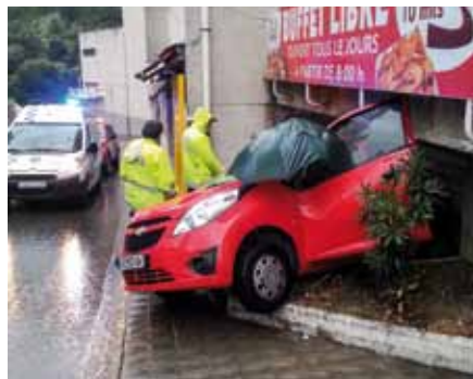
• El vehicle accidentat el dimecres 8 de maig al carrer Dr. Subirós del Portús