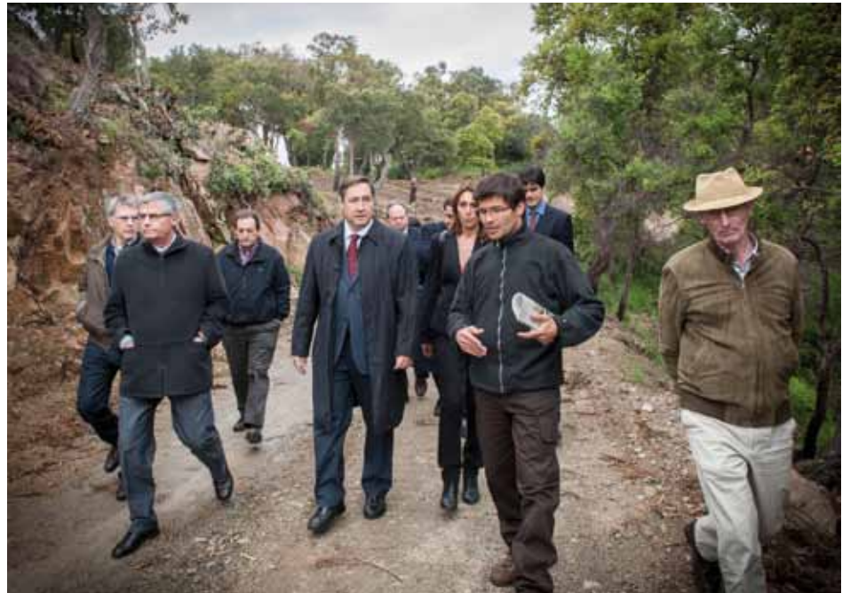
• El conseller i autoritats locals i comarcals visitant una zona boscosa de la Jonquera

per exemple, a l'Ajuntament de Sant Climent Sescebes l'han sancionat amb 50.000 euros.