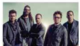
Gossos + Blaumut