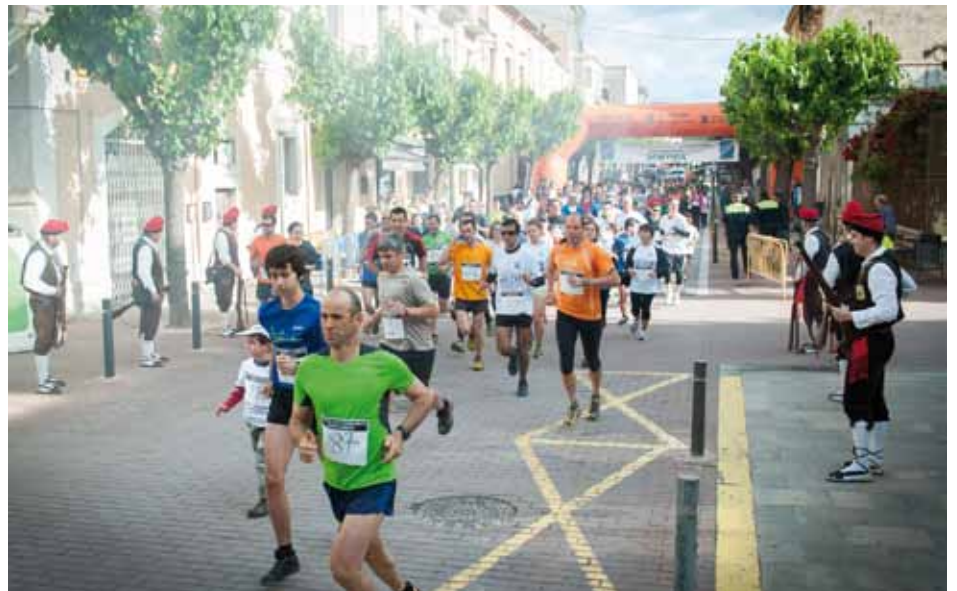
• Sortida dels corredors, passant pel passadís creat pels Trabucaires de l'Albera