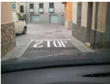
• Dijous 30 de maig

Això és el que va passar al carrer Sant Miquel. Dijous apareixia aquest Stop amb la "S" invertida i només 24 després, reapareixia correctament. Això és eficiència!