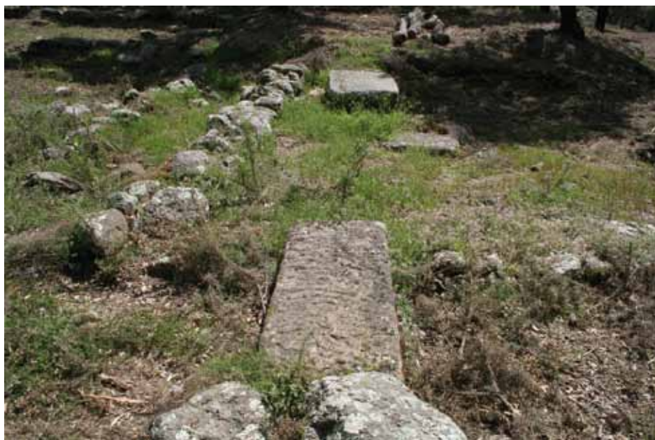
• Mansio summum pyrenaicum del coll de Panissars

Una possibilitat que comportaria l'existència de dues mansios tan properes podria ser la creixent importància de l'ús del pas del Portús que, posteriorment, en època medieval, substituirà en gran mesura el del Panissars. En aquest cas els viatgers que travessessin pel Portús no tenien accés a la mansio de Panissars, i d'aquí la importància de Deciana.