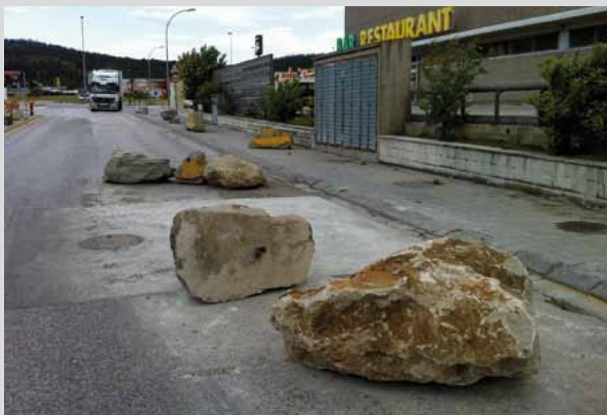
• Aquestes pedrotes van aparèixer al carrer Euskadi el divendres 24 de maig

Grans pedres, com les que habitualment es fan servir per a la construcció d'esculleres, ocupen el centre dels vials per evitar el pas dels vehicles de gran tonatge. Una mesura contundent, i si es vol poc estètica, però molt econòmica!