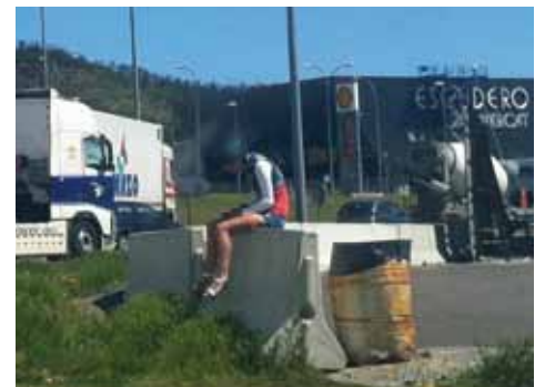
• Una noia espera possibles clients a la rotonda de Can Quartos