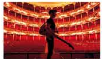
Fito & Fitipaldis