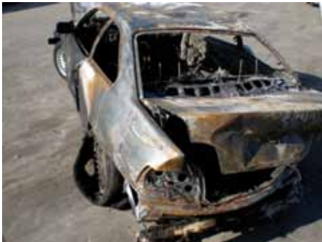
• El BMW 320 totalment calcinat la matinada del 5 de maig

Interceptats 2,1 quilos de cocaïna i cinc d'haixix a l'interior de dos vehicles i dues detencions a persones de nacionalitat colombiana i francesa. La primera de les detencions es va produir a la una del matí del dilluns quan els agents van interceptar el conductor i únic ocupant d'un vehicle de matrícula francesa que circulava en sentit nord i a qui li van trobar sota el seient de l'acompanyant diversos paquets on hi havia cinc quilos d'haixix i 100 grams de cocaïna, i van detenir A.R., de 33 anys i nacionalitat francesa. La segona detenció es va produir 24 hores més tard després de trobar-li dos quilos de cocaïna a la roda de recanvi. ■