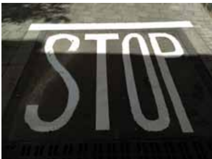
• Divendres 31 de maig