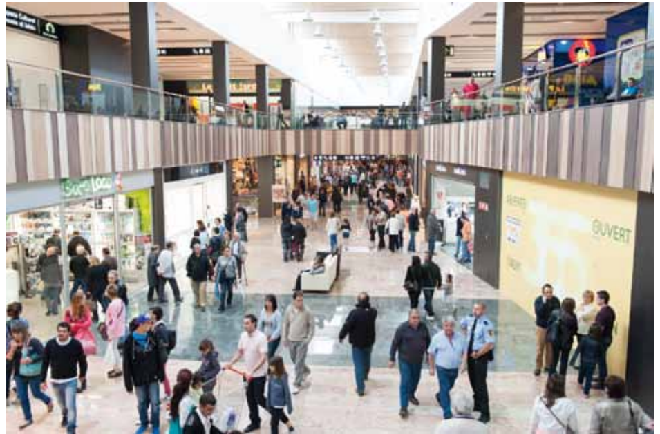
• Imatge general del passadís central de l'outlet Gran Jonquera

Humilment, no puc donar lliçons a ningú. Però crec en dues coses: una és que hem