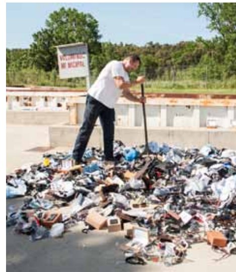
• La Brigada municipal destrueix objectes de consum comissats als “top manta”

Entre els objectes més freqüentment comissats hi ha gorres, ulleres o bosses de mà, entre molts altres, però també s'han detectat perfums o banyadors.