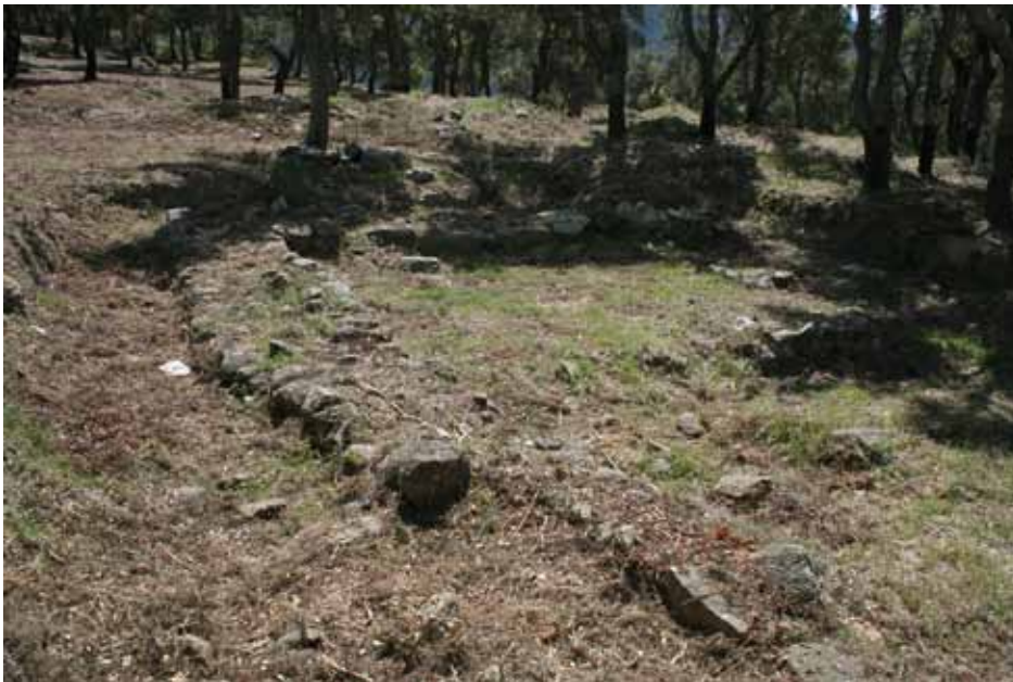
• Mansio del coll de Panissars en l'actualitat